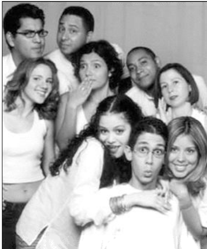
Los hijos adolescentes necesitan padres a imagen de Dios

Dorothy Parker escribe: "El mejor medio de animar a tus hijos a que se queden en casa es