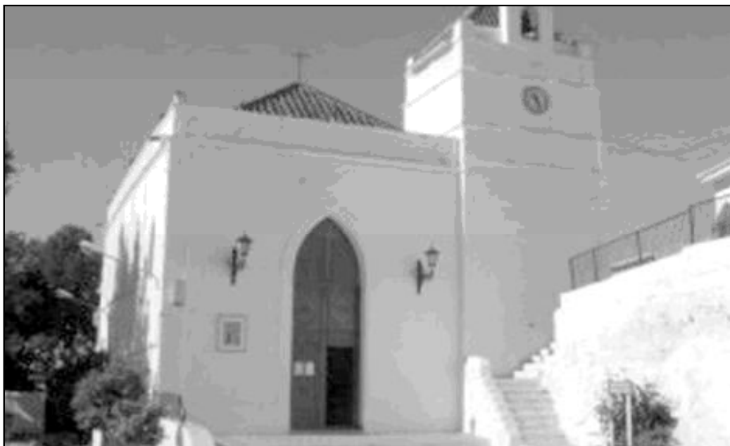
Fachada de la parroquia de Nuestra Señora de las Maravillas, en Maro

El edificio consta de una única nave de la que destaca el retablo del Altar Mayor, que alberga la imagen tan querida, y venerada por los mareños de Ntra. Sra. de las Maravillas: una talla posterior a la guerra, que fue restaurada hace algunos años. Su belleza singular y su mirada, llegan enseñada al corazón de todos los que con fe y devoción acuden a venerarla.