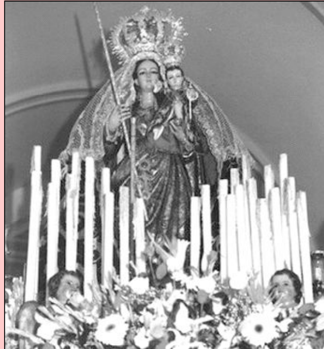
Virgen de la Candelaria, patrona de Colmenar