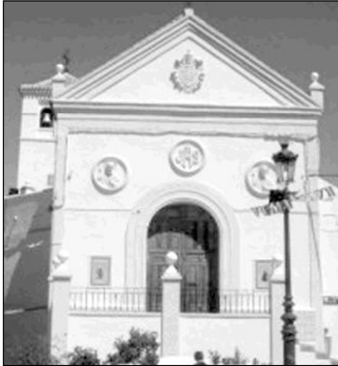
Fachada del templo de Iznate, que acaba de ser restaurado

Es una de las 16 parroquias que, en la actualidad, están en construcción o en rehabilitación. En la zona de la Axarquía continúan las obras de rehabilitación de la parroquia de San Juan Bautista, en Vélez-Málaga, y se están construyendo las de Santiago El Mayor, en El Morche, y la de San José, en Vélez-Málaga.