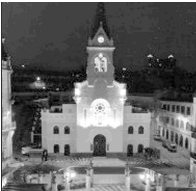
Fachada de la parroquia Sagrado Corazón, en Melilla

Uno de los acontecimientos más destacados del año es la Semana Santa. De hecho, gran parte de la devoción de los fieles de la parroquia la concentran dos veneradísimas imágenes: la Virgen de la Soledad y el Cristo