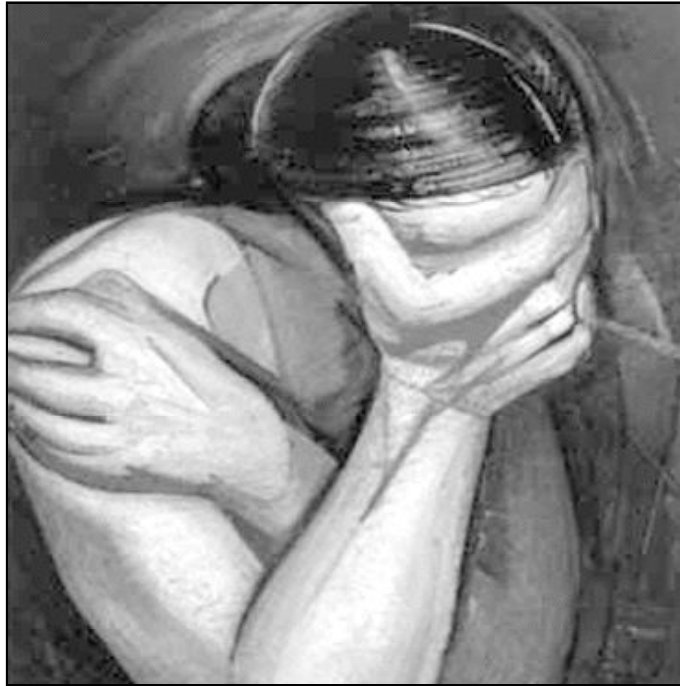
"Angustia". Óleo de David Alfaro Siqueiros

llena de inquietudes pensando en sus cosas, pero tú que conoces a Dios y su modo de actuar, debes ser distinto.