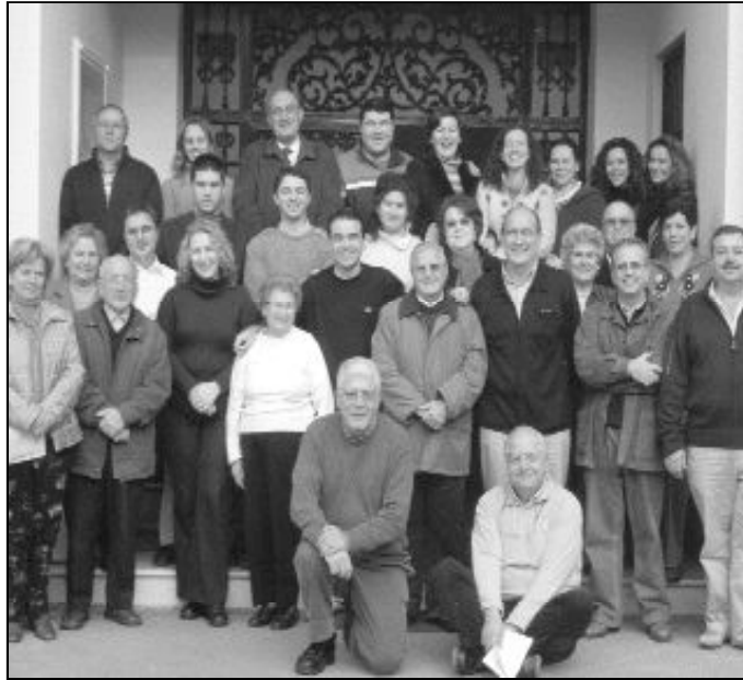
Participantes del cursillo de cristiandad nº 548, el último realizado hasta hoy en Málaga