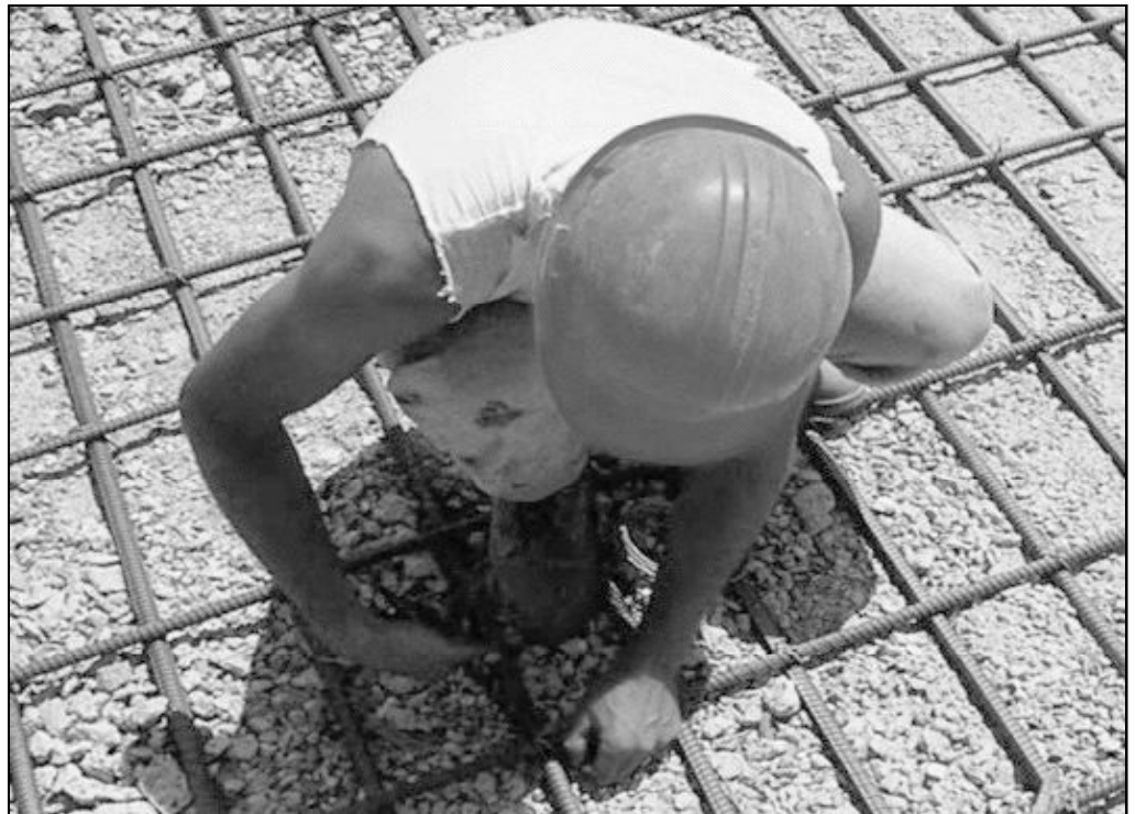
Detalle del cartel anunciador del Simposio de Pastoral Obrera

El objetivo de este encuentro es crear un foro diocesano de conocimiento y profundización sobre la influencia de las condiciones de trabajo en la vida de la familia y la juventud actuales. Además, se busca conducir en unas líneas de avance que ayuden a afrontar desde el Evangelio los retos que esta nueva realidad nos plantea, teniendo en cuenta los criterios de la Doctrina Social de la Iglesia. Para inscribirse basta visitar la página web www.diocesismalaga.es .