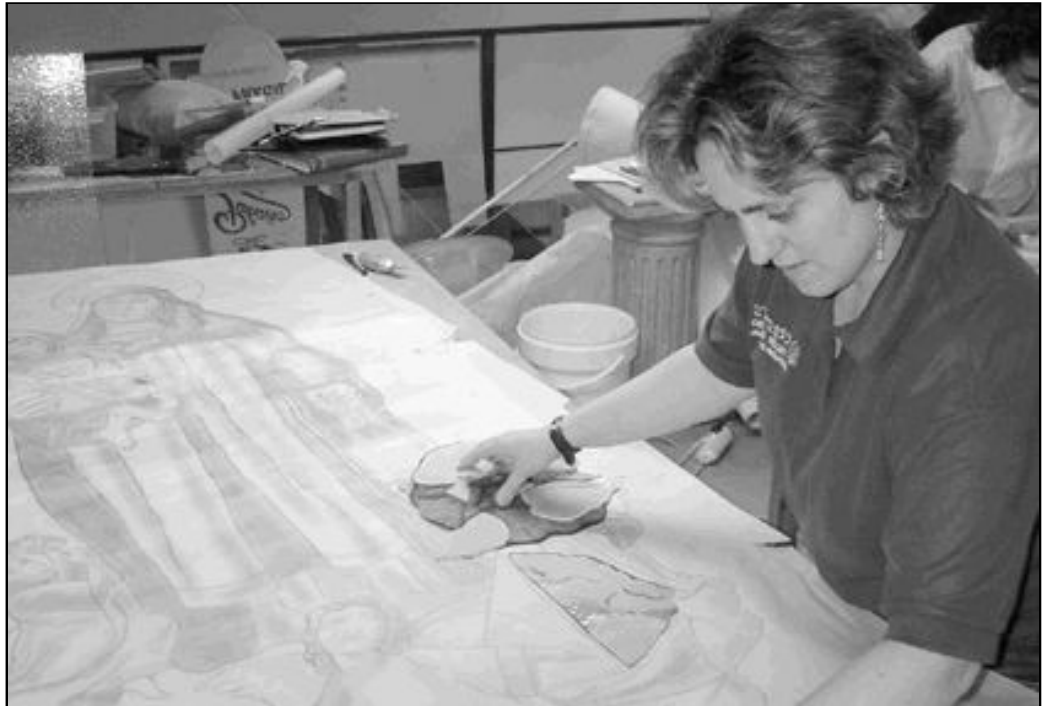
La Doctrina Social de la Iglesia nos invita a ver el trabajo desde el punto de vista del bien del hombre

A la luz de la Doctrina Social de la Iglesia, el secretariado de Pastoral Obrera ha hecho pública una nota en la que alerta sobre la influencia que los cambios en las condiciones laborales y en la concepción del trabajo mismo tienen en la construcción de la familia y en el desarrollo, la educación y la cultura juvenil. Cuando se habla de la flexibilidad horaria, salarial, geográfica y funcional se prescinde de dimensiones básicas de la vida humana como son la familia, la vocación profesional, social y política. «Todo queda eliminado para obtener un individuo que no tiene otra preocupación que trabajar». Como cristianos debemos reflexionar sobre esto y actuar para alcanzar la justicia.