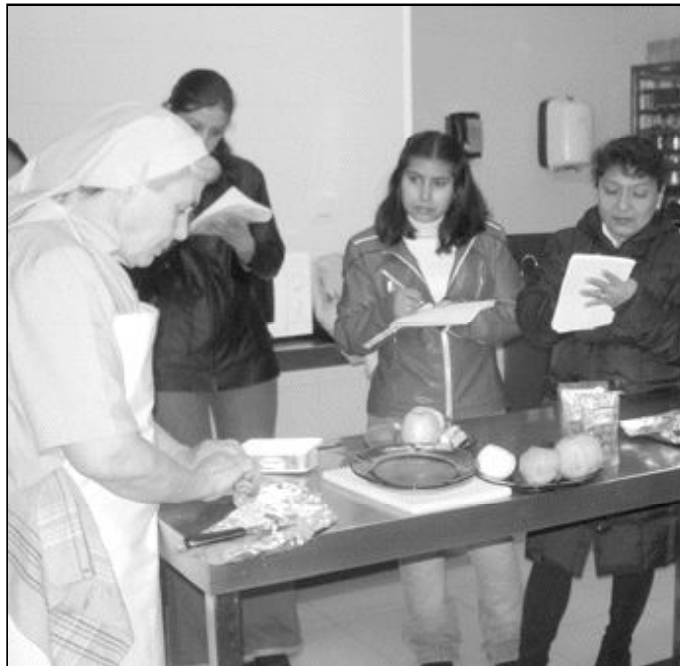
Una religiosa da clases de cocina a inmigrantes en el centro social de calle la Victoria