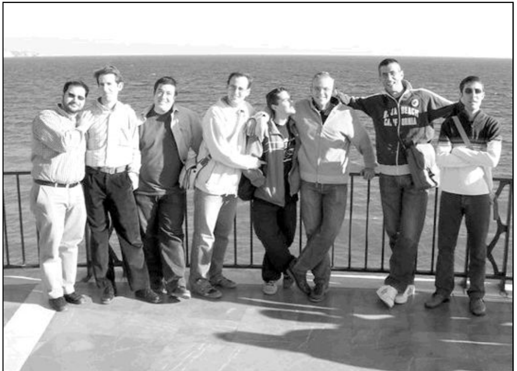
Un grupo de seminaristas de Málaga en el Balcón de Europa