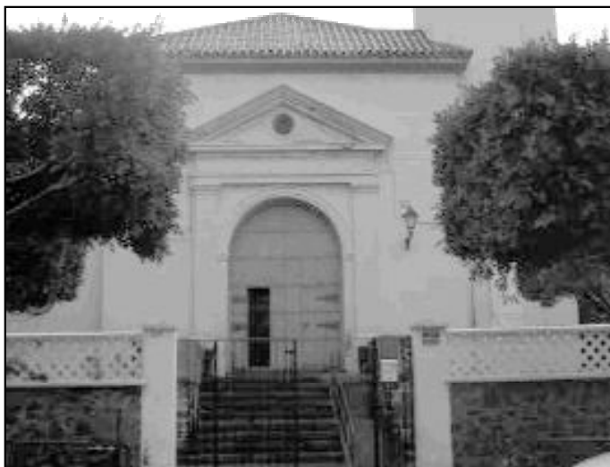
Fachada de la parroquia Sta. María Micaela, en Melilla

Dentro del templo, en una de las capillas laterales, nos encontramos con dos imágenes que cuentan con una especial devoción popular. Son las de Jesús Cautivo de Medinaceli y María Santísima del Rocío que salen en procesión el Jueves Santo, con la liberación de un preso, y el Domingo de Resurrección, en el que se produce