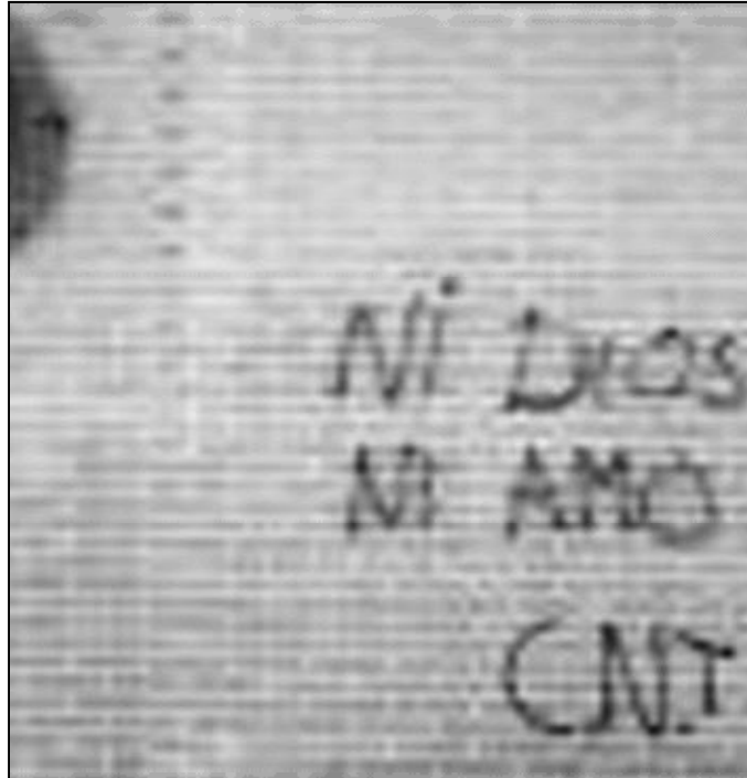
Pintada aparecida en la fachada de una iglesia

Una exposición de arte en el East End de Londres, titulada "Pinturas Sonofagó", bajo el título "¿Fue Jesús heterosexual?", describía las obras expuestas como un asalto a las instituciones de superstición y creencia religiosa. Conviene matizar que sólo se ataca al catolicismo, no a las religiones en general. Un periodista de The Observer , Nick Cohen, ha escrito: «si los propietarios de la galería hicieran lo mismo con el Islam, les caería encima el mismo infierno». En EE. UU., toda la portada del último número de la Revista "Rolling Stone" la ocupa un rapero con la corona de espinas de Jesucristo y, en un "corto" cinematográfico de "The spirit of Christmas", aparece una escena con una pelea a puñetazos entre Cristo y Santa Claus. A la vez, en