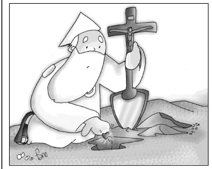
«Si el grano muere dará mucho fruto.»