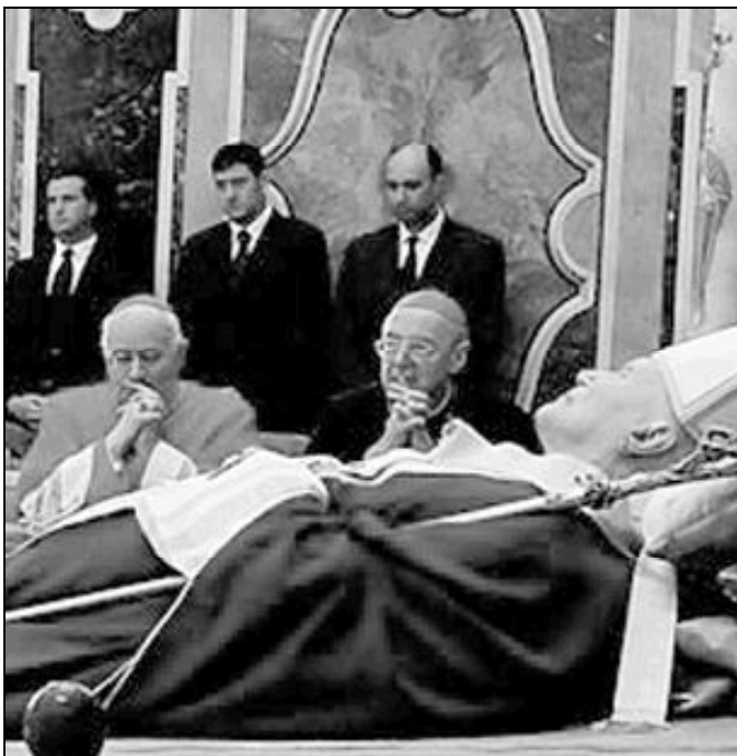
Cuerpo sin vida de Juan Pablo II

Juan Pablo II fue un hombre de Dios. Sólo eso. Su larga e inolvidable trayectoria se centró, efectivamente, en desarrollar su carisma, pero éste no fue una manifes-