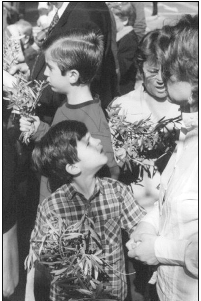
Un niño en la procesión del Domingo de Ramos