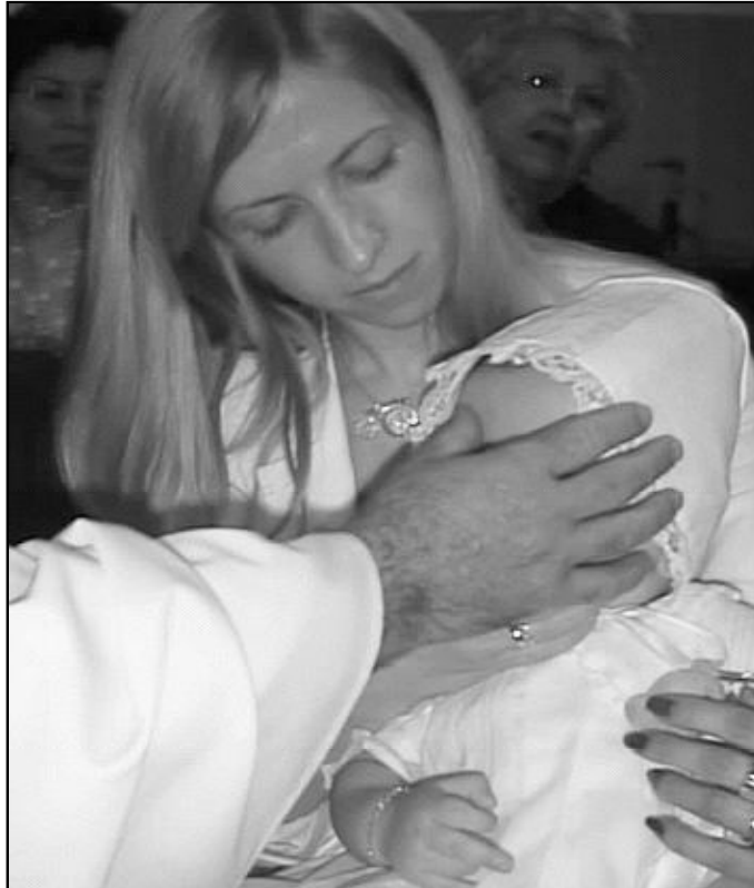
En la Vigilia Pascual muchos padres bautizan a sus hijos

El Triduo Pascual comienza el Jueves Santo, día en que se celebran dos actos: a las 11,30 horas, la celebración comunitaria de la penitencia, para la cual numerosos confesores se distribuirán por la Catedral con el deseo de atender