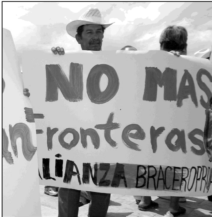
Dice Jesús en el Evangelio: "Fui extranjero y me acogisteis"

La Iglesia Católica norteamericana está haciendo una decidida y abierta campaña para que se respeten los derechos humanos de los emigrantes. Setenta dióce-