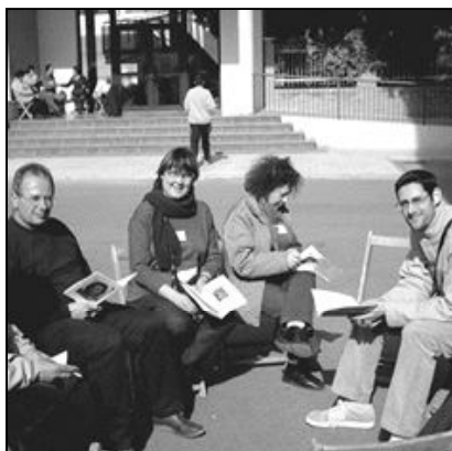
LAS COMUNIDADES MIES

La asociación Misioneros de la Esperanza (MIES) fue fundada por el sacerdote Diego Ernesto Wilson y tiene cerca de 50 años de historia. En Málaga cuenta con casi 500 miembros y tiene su sede central en la Rampa de la Aurora. En los últimos años se ha extendido también a otras diócesis españolas y, fuera de España, a Ecuador, Paraguay y Argentina. En la actualidad MIES tiene misioneros en Italia, Irlanda del Norte y Estados Unidos. Los laicos y sacerdotes que pertenecen a ella, se dedican especialmente al apostolado de niños y jóvenes, y se caracterizan, además, por su devoción a la Virgen y su trabajo por "la liberación integral de las personas".