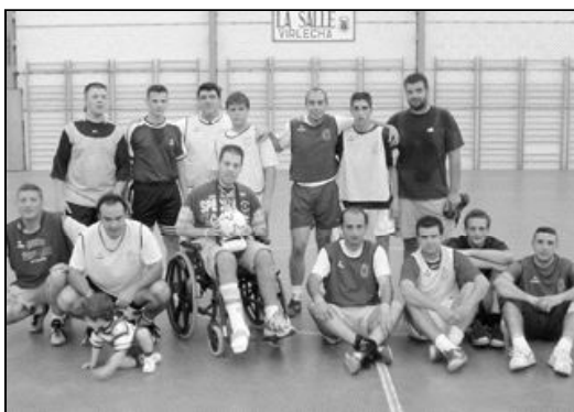
Equipo de responsables del Torneo de fútbol de Antequera

Fue una jornada llena de ilusión, amistad y diversión entre todas las parroquias de Antequera. Una jornada que era la guinda de todo un torneo donde este año han participado también las niñas. Después de salvar los caprichos del tiempo que nos hicieron suspender varias jornadas, pudimos desarrollar el torneo con éxito. Este año los ganadores del II torneo Interparroquial han sido: en la categoría de niños, la parroquia de San