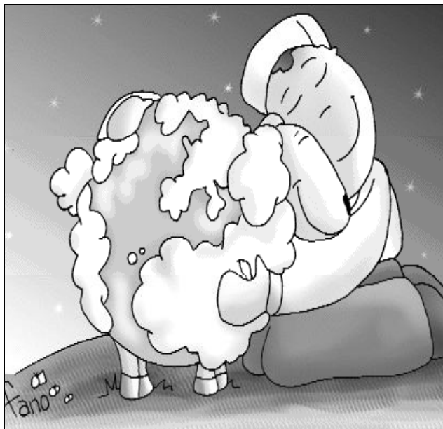
"Yo soy el buen pastor"

Cristo está vivo, está resucitado, sabemos que la vida tiene sentido y que estamos acompañados por alguien que nos quiere y nos ama, que se preocupa de nosotros.