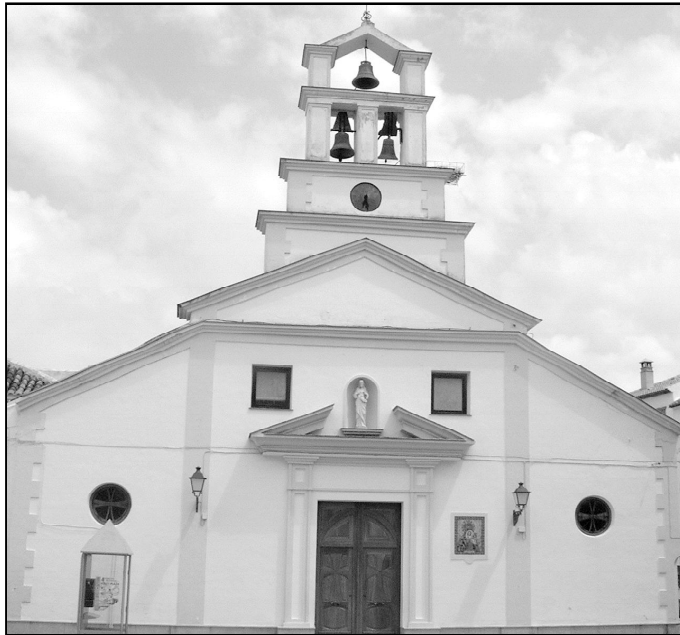
Fachada del templo parroquial de Molina

Con los niños, cada año se celebra una liga de fútbol, el teatro de Navidad y la campaña Sembradores de estrellas (hay muchos inscritos en la Revista Gesto Misionero), y al final de curso, una excursión de catequesis. También hay que destacar el trabajo de Cáritas con los inmigrantes (encuentro anual, clases de español), así como la sensibilización de la comunidad a través de su boletín, barattillo solidario de Manos Unidas y la Eucaristía. El grupo de Pastoral de la Salud se reúne una vez al