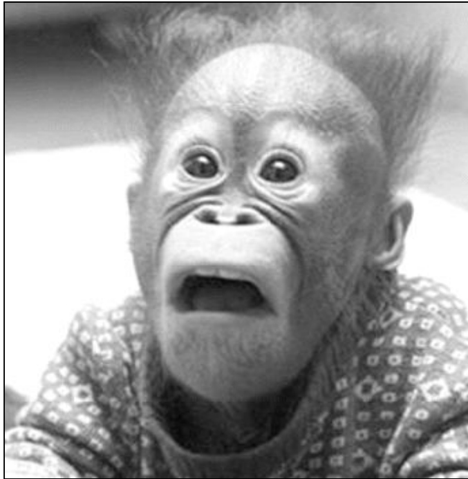
El argumento utilizado es la vecindad genética del ser humano con los simios

Uno de los grandes patrocinadores del proyecto "gran simio", al que podría adherirse España, es el bioético americano Peter Singer, profesor de la universidad de Princeton, cuyas teorías causaron cierto impacto en el mundo científico no hace mucho. El profesor