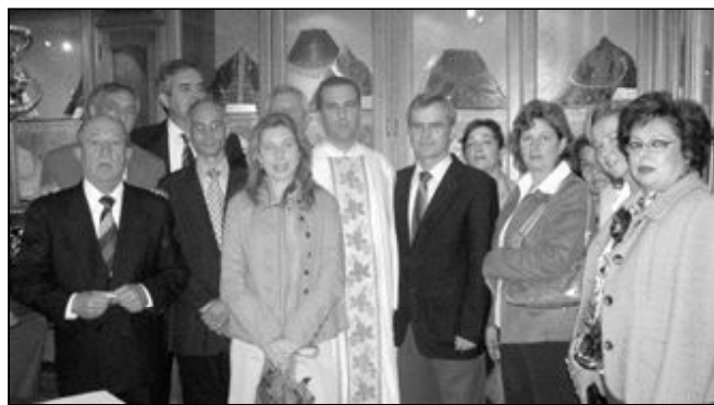
MUSEO EN LA PARROQUIA DE SAN PEDRO DE CÁRTAMA Los salones parroquiales de Cártama acogen una exposición permanente en torno a la imagen de Ntra. Sra. de los Remedios, su patrona. En ella se exponen enseres de la Virgen, así como fotografías antiguas. El horario de visitas es de mañana y tarde. En la foto, momento del acto de inauguración.