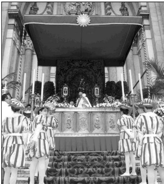
Altar de la Adoración Nocturna para el Corpus Christi del 2005

representación juvenil, también en su junta de gobierno, trabaja por mantener vivo el testimonio de los Patronos, mediante una comprometida implicación pastoral y económica en la parroquia de los