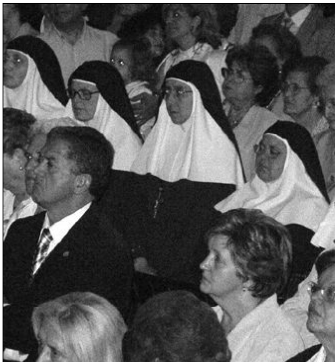
Todas las vocaciones son necesarias en la Iglesia

La semana pasada, Solemnidad de Pentecostés, celebramos el día de los seglares; y esta semana, Solemnidad de la Santísima Trinidad, conmemoramos el "Día pro-orantibus"; es