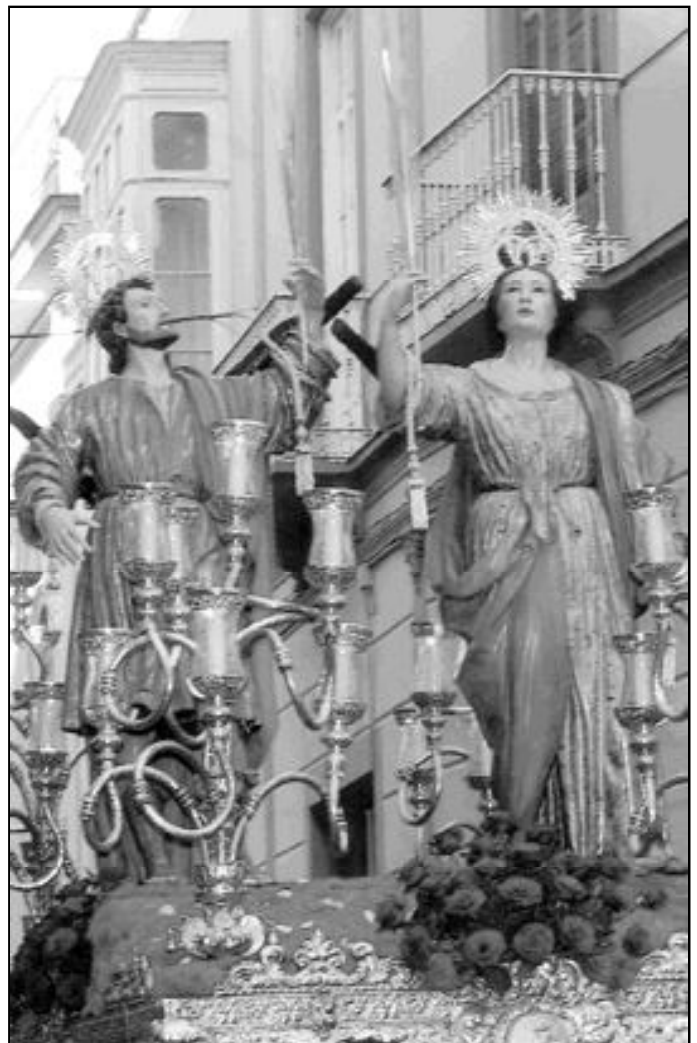
Los santos Patronos en su procesión por las calles de Málaga