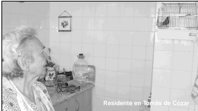
Residente en Tomás de Cózar

◆ Como consecuencia del aumento de la esperanza de vida, nos encontramos con un número creciente de personas mayores que, en ocasiones, carecen de recursos económicos y tienen graves problemas de vivienda y salud. Caritas trata de buscar la solución idónea para estas situaciones con la vista puesta, como siempre, en el escrupuloso respeto de la dignidad personal. Dentro del programa, destacan dos obras significativas: