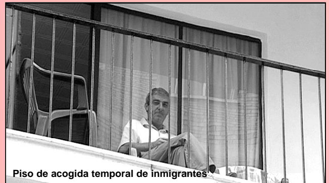
Piso de acogida temporal de inmigrantes

Las 54 plazas con las que cuenta se encuentran totalmente cubiertas. La Unidad de Estancia Diurna y el Programa de Respiro Familiar han cubierto permanentemente su función, no quedando en ningún momento plazas vacías y consolidando una importante lista de espera.