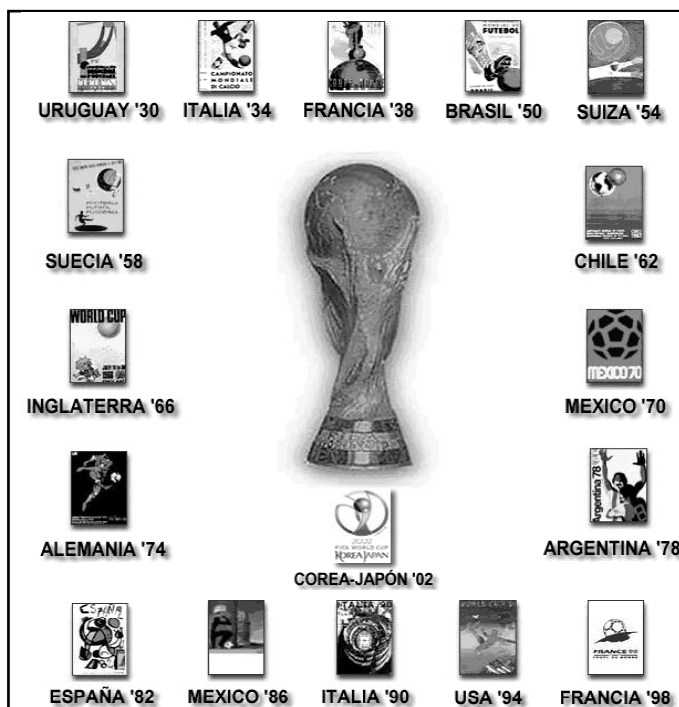
Cartel del Mundial de Fútbol Alemania 2006

Unas 50.000 mujeres podrían ser el otro entretenimiento del hincha, en un país donde la prostitución está legalizada, pero donde las mafias siguen actuando. El Consejo de Europa, que vela por los derechos humanos, ha pedido a la Federación Internacional de Fútbol (FIFA) que condene este tráfico de mujeres. Ya lo ha condenado la Confederación Internacional de Cáritas. «Ésta podría ser la profesión más vieja del mundo, pero la causa de ella es siempre la vulnerabilidad de la mujer que, en muchos sentidos, no ha cambiado tanto en todos estos años», afirma Duncan MacLaren, secretario general de Caritas Internationalis. «Muchas mujeres dirán que ésa es la vida que han escogido vivir, pero la desesperación económica o la falta de ciertas estructuras sociales obligan a las mujeres a la prostitución, deján-