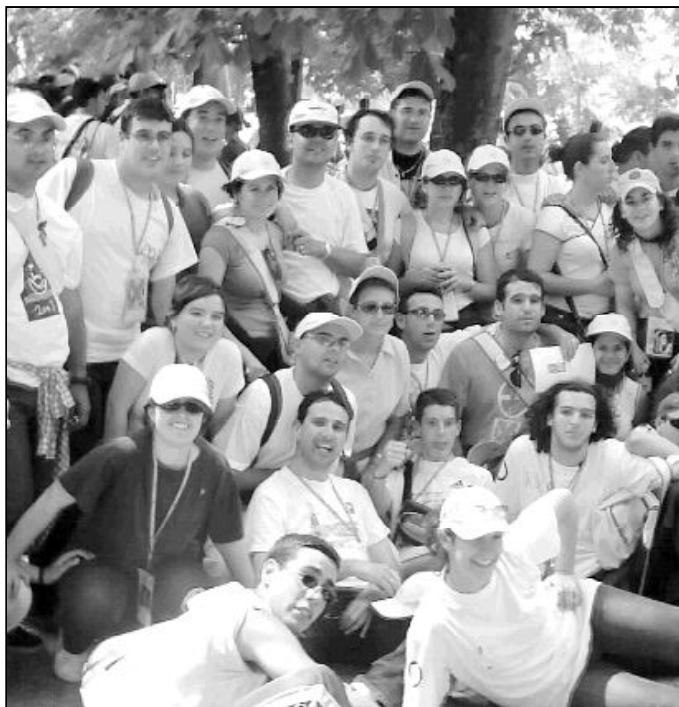
Jóvenes malagueños en un Encuentro Mundial de Jóvenes

Las Misioneras Identes, presentes en Málaga desde hace algunos