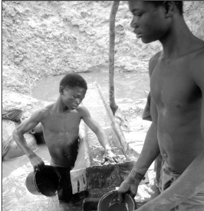
La Iglesia sigue denunciando la explotación laboral de los niños

En torno a las 14 horas llegará a pie al palacio Arzobispal, residencia oficial de Joseph Ratzinger en Valencia. Esa misma tarde, a las 17,15 horas, Benedicto XVI realizará una visita de cortesía a los Reyes de España en el Palacio de la Generalidad. De regreso, a las 18,30 horas, recibirá al presidente del Gobierno de España en el Palacio del Arzobispado. Hacia las