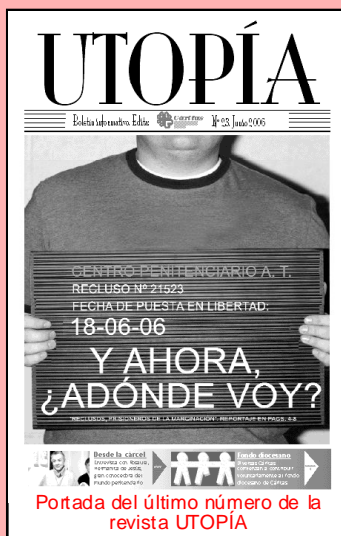
Portada del último número de la revista UTOPIA

-Edición de la revista "Utopía" y de suplementos sobre Caritas en la revista "Diócesis", como éste.