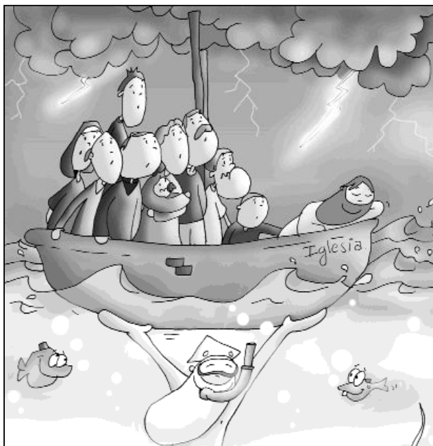
«El Señor sostiene a su Iglesia. No temáis.»

do. Y Jesús nos pide confianza en su palabra y en su persona. Sólo necesitamos abrir nuestros ojos y mirar alrededor. Jesús no ha venido a imponer nada. Quien cree en él, ya participa de su amor, de su pobreza y de su perdón. Así venceremos la tempestad y nuestra barca no se hundirá, porque en ella va Jesús, y muchos discípulos que si creen en él para no caer en el orgullo, en el afán de poder, en el desprecio a los demás, en la búsqueda del dinero como camino para la felicidad, en la incapacidad de perdonar y de dialogar. Cuando creemos de verdad en el Jesús de la