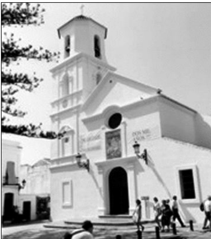
Fachada del templo de El Salvador, en Nerja

La comunidad parroquial, que a la hora de preparar cualquier actividad siempre destaca por su generosa y gustosa colaboración, está formada por distintos grupos: Primera Comunión, Perseverancia, Adultos, Liturgia, Cáritas, Pastoral Familiar y Pastoral de la Salud. Además, existen distintas Cofradías: la del Nazareno, la del Resucitado,