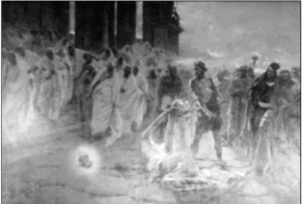
Decapitación de San Pablo (Santa Iglesia Catedral Basílica de la Encarnación, Málaga)

El enemigo busca destruirte. ¿Por qué? Porque quiere aniquilar lo que Dios ha colocado ante ti, este grano capaz de producir una cosecha para Dios en esta