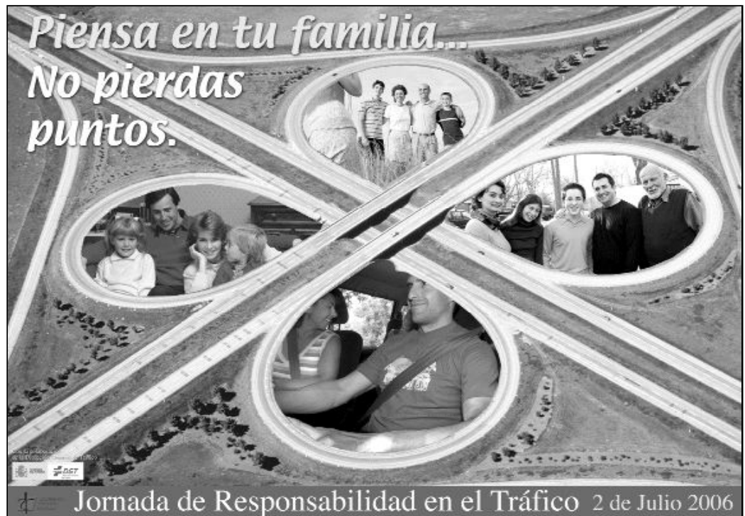
Cartel anunciador de la Jornada de Responsabilidad en el Tráfico