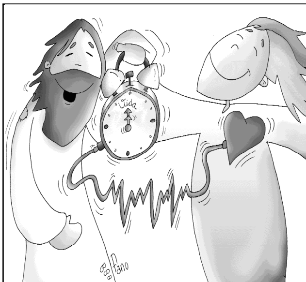
"Talithakum: despierta a la vida"

hace en la cruz, dándose totalmente a Dios y a los hombres, y realizando así el paso de la muerte a la vida.