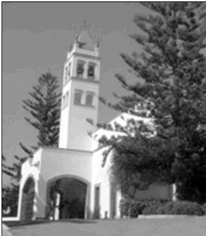
Fachada del templo de "La Virgen Madre", en Nueva Andalucía, Marbella

El complejo parroquial está formado por 3 grandes salones;