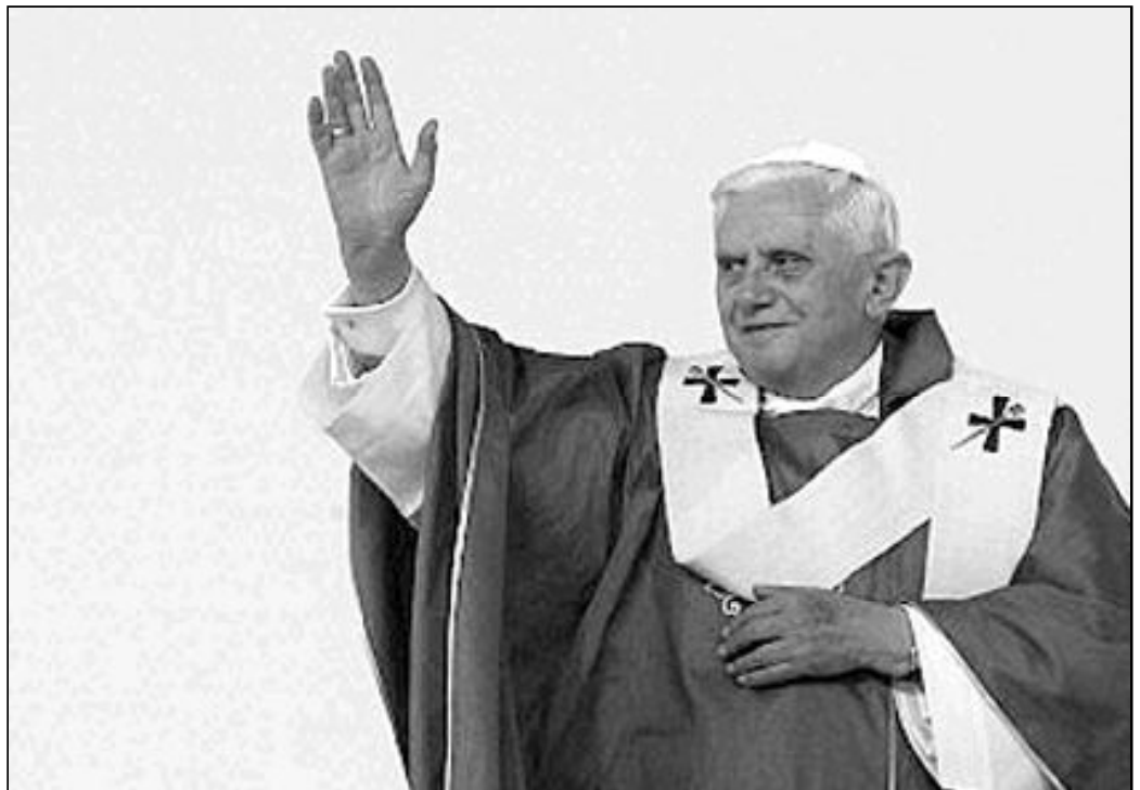
El Papa ha señalado que una de las tareas más grandes de la familia es la de formar personas libres