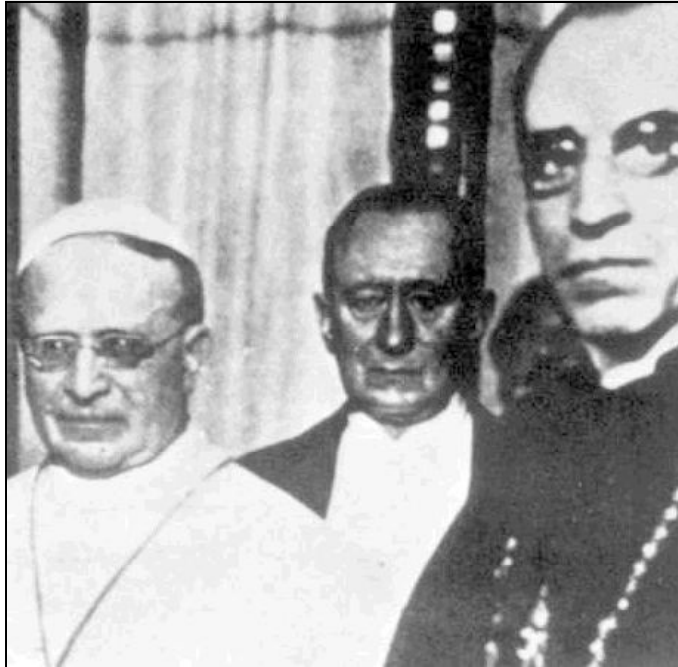
El Papa Pío XI y el futuro Papa Pío XII

Los archivos permitirán comprender mejor cuál fue la actitud del Papa ante estos totalita-