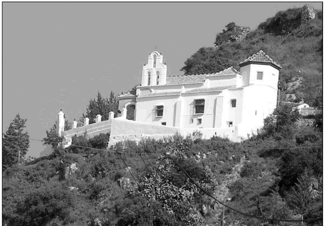
Ermita de Nuestra Señora de los Remedios, en Cártama