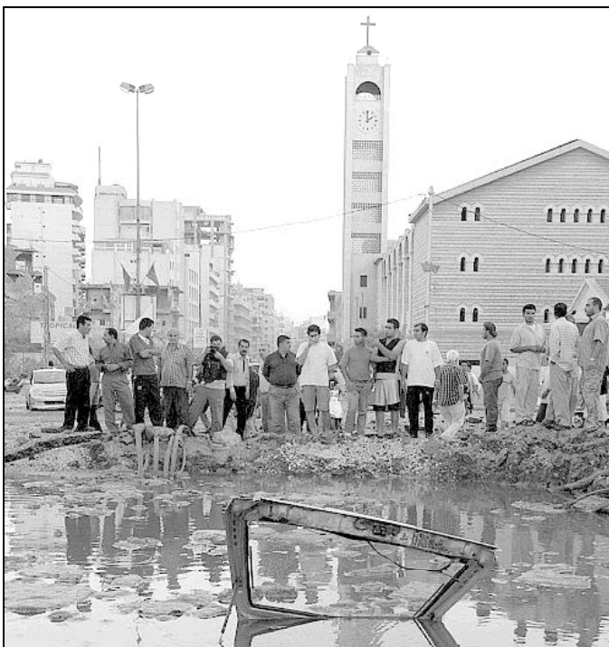
Cráter causado por un misil israelí en el área de la iglesia de San Miguel, en Beirut.

El mensaje de Benedicto XVI para la XL Jornada Mundial de la Paz —que se celebrará el 1 de enero de 2007— estará dedicado al tema: «Persona humana: corazón de la paz». Un comunicado de la Sala de Prensa vaticana ha difundido el núcleo temático elegido por el Papa para su próxima reflexión. El tema «expresa la convicción de que el respeto de la dignidad de la persona es una condición esencial para la paz de la familia humana», apunta el comunicado. La nota vaticana se detiene en las amenazas que se ciernen actualmente sobre la dignidad del hombre. «Hoy, probablemente con fuerza persuasiva y medios más eficaces que en el pasado, la dignidad humana está amenazada por ideologías aberrantes, agredida por un uso distorsionado de la ciencia y de la técnica, contradicha por difundidos estilos de vida incongruentes», observa. Alude explícitamente a «ideologías marcadas de nihilismo», o al «fanatismo (materialista o religioso)», que «pretenden negar o imponer presuntas verdades sobre la realidad, sobre el hombre o sobre Dios». Y no omite que «la ciencia y la técni-