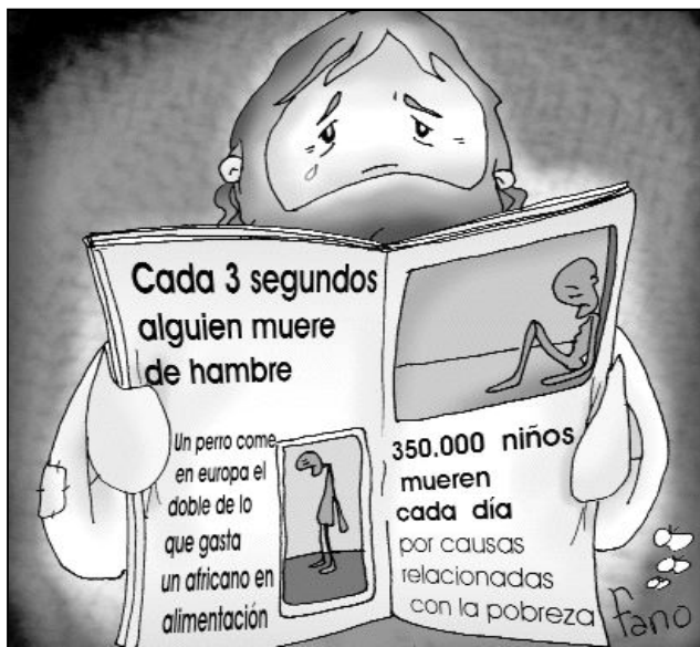
"Dadles vosotros de comer"

el gran milagro, el compartir de lo que tenemos y somos, y no solamente de lo que nos sobra, porque eso es muy fácil darlo. Es la gran lección y el gran milagro: no ser egoístas, ser solidarios, vivir desde la fraternidad y el compartir.