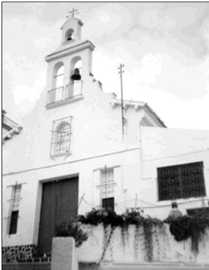
Fachada de la parroquia de Olías

El templo está presidido por una imagen de Jesús crucificado, a cuyos lados existen dos altares con las imágenes de María Inmaculada y del patrón, San Vicente Ferrer, además de una Dolorosa y un Nazareno, que se encuentran en dos capillas situadas a ambos lados de la puerta de entrada. En la nave central también podemos