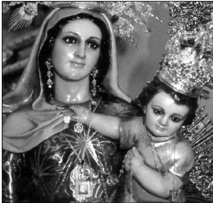
Imagen de la Virgen del Rosario de Fuengirola

Al menos 18 templos parroquiales de la provincia de Málaga tienen como titular a Nuestra Señora del Rosario, cuya fiesta se celebra el 7 de octubre: Alcaucín, Algatocín, Benahavís, Benajafé, Benaolán, Canillas de Aceituno, Cartajima, Cortes de la Frontera, Childes, El Borge, Faraján, Fuengirola, Jimera de Líbar, La Cala del Moral, Secadero, Serrato y Villanueva del Rosario, en la provincia; y la parroquia de Cristo Rey y Nuestra Señora del Rosario, en la zona de Ciudad Jardín, de la capital. Éstas son las parroquias cuya advocación es la de la Virgen del Rosario, pero su fiesta se celebra en otras muchas parroquias que aprovechan la ocasión para honrar a nuestra Madre. Es el caso de Coín.