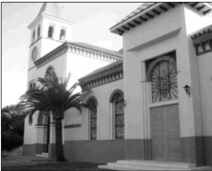
Fachada del nuevo templo parroquial de Nuestra Señora de los Dolores

Esta ampliación ha venido a dar respuesta a la realidad de la parroquia, que ha crecido de forma considerable en los últimos años y que no contaba con el espacio suficiente para albergar a una comunidad parroquial tan amplia y diversa. El nuevo templo posee nueve amplios salones para las catequesis, además de un gran salón de actos con capacidad para 150 personas, 900 columbarios y un oratorio, el que utilizó D. Ángel Herrera Oria. Ahora que por fin han finalizado las obras, el