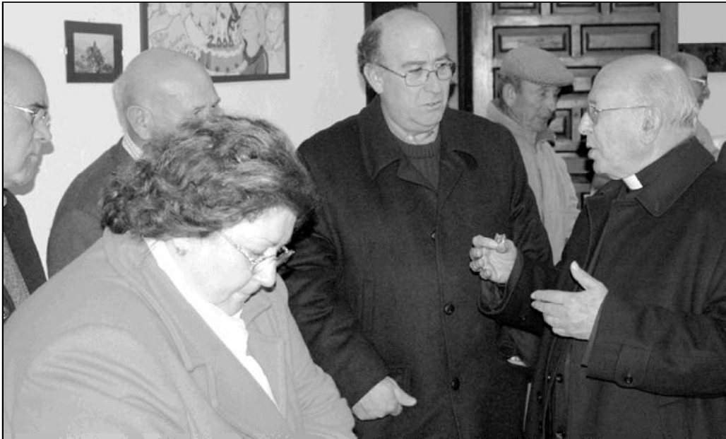
El Sr. Obispo charla con algunos de los asistentes a la clausura de la Misión Popular

La misión popular es sólo el inicio de una larga acción pastoral