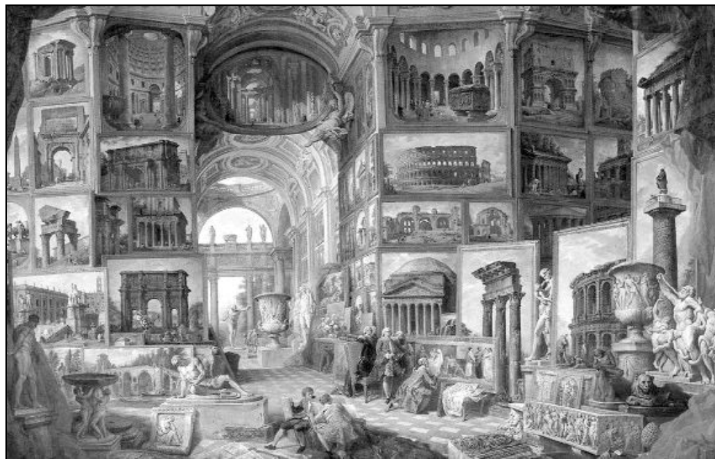
"Roma Antica", Giovanni Paolo Pannini

seguimos viviendo todos los que seguimos a Jesús. Tan incomparable es, que suscita la admiración y afecta e impacta a todos, hasta ser capaces de dar su vida por este singular revolucionario del amor.