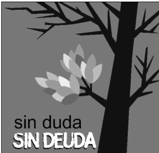
Detalle del cartel anunciador de la campaña

En un intento por mejorar la situación de esos países, se ha puesto en marcha la campaña "Sin duda, sin deuda: nuestro compromiso con los objetivos del milenio nos lo exige", organizada