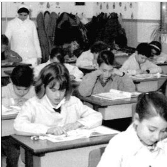
La Iglesia ahorra al Estado 6.000 millones de euros al año en el Área Social

Para situar correctamente este acuerdo, hay recordar que la diócesis de Málaga recibe directa-