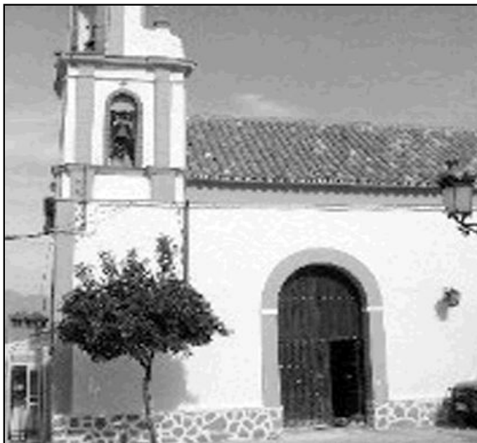
Fachada del templo parroquial de Pujerra

Una de ellas se encuentra en el templo parroquial y la otra, conocida como "el Esteponero", en una blanquísima ermita rodeada de almendros y alcornocales. Sin duda, merece la