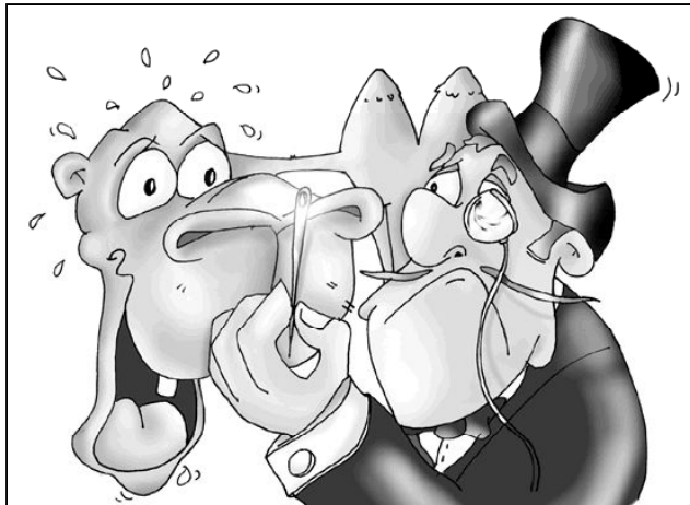
"Más fácil es que entre un camello por el ojo de una aguja..."

tenía que hacer algo: tenía que hacer dejar de tener. Es decir, ni hacer ni tener, sino ser.