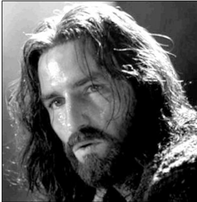
El Evangelio nos cuenta cómo el mismo Jesucristo fue tentado por el demonio

Intentará convencerte, mediante la lógica, de que no mereces el perdón de Dios, después apelará a tus sentimientos preguntándote si realmente tienes la "impresión" de que Dios te ha perdonado de verdad. En este campo debes luchar con firmeza. La victoria tiene este precio: no te dejes influir por sus mentiras. El perdón de Dios lo has adquirido ya, su palabra lo