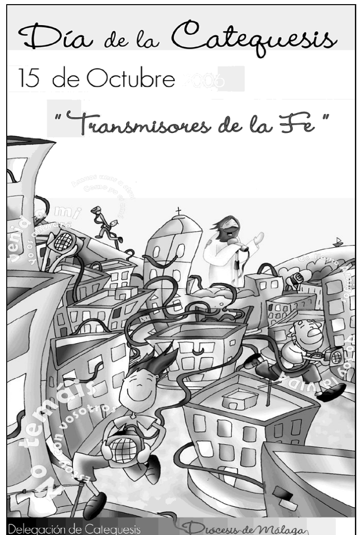
Cartel del Día de la Catequesis