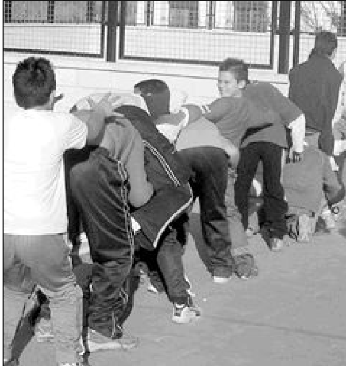
Chicos de Perseverancia del arciprestazgo S. Patricio en un día festivo

joven párroco (hace tan sólo seis años que fue ordenado sacerdote), lo más importante en un catequista de perseverancia es que "no le molest en los niños y adolescentes y sepa captar su interés y su atención".