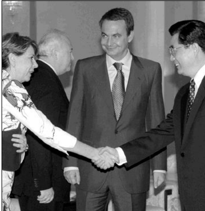
La ministra de Fomento y el presidente del Gobierno con el presidente chino

Se trata del «estilo que enseñó Jesucristo: el bien debe hacerse por sí mismo, y no por otros fines», por eso al aludir al compromiso de la Iglesia «en el ejercicio del amor evangélico», el Papa quiso «recordar que una eminente forma de caridad es la actividad