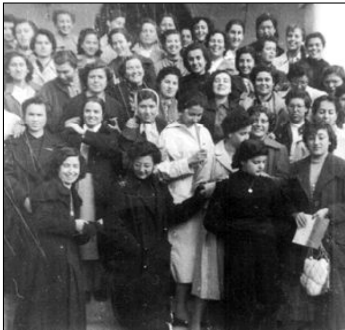
Un grupo de maestras rurales pioneras en la educación de la provincia