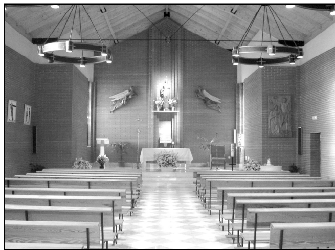
DEDICACIÓN DEL TEMPLO DE VILAFRANCO DEL GUADALHORCE