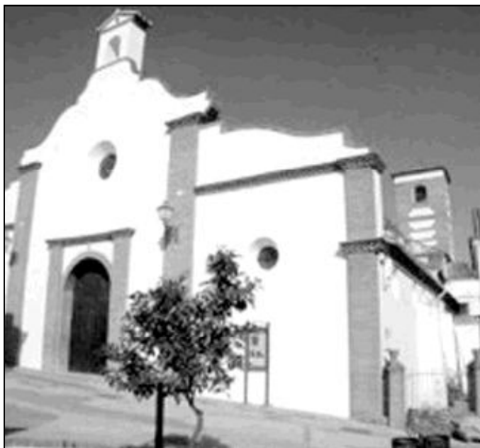
Fachada del templo parroquial de Riogordo

Ojeando su calendario festivo, nos encontramos con las fiestas patronales, en honor de Ntra. Sra. de Gracia, que se celebran