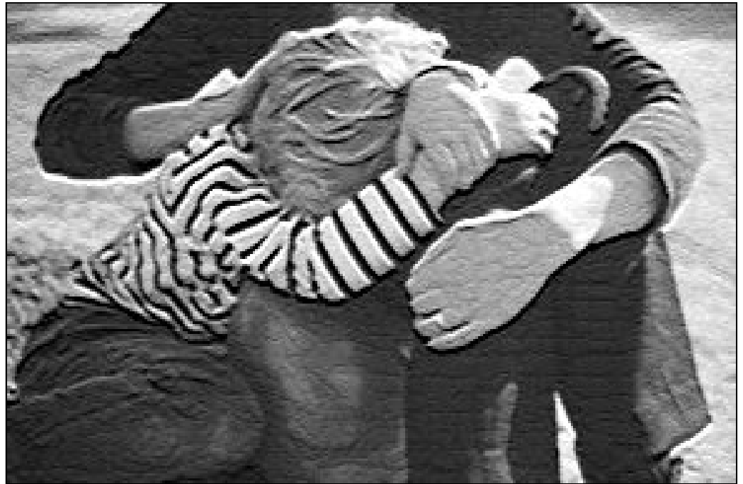
Tener los sentimientos de Jesús no significa que todo se vaya a arreglar

Jesús no era ni optimista, ni pesimista. Era un realista permanente. Así quiere Dios conducirte. La fe no es nunca optimista en el sentido humano de esta expresión; al contrario, debe ser realista enfocando valientemente el problema, el mal, el error; el sufrimiento, el fracaso... Con