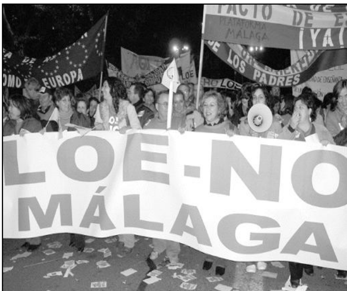
Manifestantes malagueños participaron en la marcha contra la LOE en Madrid

Lo que es claro es que los obispos buscan que se respete no su voz, sino el derecho de los padres recogido por la Constitución y por los acuerdos Iglesia-Estado. Los padres de alumnos, organizados en la Confederación Católica de Padres de Alumnos (CONCAPA), así como los profesores, han mani-