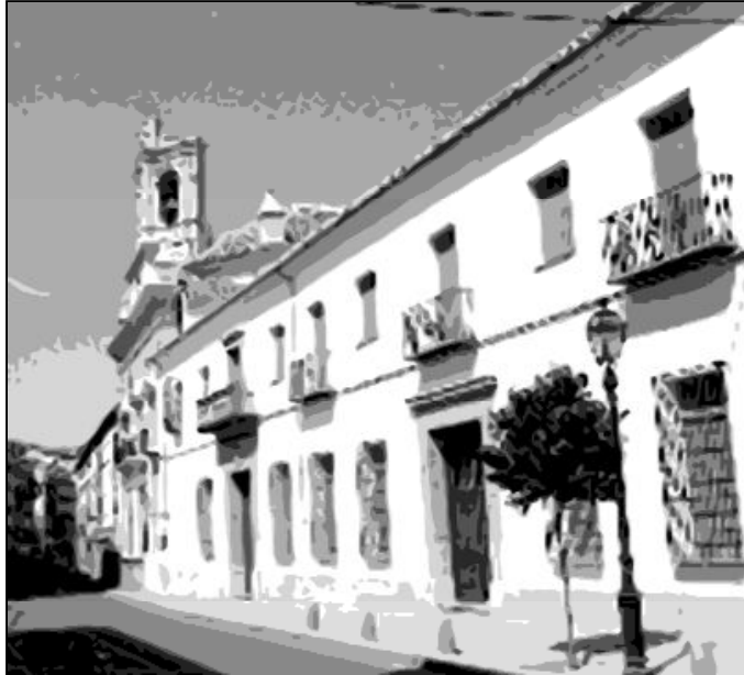
Convento Ntra. Sra. de la Victoria, en Antequera