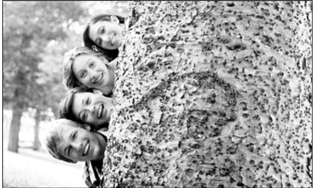
Los padres son los responsables de la educación de los hijos. Las demás instituciones son una ayuda

“Los comercios no deberían vender este género de vídeos, afirman