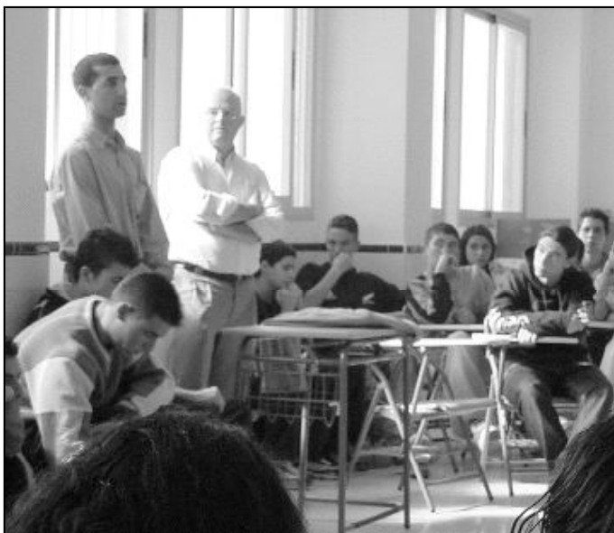
Charla de un interno de la prisión a los alumnos de un instituto

La Pastoral Penitenciaria, formada en Málaga por 80 voluntarios y 6 sacerdotes, tiene como principal objetivo cambiar las actitudes de los reclusos para reinser-