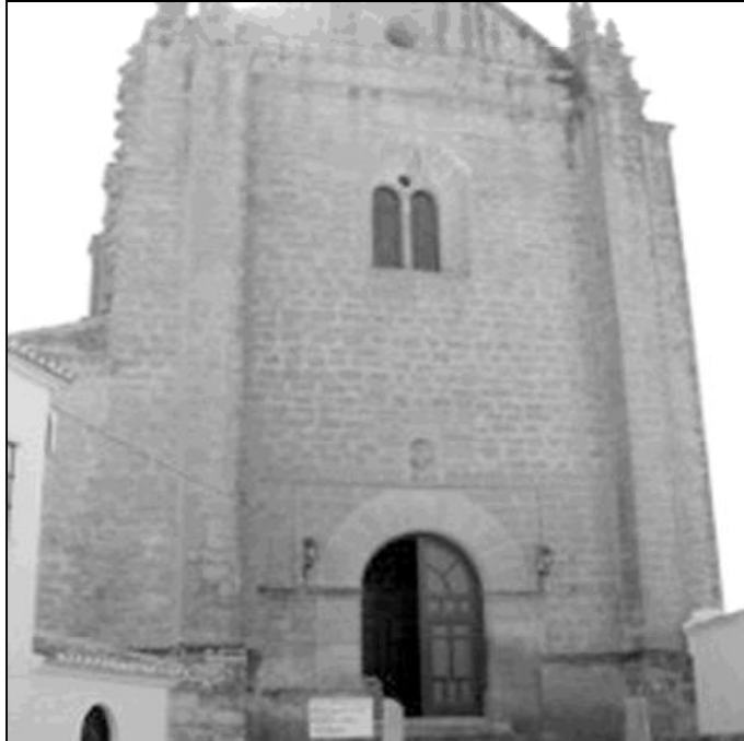
Templo parroquial Espíritu Santo, en Ronda

es de una gran valía y realiza una magnífica labor; pues en estos tiempos que corren, no es nada fácil evangelizar a los más jóvenes.