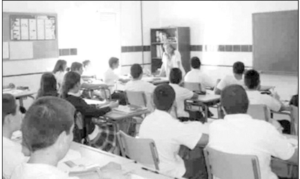
El 90 por ciento de los padres en Primaria y el 60 en Secundaria eligen la asignatura de Religión

Pero hay una tercera cualidad: como es una enseñanza confesional, esa persona tiene que responder al perfil de una persona cristiana que transmita con fidelidad el mensaje del Evangelio y que, de alguna manera, lo manifieste y lo viva. Somos muy duros. Este nivel hace que el profesor de Religión goce en los centros de una consideración y respeto por