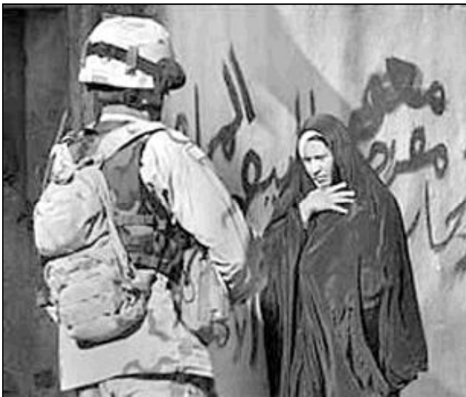
La guerra de Irak se ha cebado con la población civil

«El atacar de modo creciente y deliberado a los cristianos es un signo amenazante del derrumbe de la sociedad iraquí basada en el orden civil y respeto interreligioso, y es una grave violación de los derechos humanos y de la libertad religiosa», escribe el obispo