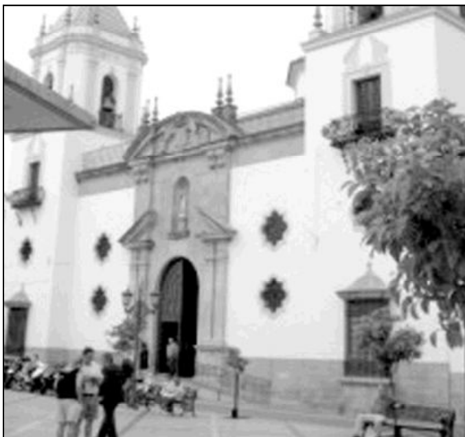
Fachada del templo parroquial de Ntra. Sra. del Socorro, en Ronda

Asimismo, tenemos que decir que en esta comunidad de fieles, que es muy generosa a todos los niveles, cuando se precisa de su colaboración, hay una gran asistencia a la Eucaristía, especial-