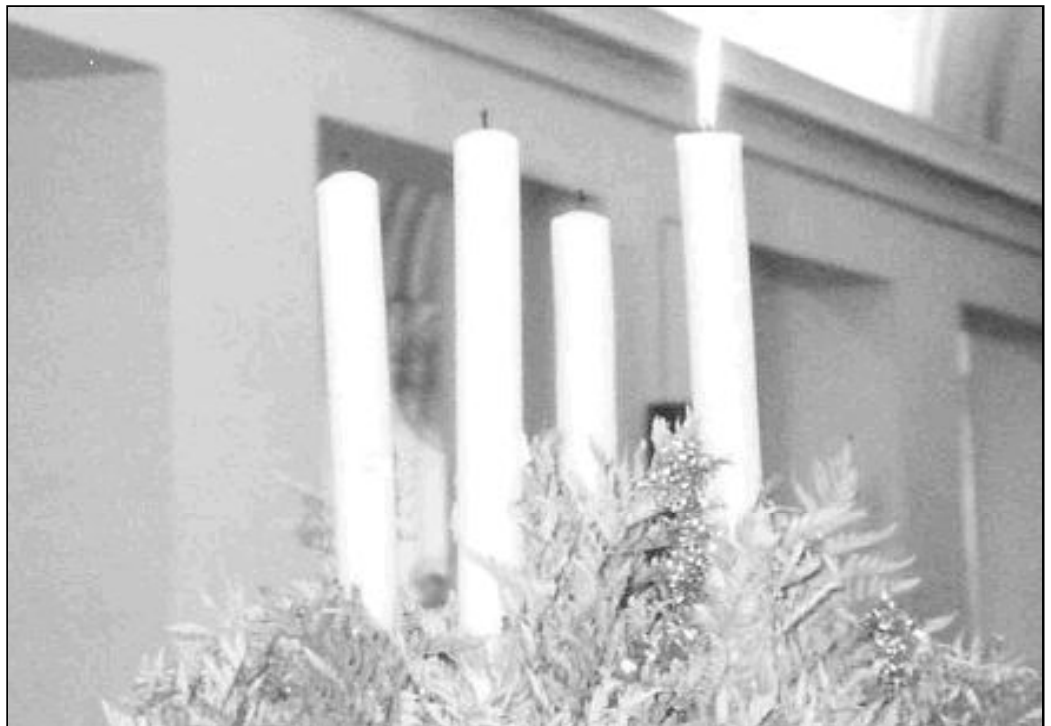
En muchas parroquias se coloca la Corona de Adviento durante estas cuatro semanas