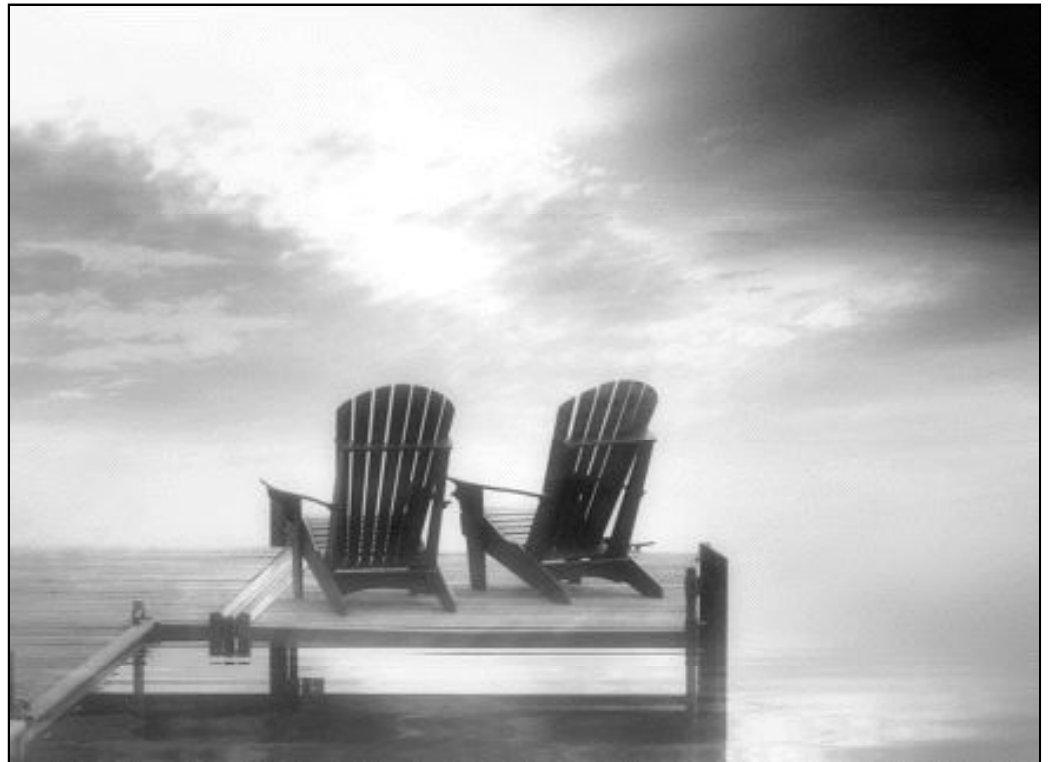
A menudo vamos por la vida estresados, nerviosos, sin ocuparnos de nosotros mismos

Si no lo haces así, terminas por agotarte completamente y