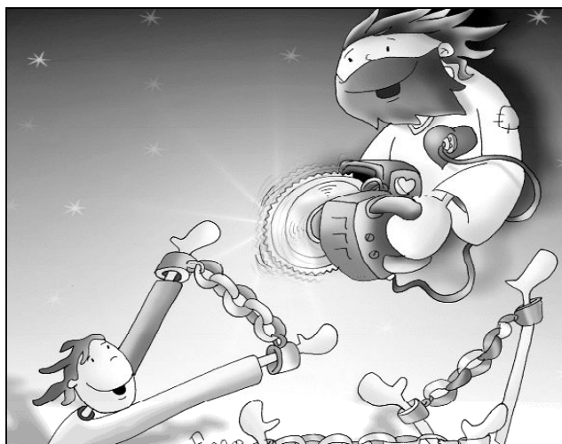
"Se acerca vuestra liberación"

Hay unas expresiones hoy en la Palabra de Dios que nos redaman una esperanza activa: alzad la cabeza, tened cuidado, estad siempre despiertos, pedid fuerza, manteneos en pie. Son actitudes propias de quienes esperan un nuevo Adviento: una vida vivida con sentido y perspectiva, con grandes deseos, mirando más allá, deseando el cielo nuevo y la tierra nueva, la transformación de nuestro mundo y de nuestro corazón. No se trata de un vivir con la cabeza gacha, vencidos por el desánimo o por el desencanto, sino de una vida alimentada con la oración dirigida a nuestro liberador.