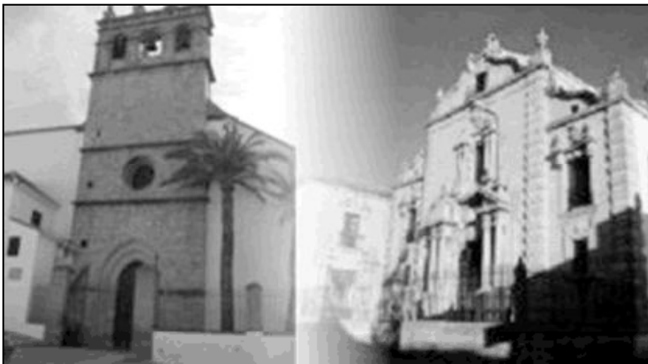
Fachadas de los dos templos parroquiales que se unen en una misma parroquia

En 1664, los trinitarios descalzos se trasladaron a un convento edificado de nueva planta sobre una antigua ermita y allí permanecerán hasta la desamortización. En 1835 se suprimió el convento, pero se mantuvo la iglesia, erigida en 1836 en parroquia matriz de Santa Cecilia, puesto que la primitiva parroquia quedaba ahora muy alejada del centro de la población. En 1960, se segregó la parroquia de Nuestro