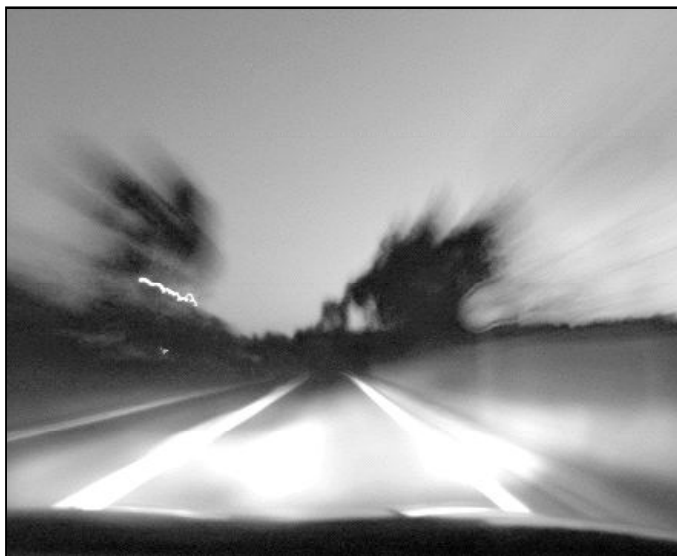
El alcohol y la velocidad son los mayores enemigos de la carretera

Según la OMS, se trata de un fenómeno en aumento, y si no se da