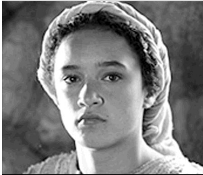
Actriz que representa a la Virgen María en la película "La Natividad", estrenada en los cines el pasado viernes, 1 de diciembre

La parroquia de la Amargura ha sido la elegida este año, en Málaga capital, para acoger la Vigilia de la Inmaculada, que tendrá lugar el próximo jueves, 7 de diciembre, a las 8,30 de la tarde. El lema escogido es "María, mujer de fe", y con él se quiere hacer hincapié en tres actitudes de nuestra Madre: la escucha, la acogida y la entrega... En una palabra, su FE.