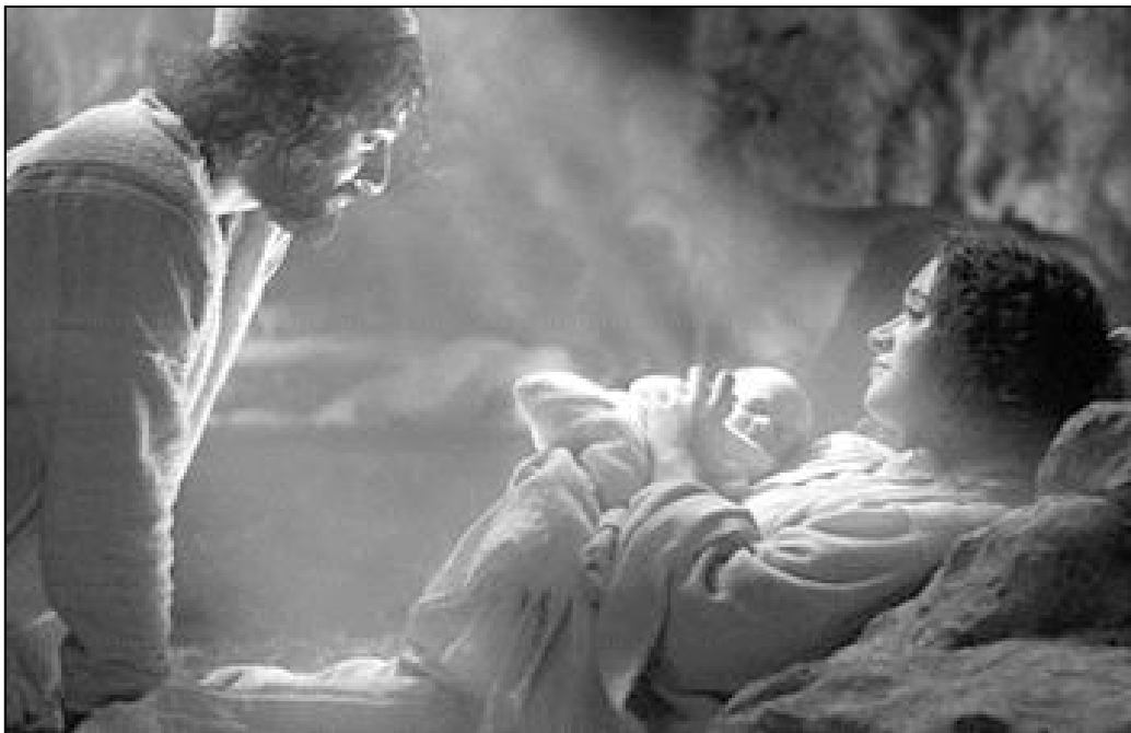
"La película, en salas de cine de toda España, colma todas las aspiraciones de un film sobre el nacimiento de Jesús"

Hardwicke, una directora artística de renombre, armoniza cuidadosamente lugares israelitas, marroquíes e italianos para evocar la majestad árida de Tierra