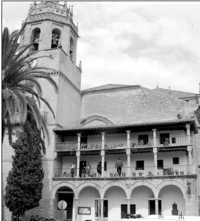
Fachada del templo parroquial de Santa María la Mayor, en Ronda

Las religiosas se encargan de la labor catequética y de la Caridad, Cáritas, junto con las ocho hermandades que pertenecen a la parroquia. Cuatro de las hermandades son de Gloria (Virgen de la Paz, de la Cabeza, de la Aurora y del Rocío) y otras cuatro de Pasión (Cristo de la Sangre, Veracruz, Ecce Homo y Ntro. Padre Jesús de la Salud). Además de sus tareas propias, cada una de ellas se encarga, un domingo de cada mes, de la preparación de la liturgia eucarística.