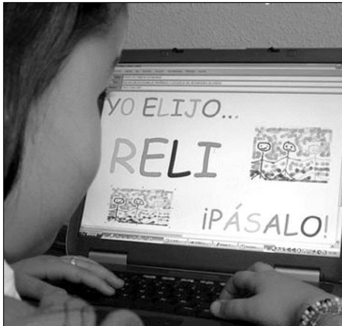
Detalle de una campaña de publicidad de la Diócesis de Asturias

La tercera, que el laicismo, bajo capa de defensa de derechos humanos, pretende reprimirlos, pues intenta impedir que esa