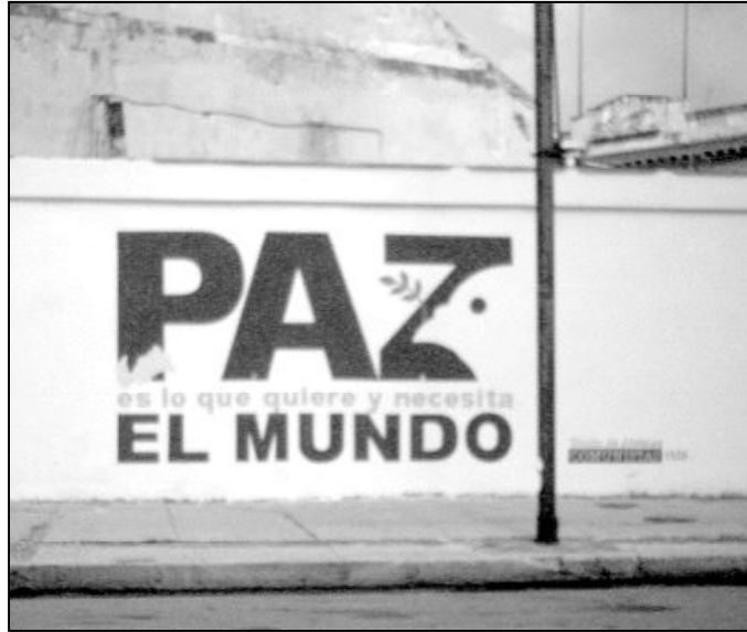
La Paz es un anhelo de la gente de buena voluntad

Por este motivo, indicó que Adviento es «el período más adecuado para convertirse en un tiempo vivido en comunión con todos aquellos, y gracias a Dios son muchos, que esperan en un mundo más justo y más fraterno». Afirmó que «este compromiso por la justicia puede unir a los hombres de cualquier nacionalidad y cultura, creyen-