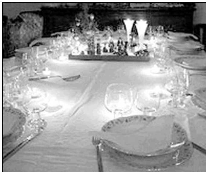
La familia se reúne en la mesa para celebrar el nacimiento del Señor

Está previsto que este sábado, 23 de diciembre, a las 8,30 de la tarde, tras la Eucaristía, se celebre en la parroquia de San Gabriel un concierto benéfico de la Coral "Mater Dei" en favor de la ONG Bomberos sin fronteras.