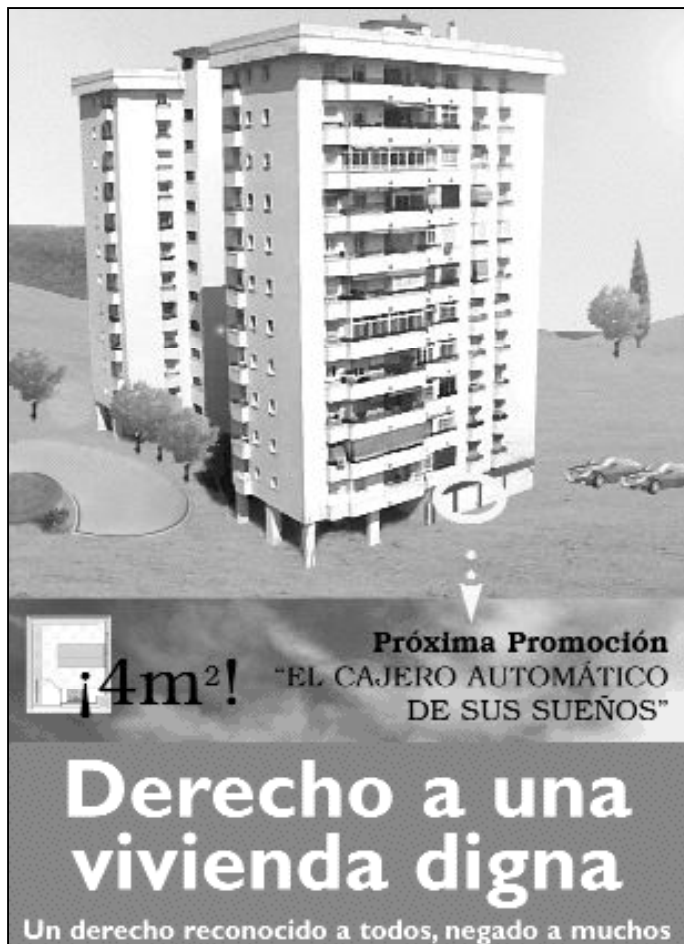
Fotomontaje que ironiza con el problema de la falta de vivienda

Ante el gran problema de la vivienda, Caritas de Málaga ofrece respuestas a las situaciones de mayor precariedad, a través de ayudas directas (para pagar el alquiler y otras necesidades) y con varios centros de acogida que atienden a personas en diferentes situaciones. Pero estos esfuerzos resultan insuficientes.