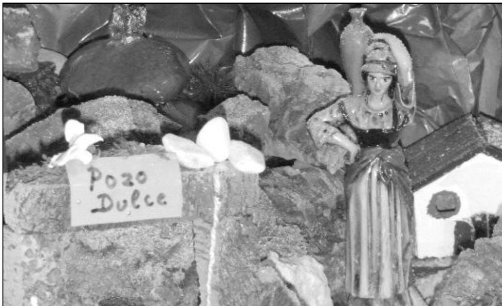
Detalle del nacimiento que realizan voluntarios y residentes del “Hogar Pozo Dulce”

El día a día en calle Pozos Dulces, nº 12, es un ejemplo. «El trabajador de planta, la educadora y las hermanas acompañan a los acogidos, desde que se levantan, en cualquiera de sus necesidades básicas. El trabajador de cocina prepara el desayuno, al que concurren todos, para coger fuerzas y emprender el día. Todos, directora, trabajadora social, educadora, Hermanas y