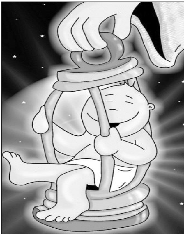
"Nace la Luz"

apóstol. Y María convierte su tiempo de espera del nacimiento del Hijo en un "tiempo de esperanza para toda la humanidad". En ella se cumplen las promesas de Dios: la Salvación del hombre, la venida definitiva del Reino es llevada en el vientre de una mujer sencilla. La esperanza no es espera pasiva y María traducirá en obras su tiempo de espera y esperanza. María se