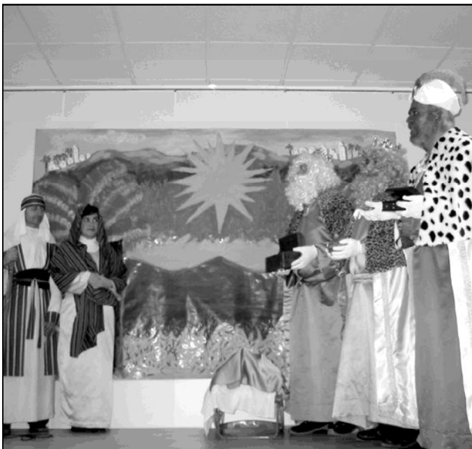
Representación de un Belén viviente en la fiesta de Navidad organizada por el Movimiento de Apostolado Familiar San Juan de Ávila

Para desarrollar sus tareas, se apoyan en las parroquias, que desempeñan un papel muy