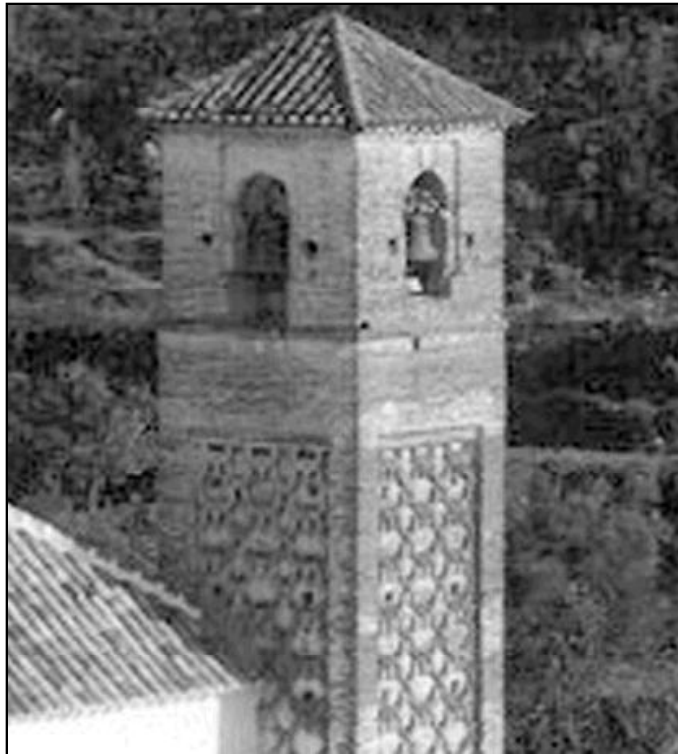
Torre mudéjar de la parroquia de Santa Ana, en Salares

El templo se construyó en el siglo XVI, aprovechando la torre mudéjar existente. Está compuesta por una sola nave. El alminar fue declarado Monumento Nacional el 16 de noviembre de 1979, como una de las piezas más bellas del arte almohade en nuestra península. Cuando se recicló para su uso cristiano, se le añadió otro cuerpo en el que se pudiese colocar las campanas.