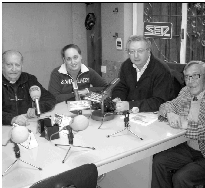
Equipo del programa "Palabra amiga", de Radio Coca -Cadena SER-

El programa se estructuró en apartados que lo hacían muy ameno y completo. Algunos de ellos son: noticias de la Iglesia de Ronda, de la Iglesia Diocesana y universal; lectura del Evangelio del domingo y síntesis de los de