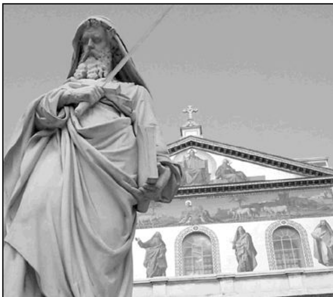
Fachada de la Basílica de San Pablo Extramuros, en Roma

La actual restauración ha permitido sacar a la luz algunos restos arqueológicos cubiertos desde que se alzó el actual edificio del siglo XIX. De