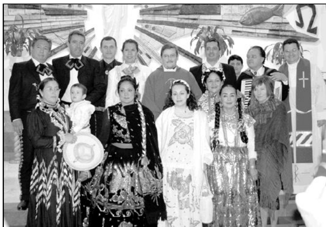
SEGUNDA MISA GUADALUPANA EN MIJAS

La parroquia San Manuel de Mijas celebró el domingo, 10 de diciembre, su segunda Misa Guadalupeana. La fiesta comenzó con la misa de 12 de mediodía, en la que presentaron a los niños ante la imagen de la Virgen. Después compartieron el almuerzo, para el que cada participante aportó un plato típico de su tierra. Con esta fiesta se anticiparon al día de la Virgen de Guadalupe, que se celebra el 12 de diciembre. En la foto vemos una representación de la comunidad mejicana de esta parroquia.