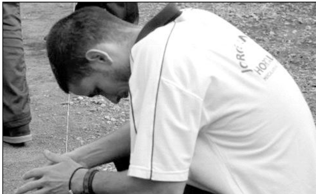
“Los fracasos son etapas necesarias en la vida”

1.- Asume tus emociones: Debes hacer frente a las emociones que corren el riesgo de destruirte mediante lamentos (“¿Si no hubiera conocido este fracaso?”), la frustración (“Pensaba que era una idea excelente, ¿por qué lo creía sólo yo?”), las jeremiadas (“Estaba herido y me quedé ahí, curando mis heridas”), la parálisis emocional (“No saldré nunca adelante.”). El único medio de controlar tus emociones, es asumirlas hasta que llegues a superarlas.