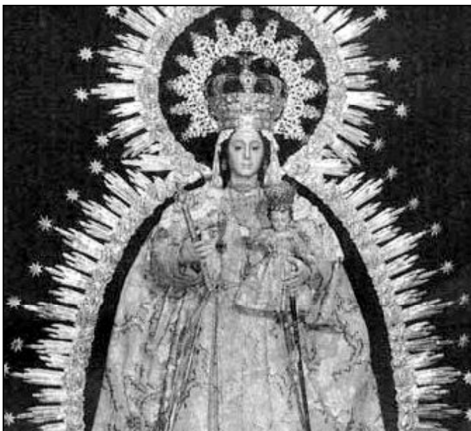
Nuestra Señora de la Paz, patrona de la ciudad de Ronda