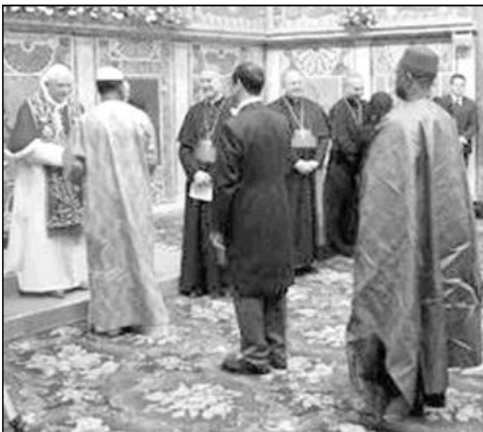
Benedicto XVI saluda a los embajadores acreditados ante el Vaticano

En tercer lugar, al presentar sus preocupaciones, el Papa