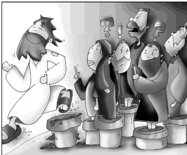
"Nadie es profeta en su tierra" salgamos de la tierra, saquemos los pies del tiesto

nocimiento de su verdadera identidad y su misión, de la sospecha y la duda, de la falta de confianza en Él: "¿No es éste el hijo de José?" Jesús no es sólo alguien bueno que pasó haciendo el bien: es el Hijo de Dios. Nuestra sociedad acepta de la Iglesia, de los cristianos, nuestro compromiso social, la caridad para con los más débiles, pero, en el momento en que manifestamos que nos mueve el amor de Cristo, el haberlo acogido como el Señor, como el Hijo de Dios que trae la liberación a los oprimidos, inmediatamente se cierran los oídos y, a veces, se cierran también los puños, más aún, consideran pretencioso que deseemos ofrecer un mensaje de salvación y liberación, no sólo de las injusticias económi-