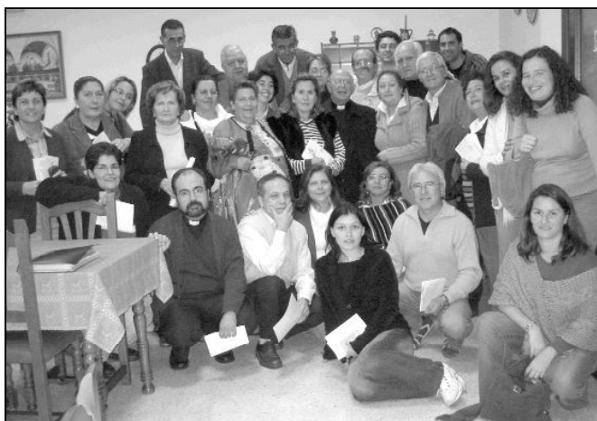
CURSILLOS DE CRISTIANDAD

En la foto superior podemos ver a los participantes en el último Cursillo de Cristiandad, el número 552, que se clausuró con la presencia del Sr. Obispo. El próximo cursillo que oferta este movimiento tendrá lugar del 1 al 4 de febrero, en Villa San Pedro. Para inscribirse en él, pueden llamar a alguno de los siguientes números de teléfono: 952 22 43 86, 952 40 16 54 ó 610 66 68 33. Según sus responsables, "el cursillo es una oportunidad para descubrir y abrir los ojos al Amor de Dios, es pararse y gozar de su presencia renovadora y vivificante".