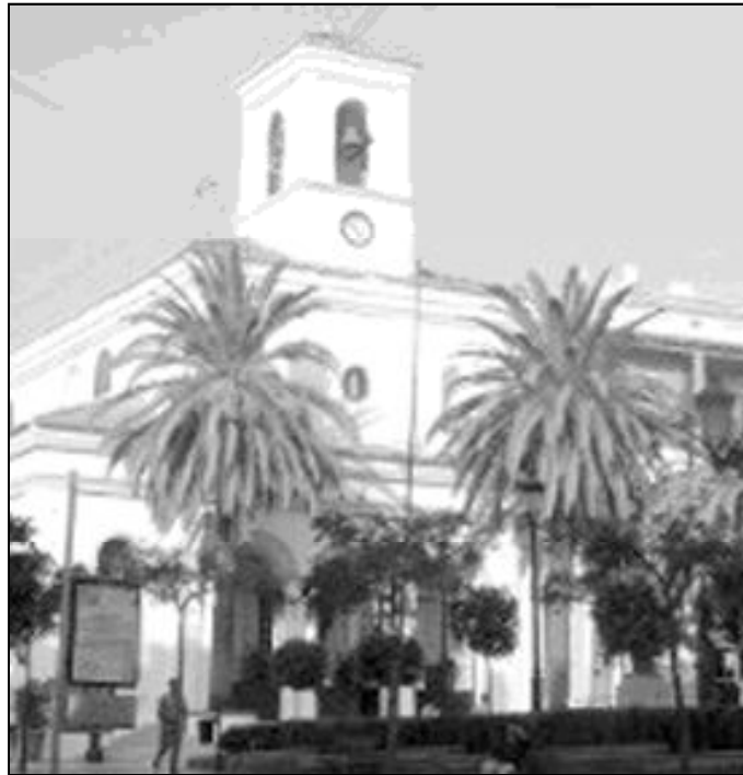
Fachada de la parroquia San Pedro de Alcántara

Gracias a Dios, la pastoral funciona de maravilla y los nueve salones que se construyeron anejos a la parroquia hace diez años, en lo que anteriormente era la