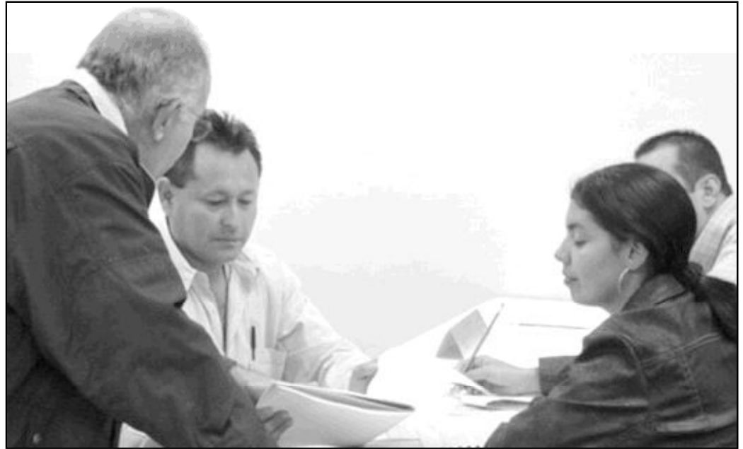
Muchas personas están descontentadas con el trabajo que realizan

Enfrentadas con tales cuestiones, muchas personas desarrollan malas actitudes. Se quejan, se inquietan o se dejan llevar por el descontento. Se preguntan si deberían callarse o decir en voz alta lo que piensan verdaderamente...quedarse en su puesto o