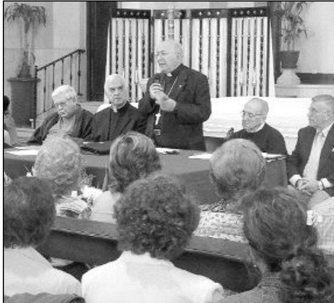
El Sr. Obispo dice que la visita pastoral es un deber apostólico muy grato

En la carta pastoral que ha servido de anuncio a esta visita, el Sr. Obispo explica que las visitas pastorales son «encuentros de familia para orar juntos, para escucharnos, para intercambiar puntos de vista y ofrecer el aliento necesario. En ellos, la palabra 'Iglesia' recobra su sentido original de 'asamblea' que se congrega en torno al Señor. Como hacían los primeros cristianos, nos reunimos también ahora para profundizar en la enseñanza de