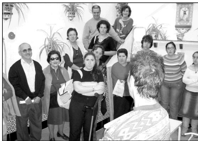
ENCUENTRO CON LOS EXCLUIDOS

En la foto superior podemos ver a los participantes en el último Cursillo de Cristiandad, el número 552, que se clausuró con la presencia del Sr. Obispo. El próximo cursillo que oferta este movimiento tendrá lugar del 1 al 4 de febrero, en Villa San Pedro. Para inscribirse en él, pueden llamar a alguno de los siguientes números de teléfono: 952 22 43 86, 952 40 16 54 ó 610 66 68 33. Según sus responsables, "el cursillo es una oportunidad para descubrir y abrir los ojos al Amor de Dios, es pararse y gozar de su presencia renovadora y vivificante".