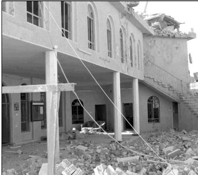
Las instalaciones civiles y religiosas han sido destruidas por los bombardeos

El barrio de Dora, en Bagdad, donde tienen su sede original los dos centros así como numerosas iglesias de las diferentes confesiones cristianas, se ha convertido en una de las zonas más peligrosas, en particular para los cristianos. Éstos se han visto obligados a