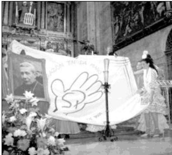
La Antorcha Spínola a su paso por las tierras andaluzas