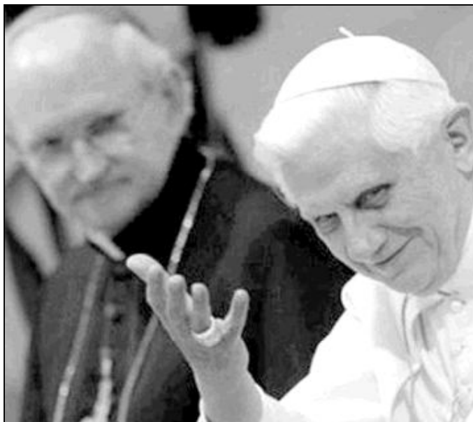
Benedicto XVI reconoce nuevas formas de vida en la Iglesia

Por eso, presentó sus dos reglas. En primer lugar, citó a Pablo de Tarso, cuando dice «no apaguéis los carismas». «Si el Señor nos da nuevos dones tenemos que dar gracias, aunque a veces sean incómodos. Y es algo bello el que, sin que se haya dado una iniciativa de la jerarquía, con una iniciativa desde abajo, como se dice, aunque también provenga desde lo alto, es decir, como don del Espíritu Santo, nazcan nuevas formas de vida en la Iglesia, como nacieron en todos los siglos». «En todos los siglos han nacido movimientos», aclaró. «Se integran en la vida de la Iglesia, aunque en ocasiones no falten sufrimientos y dificultades». «De este modo, también en nuestro siglo, el Señor, el