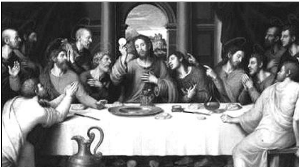
"Tomó el pan, dio gracias, lo partió y lo dio a sus discípulos"

En la última cena Jesús realiza unos gestos significativos, sencillos pero expresivos que van a manifestar para siempre su presencia sacramental "tomó el pan, dio gracias, lo partió y lo dio a sus discípulos". Así lo narran los evangelios.