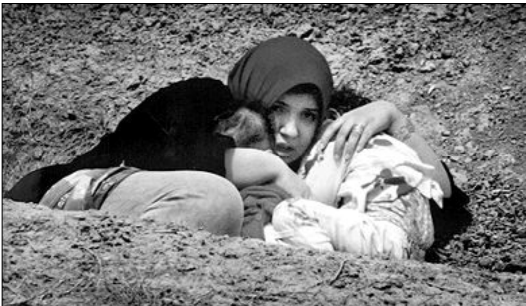
Los más pequeños son los que más sufren las consecuencias de la guerra

Más del 11% de los niños nace hoy con falta de peso en Irak, frente al 4% de 2003. Antes de marzo de 2003, Irak tenía ya una tasa de mortalidad infantil significativa debido a la malnutrición a causa de las sanciones internacionales impuestas al régimen dictatorial de Bagdad. Caritas Irak ha activado una serie de clínicas para el bienestar de los niños en el país. Actualmente proporciona alimentación suplementaria a 8.000 niños hasta los 8 años y a las que acaban de ser madres. Las clínicas de Caritas ayudan a los más vulnerables, y la crisis