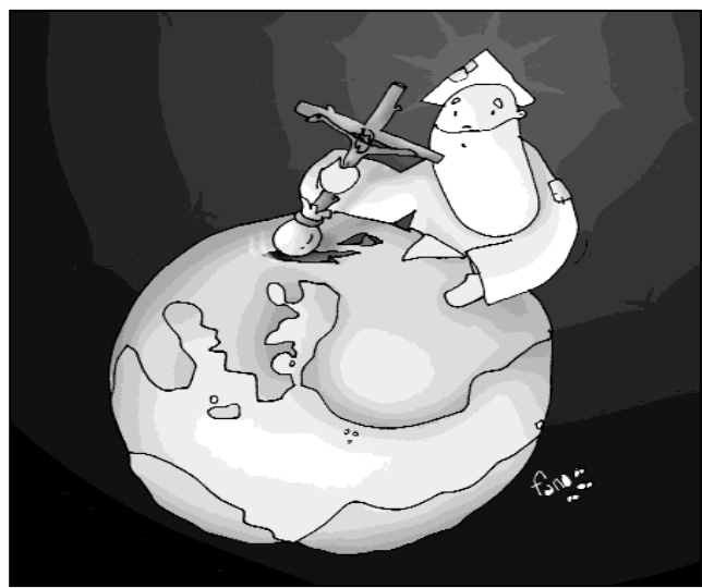
"Dios planta a su hijo en la tierra y como semilla muere..."

somos de los que callan cuando los otros gritan: ¡crucifícale! ¡crucifícale! ¿O quizá de los que hacen bulto, de los que siempre van detrás de los que mandan? ¿Dónde nos colocamos?