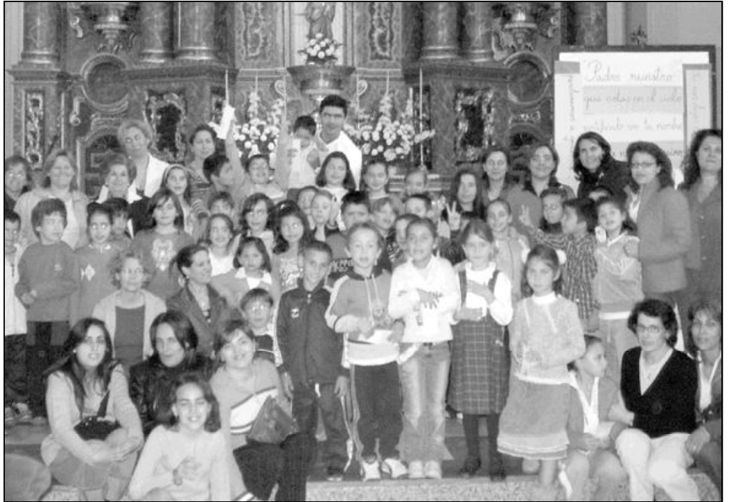
Miembros de la comunidad parroquial de Sta. Cecilia y Ntro. P. Jesús durante una celebración en tiempo pascual

Para el párroco, "hasta llegar ahí son muchos los que se implican. Los miembros del consejo,