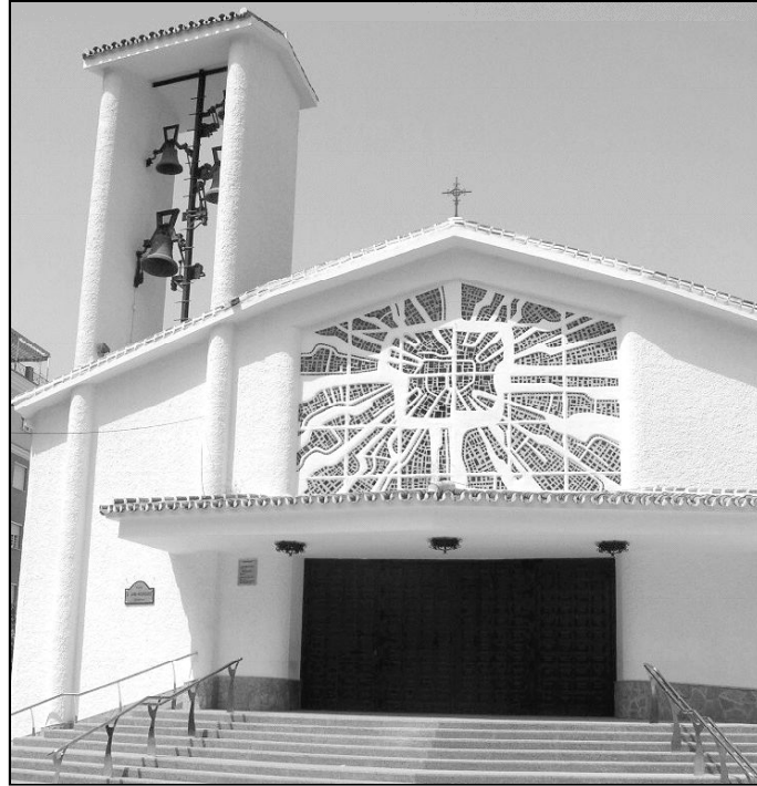
Fachada del templo parroquial de Torre del Mar

También cuentan con una imagen de la Virgen del Carmen, a la que el pueblo tiene gran devoción. Las fiestas en su honor se celebran el 16 de julio y se pro-