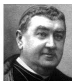
Manuel González (1877-1935)

Siendo cardenal de Sevilla, pidió limosna por las calles para socorrer a los hambrientos. Preocupado por la educación, promovió la Congregación de religiosas Esclavas del Divino Corazón. Obispo de Málaga entre 1886 y 1896. Beatificado en 1987.