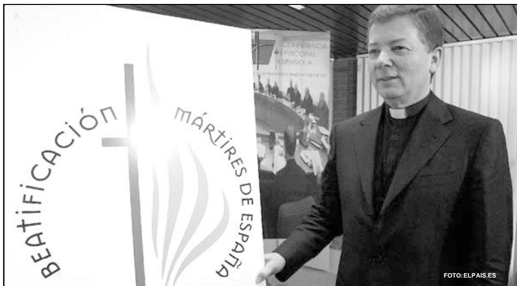
Presentación de la peregrinación a Roma con motivo de la beatificación de 500 mártires españoles

La Conferencia Episcopal Española va a organizar una peregrinación a Roma, el próximo otoño, para que los españoles asistamos a la beatificación de