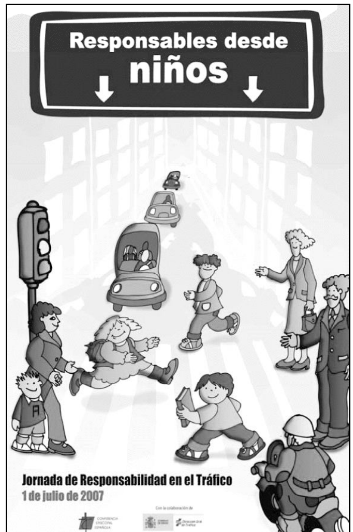
Cartel para la Jornada de Responsabilidad en el Tráfico 2007