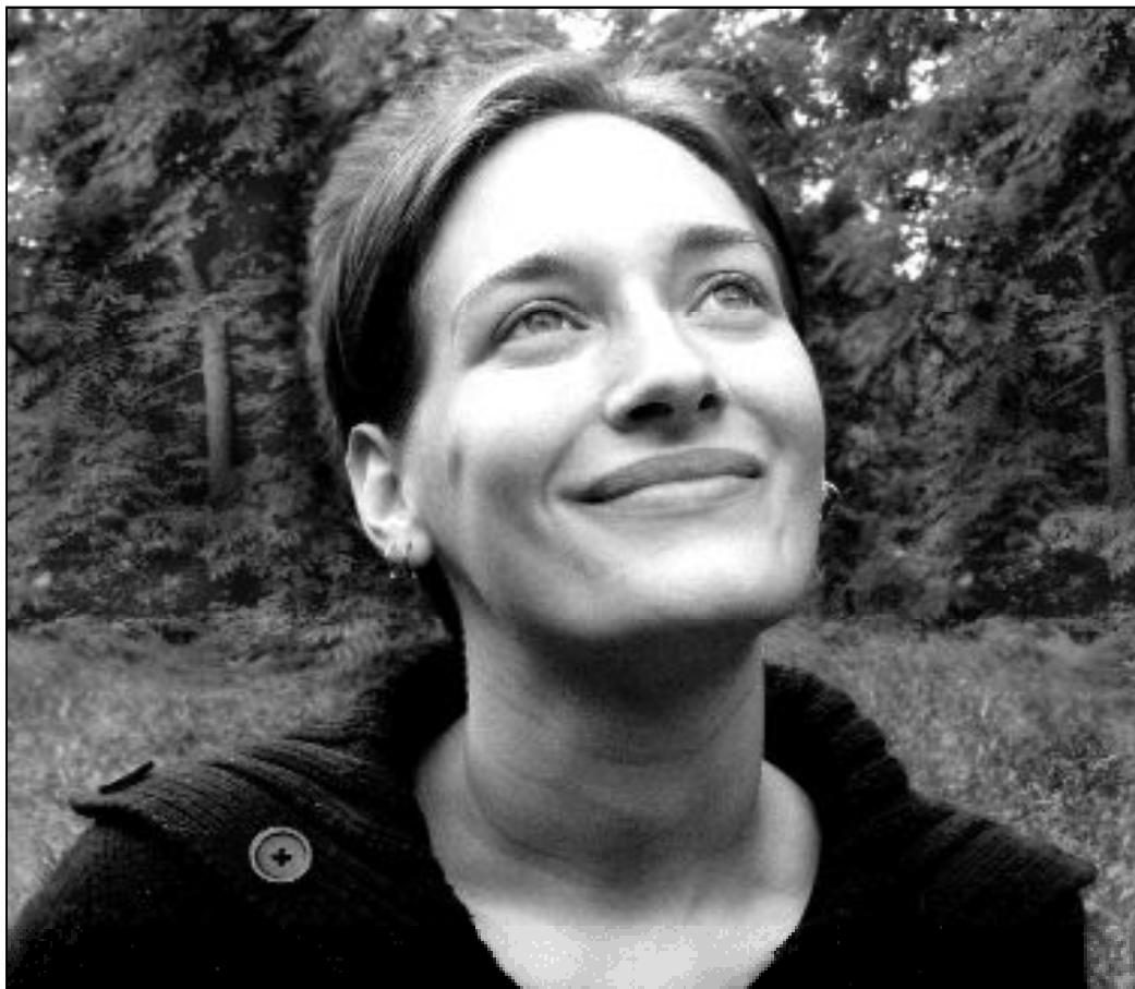
"El valor de tal mujer supera mucho el de las perlas"

Trabaja eficazmente, empleando los recursos y no malgastando nada. Es fuerte en espíritu, pero al mismo tiempo, es práctica y sabe utilizar con sabiduría