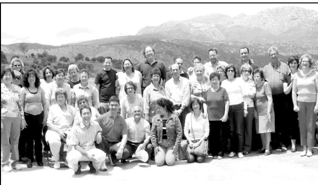
El pasado sábado, 16 de julio, tuvo lugar en la Estación de Cortes de la Frontera, Málaga, el Encuentro de final de curso de Caritas Ronda y la Serranía de Ronda. En la fotografía, algunos miembros de Caritas Ronda y Serranía.