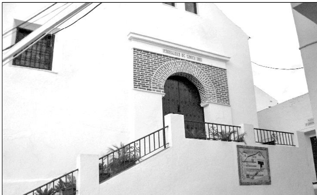
Fachada del templo parroquial Santa Ana, en Totalán

Además, en un edificio anexo se han dispuesto recientemente unas aulas para las catequesis, que también se utilizan para reuniones con vecinos, realización de expedientes matrimoniales, charlas prebautismales, etc.