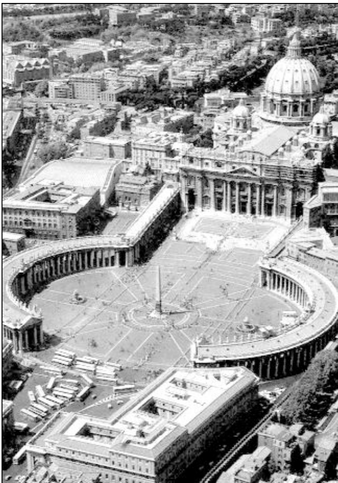
Ciudad del Vaticano

Benedicto XVI se suma al uso de las energías renovables