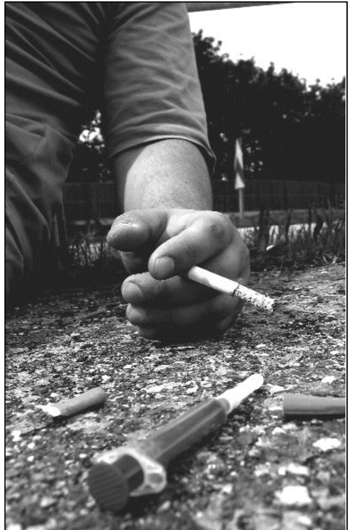
"La adicción es sintoma de un problema"