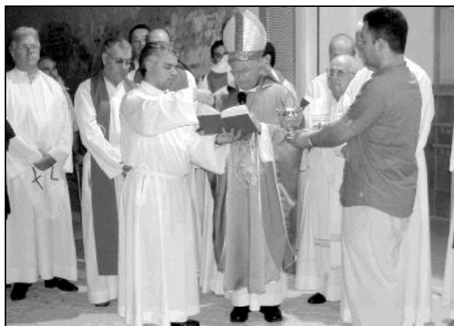
El lunes, 25 de junio, el Sr. Obispo bendijo la nueva sede en Málaga de la Asociación Misioneros de la Esperanza (MIES). Situada en la Calzada de la Trinidad, el edificio construido servirá para albergar la sede social de este movimiento, presente en España y en Latinoamérica.