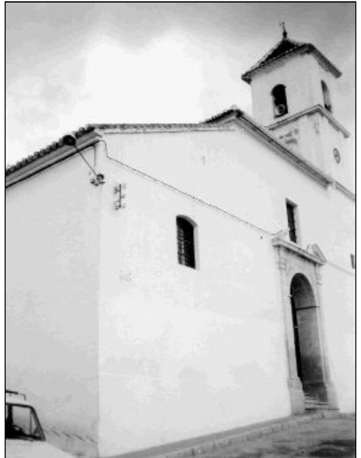
Fachada del templo parroquial de Valle de Abdalajís

La imagen del Cristo es trasladada a la parroquia, para posteriormente ser llevada hasta el Santuario de la Victoria, acompañada de unas 40 carrozas. Su actual párroco, Vicente Maiso, que sólo lleva unos meses en el pueblo, tuvo la oportunidad de disfrutar de la experiencia y quedó verdaderamente impresionado por el extraordinario ambiente fraternal de la convivencia.