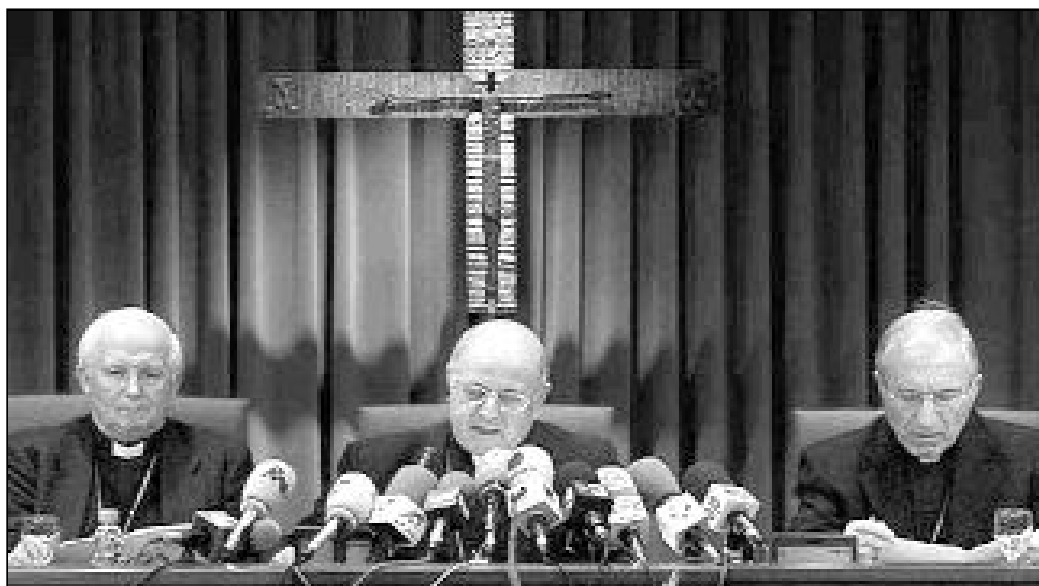
Miembros de la Conferencia Episcopal Española

La Conferencia Episcopal en la introducción de este documento afirma que en "el comienzo de este nuevo siglo la escuela católica está