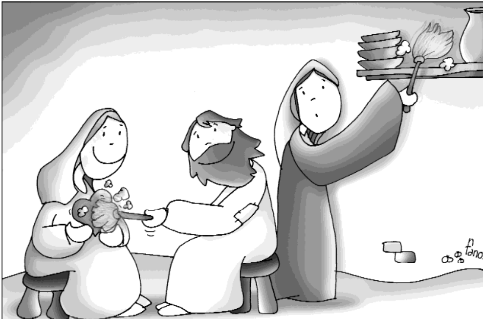
“Jesús, la mejor parte”