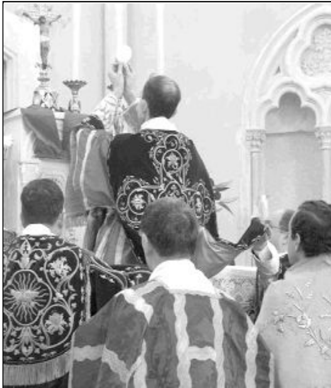
Uno de los rasgos de la misa en latín es la consagración de espaldas

Para empezar, el Papa deja muy claro que se trata de una forma extraordinaria de celebrar la Santa Misa. Por consiguiente, hay que entender que no puede estar a merced de caprichos o preferencias perso-