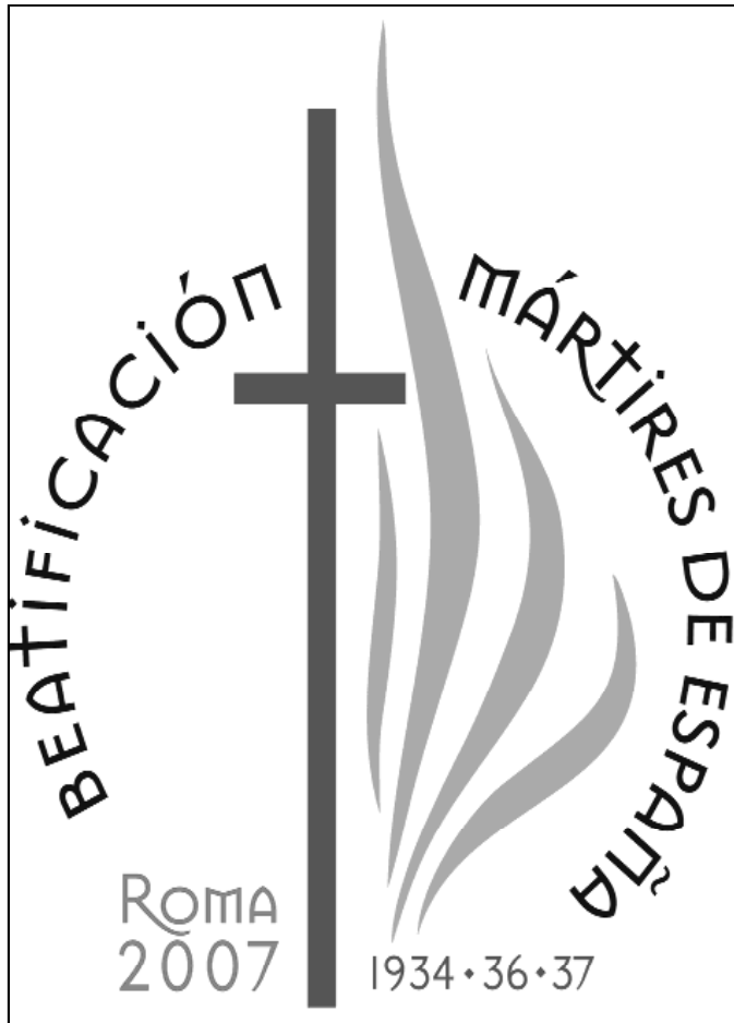
Logo de la beatificación

-¿Hablamos sólo de mártires de la Guerra Civil, o de mártires del siglo XX en general?