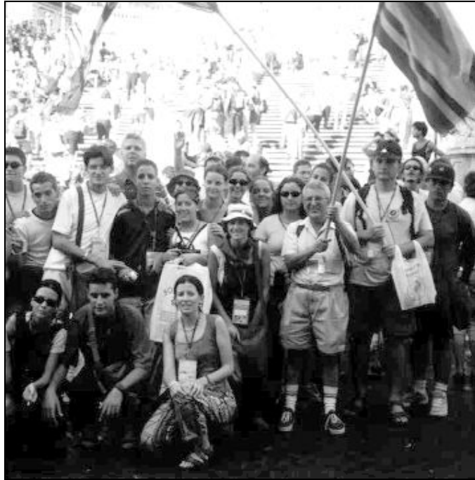
Jóvenes malagueños en un Encuentro Mundial de la Juventud

Es una iniciativa de la Iglesia Católica. La convocatoria la realiza el Papa, que invita a jóvenes de todas partes del mundo para que construyan puentes de amistad y esperanza entre los continentes, los pueblos y las culturas. Fue Benedicto XVI quien, durante la jornada de clausura en Colonia 2005, anunció que Sidney sería la anfitriona. Cada Jornada tiene un tema de reflexión en torno al cual giran las distintas actividades. El tema elegido para este encuentro es: "Recibiréis la fuerza del Espíritu Santo, que descenderá sobre vosotros, y seréis mis testigos" (Hch 1,8). El objetivo es que los jóvenes descubran que "el Espíritu no es una fuerza vaga,