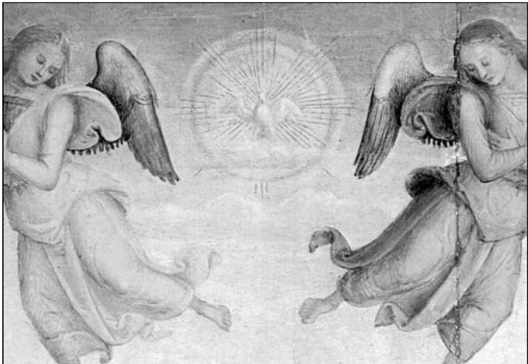
"Ángeles" (detalle). 1500-1503. Pintura sobre Madera

Dios envió su ángel para decir a Manoach y a su esposa que iban a tener un hijo destacado, Sansón. Cuando el ángel reapareció, quisieron darle un cabrito, pero el ángel dijo a Manoach que ofreciera un holocausto al Señor. Obedecieron y sacrificaron al Señor, y Éste les permitió que vieran un espectáculo prodigioso: el ángel subió al cielo en la llama del altar. Se llenaron de miedo y cayeron rostro en tierra.