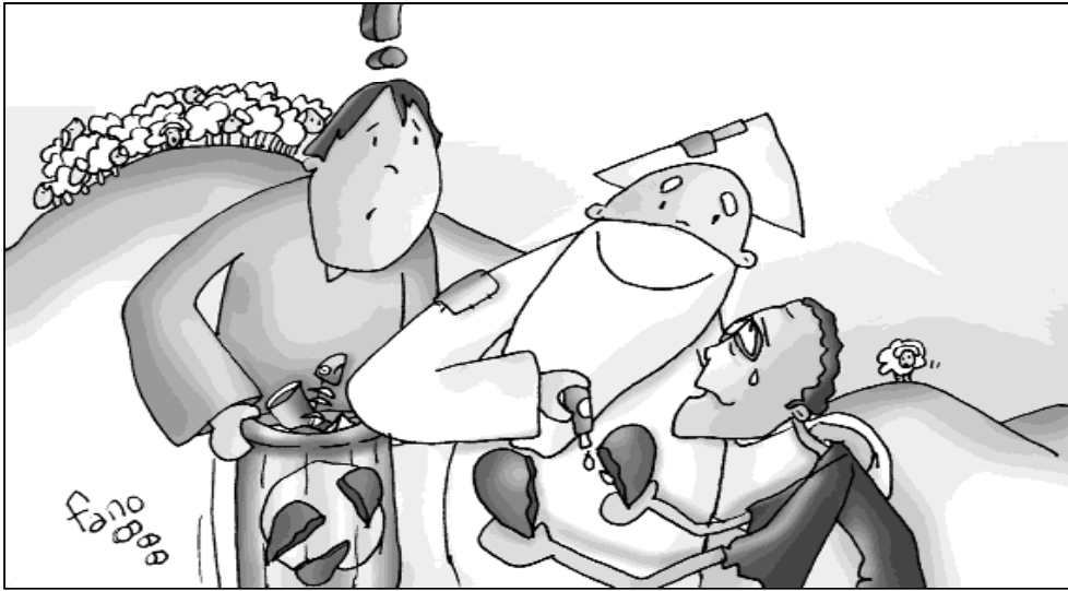
"El Padre acoge a la oveja perdida"