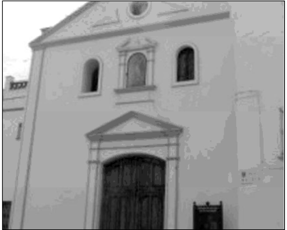
Fachada de la parroquia de Villanueva de Algaidas

Actualmente, las ruinas del convento son, además, muy valoradas por su interés histórico y artístico. De hecho, las dos visitas obligadas, para todo aquel que se anime a conocer el pueblo, son las citadas ruinas y la iglesia de Ntra. Sra. de la Consolación.