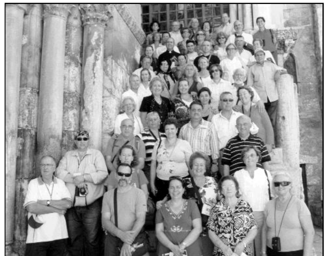
En la imagen superior, el grupo de malagueños que peregrinó a Tierra Santa del 25 de agosto al 1 de septiembre, en la Iglesia del Santo Sepulcro.

El 15 de noviembre, la Iglesia celebrará la fiesta de un nuevo beato de la diócesis de Málaga, el joven seminarista Juan Duarte. ¿Qué hizo y por qué lo han beatificado? Te lo cuenta Pedro Trujillo en este nuevo libro, al alcance de los niños de catequesis. En 131 páginas, con poco texto y 61 ilustraciones en color, se narra con duro realismo el testimonio valiente de este joven de Yunquera, que ante las torturas y las humillaciones no se avergonzó de su amigo Jesús y de pertenecer a la Iglesia Católica. Como afirma el autor: "este libro puede servir como fuerte estímulo alentador a los que encuentran dificultades para dar la cara por Cristo y comprometerse con su Iglesia en el tiempo actual".