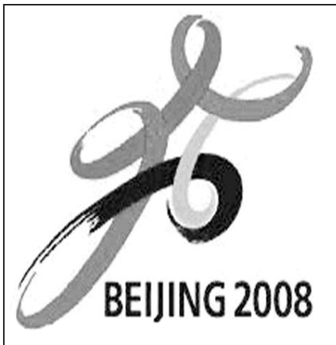
Logo de los Juegos Olímpicos 2008

Desde el nombramiento del Papa Benedicto XVI, China y el Vaticano mantienen contactos destinados a establecer lazos diplomáticos, para lo que Pekín exige que Roma rompa vínculos con la isla de Taiwán (a la que China considera parte de su territorio) y no interfiera en el nombramiento de obispos chinos. Según los organizadores de los Juegos, la Villa Olímpica contará con un centro de servicios religiosos con profesionales que proveerán servicios para satisfacer las necesidades espirituales de atletas de diferentes credos. Éstos y sus acompañan-