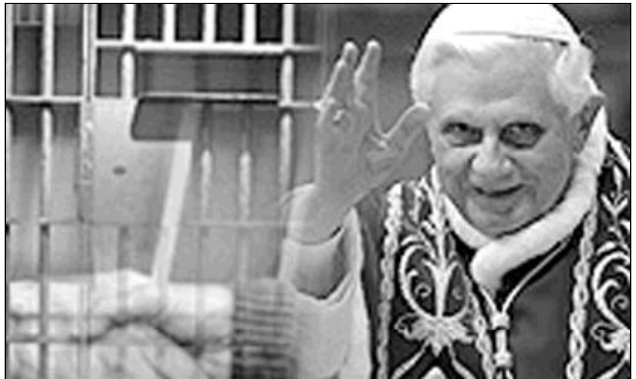
El Papa afirma que la tortura no puede aplicarse en ninguna circunstancia

El Papa aconseja a las autoridades que estén atentas, «evitando todos los medios de castigo o corrección que socaven o degraden la dignidad humana del detenido». «En este sentido, reitero que la prohibición de la tortura no puede ser infringida en ninguna circunstancia», recalca. «Los detenidos --constató-- pueden fácilmente dejarse aplastar por sentimientos de aislamiento, de vergüenza y rechazo que corren el riesgo de hacer añicos sus esperanzas y sus aspiraciones para el futuro». «En este contexto, los capellanes y sus colaboradores están llamados a ser heraldos de la compasión y del perdón infinitos de Dios», aseguró. Para el Papa, la cárcel, y todas las personas involucradas en ella, tienen «la tarea difícil de ayudar a los detenidos a redescubrir el sentido para sus vidas de manera que, con la gracia de Dios, puedan transformar su propia vida, reconciliarse con sus familias y amigos».