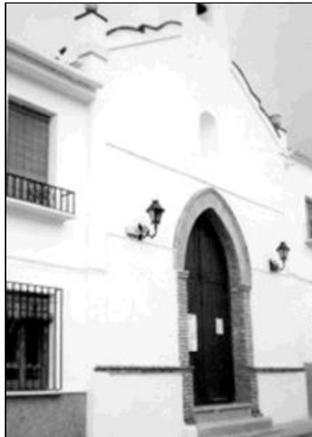
Fachada de la parroquia de la Inmaculada Concepción

Los diversos grupos de catequesis, de liturgia, coro parroquial, asambleas de barrios... funcionan durante todo el curso con entusiasmo, ilusión y generosidad. La participación en la catequesis infantil,