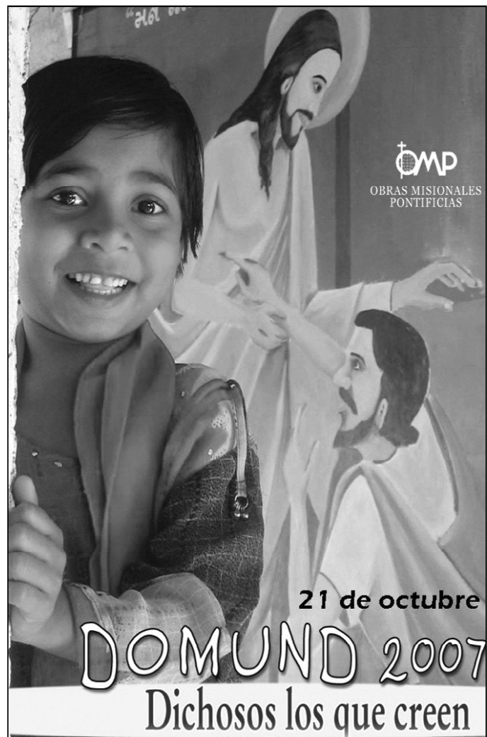
Cartel anunciador del día del DOMUND