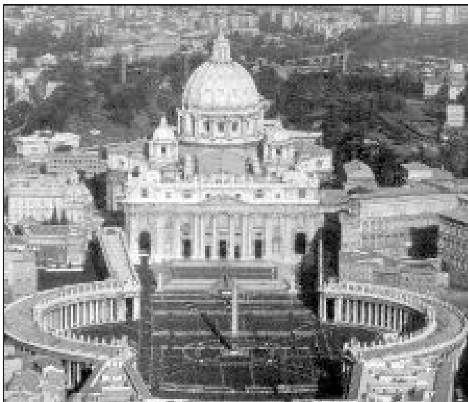
Panorámica de la Basílica de San Pedro

El Capítulo Vaticano fue constituido con monjes benedictinos en el año 1053 por el Papa León IX, para garantizar una vivencia