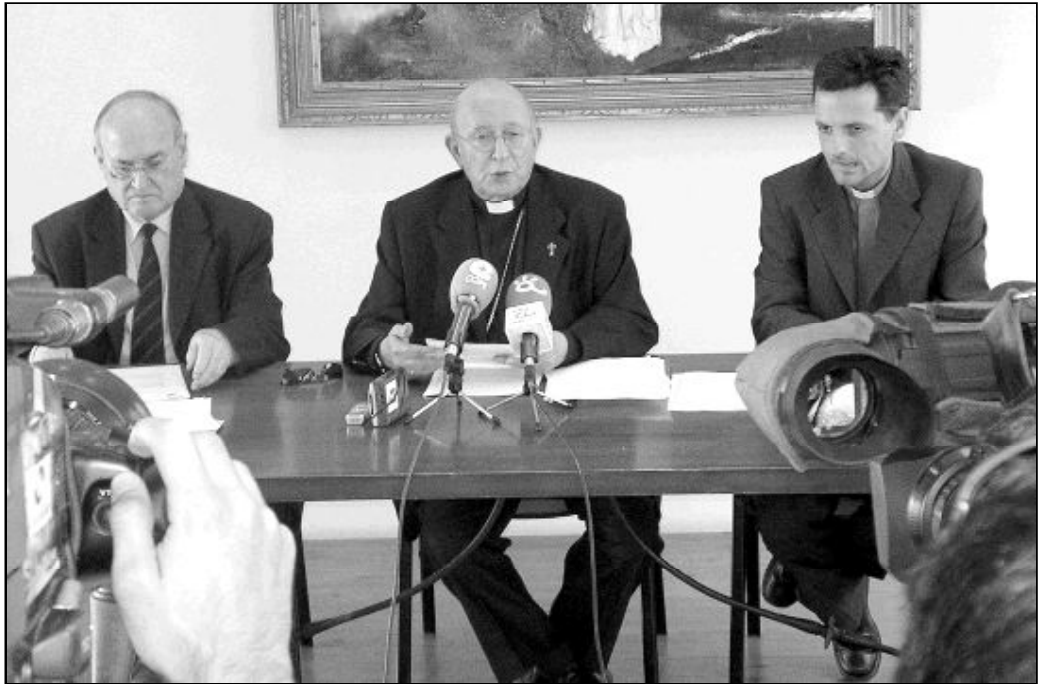
Rueda de prensa en la que se anunció la próxima beatificación de los mártires del siglo XX

Quieren dar gracias a Dios por ellos y por los restantes mártires españoles del siglo XX, que con éstos se acercan ya a mil beatificados. Hombres y mujeres de Dios, que fueron torturados y asesinados por confesar que Jesucristo es el Hijo de Dios y por predicar el Evangelio, con sus obras de misericordia y con su palabra.