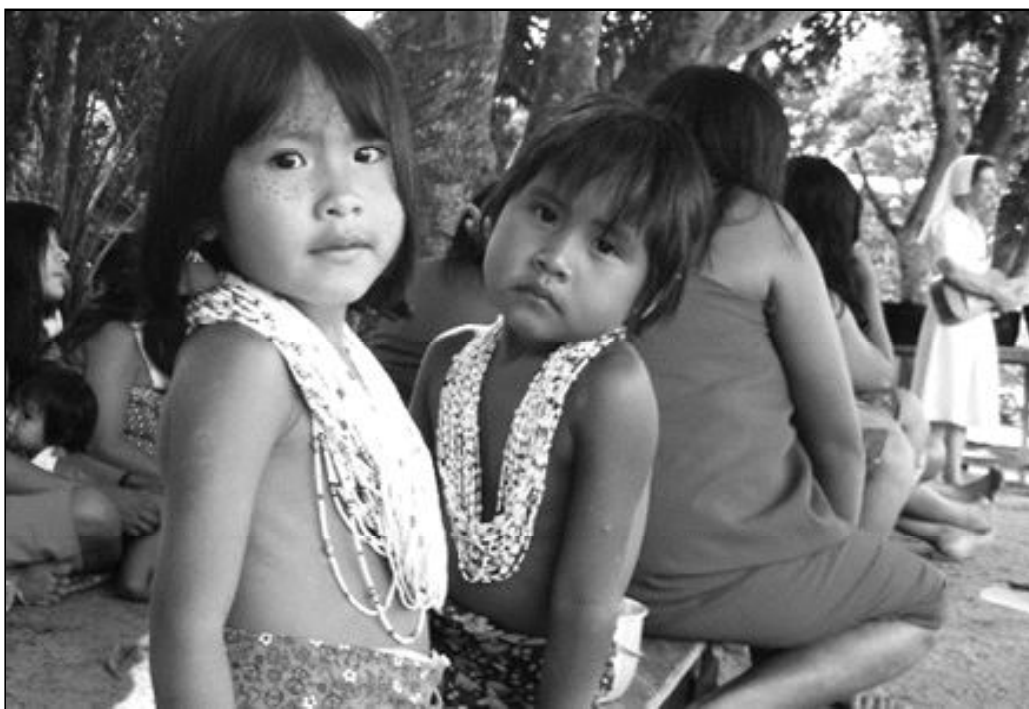
Los misioneros están dispuestos a presentar a Jesús a los demás en cualquier parte del mundo