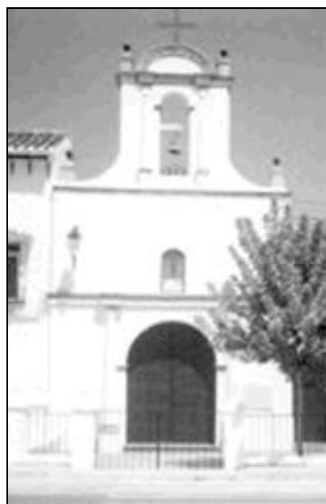
Fachadas de los templos parroquiales de Trapiche (izquierda) y de Viñuela (derecha)

Trapiche es uno de los barrios de Vélez Málaga, situado a tres kilómetros del pueblo. La iglesia parroquial, dedicada a San Isidro, fue construida en el s. XVI y es considerada como una de las más bellas de la zona. Además, en ella podemos encontrar obras de gran valor artístico como el Vía Crucis de Francisco Hernández o el San Isidro de Jurado Lorca,