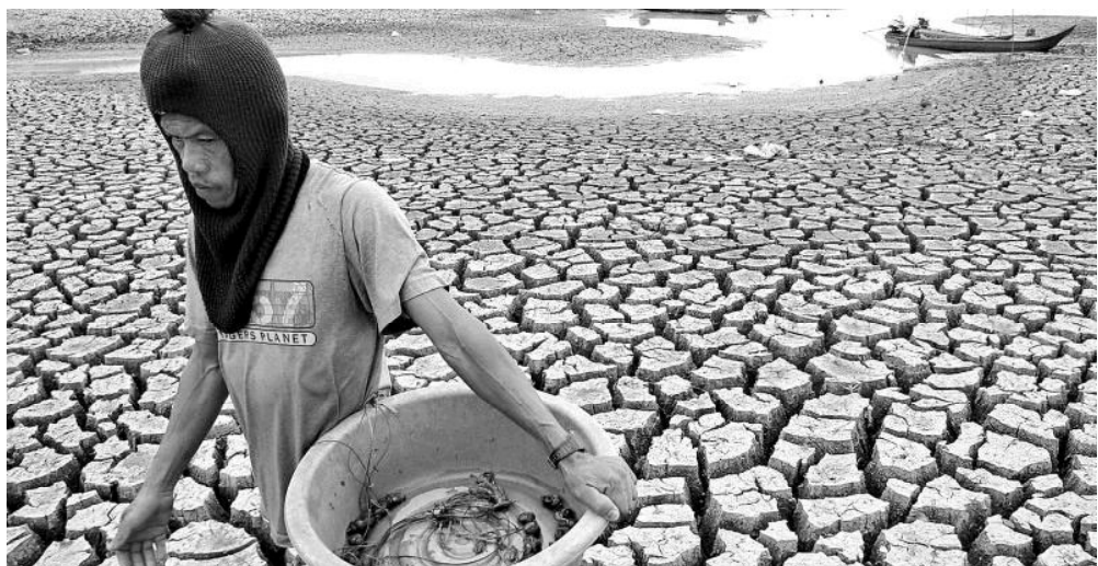
La sequía que se padece en muchas partes del planeta es otra consecuencia del cambio climático

La publicidad moderna, que se basa en la emulación sin límites, sabe muchísimo de ello. Tanto que un famoso publicista americano afirmó: "quien utilice debidamente los medios del lenguaje persuasivo puede vender libros sin letras". Tenía casi toda la razón. ¿Por qué ahora es peor? Pues porque ha mejorado el instrumental, el equipamiento técnico quiero decir, y con él se abre un abanico ilimitado de destrucción. Todos empezamos a sentir como auténticas las alertas de aquellos que los centros de poder denominaron