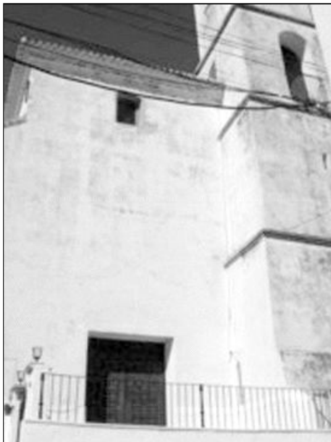
Fachada de la parroquia de Yunquera

En la festividad de la Virgen del Carmen, la imagen del templo es llevada en procesión hasta la ermita y la Virgen Chiquita de Porticate (también representación de la Virgen del