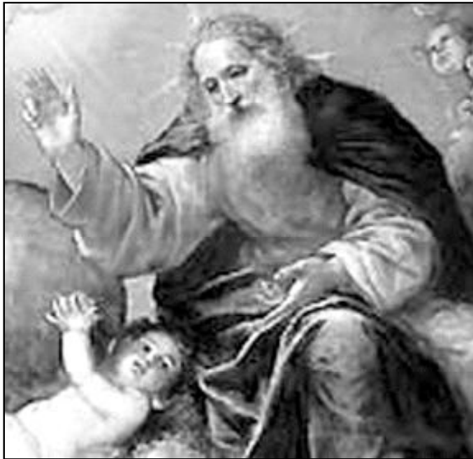
"Deja que Dios actúe en tu corazón"

Estos sentimientos se reservan a los seres humanos. El