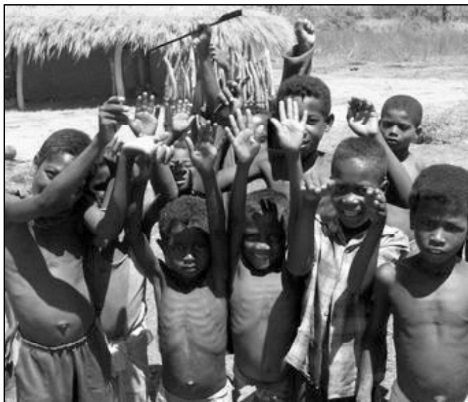
Ochocientos cincuenta y cuatro millones de personas padecen hambre

Ochocientos cincuenta y cuatro millones de personas padecen hambre crónica, y una de cada seis vive por debajo del umbral de pobreza, «cifras de la vergüenza» que «permanecen prácticamente inamovibles». Es la denuncia que, en un comunicado ha realizado Manos Unidas, con ocasión de la Jornada Mundial de la Alimentación y la Jornada Internacional de la Erradicación de la Pobreza, que se celebró el 16 de octubre. Además, «en los países en desarrollo, uno de cada cinco niños morirá antes de cumplir el primer año de vida». Estas jornadas se centran en el primero y, con toda probabilidad, más importante de los Objetivos de Desarrollo del Milenio: "Erradicar la pobreza extrema y el hambre", advierte Manos Unidas. «El hambre, junto con la pobreza, es la mayor vulneración de los derechos que, teóricamente, asisten a los seres humanos desde su nacimiento. Es un robo, consentido y