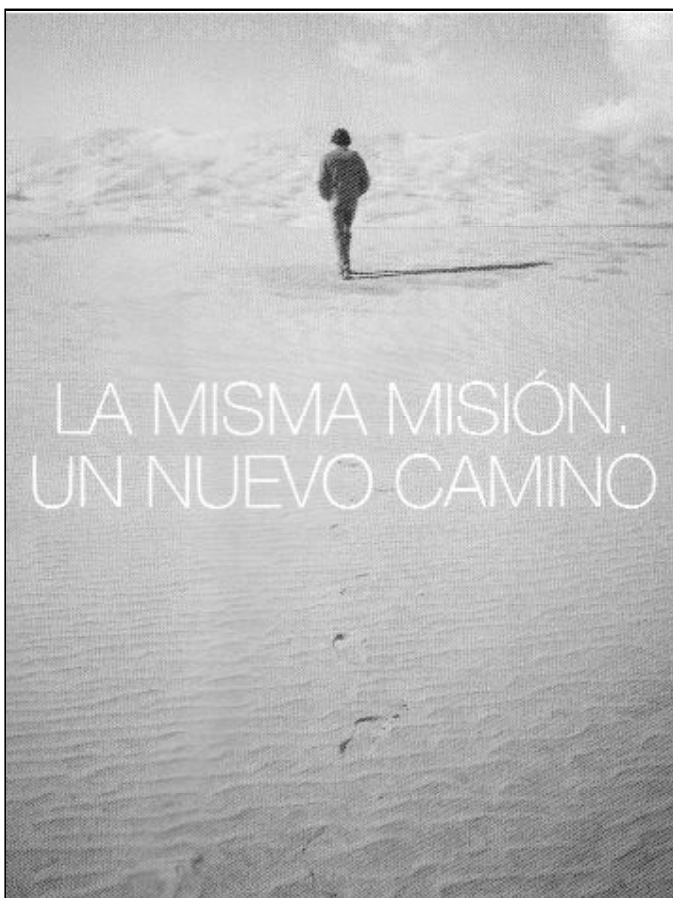
La Iglesia española comienza una nueva etapa

los ciudadanos demandan más información sobre las actividades que realiza la Iglesia en España. Por ello, los responsables de la campaña han elaborado una especie de “argumentario”. Se trata de dar a conocer la contribución de la Iglesia a la sociedad en múltiples campos, destacando los siguientes: “La Iglesia está presente en los acontecimientos más importantes de nuestra vida” (nacimiento, matrimonio, confirmación, enfermedad, muerte...); “La Iglesia aporta a la persona su