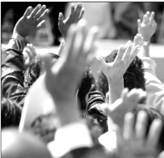
La verdadera ley tiene que defender los derechos fundamentales

Así las cosas, habría que aceptar que las convicciones no existen, lo predominante es una dogmatización de imposiciones gubernamentales que el hombre tiene que