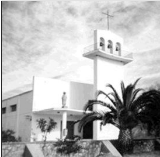
Fachada de la iglesia de Zalea

La estructura del templo, como la de casi todos los pueblos nuevos que se construyeron en aquella época, es de una nave rectangular, con dos alturas, presbiterio y asamblea, y un pequeño coro o tribuna por encima de la puerta principal. La decoración del presbiterio es sencilla: un altar de piedra de grandes dimensiones y una columna, de piedra también, en cuyo centro se encuentra situado el sagrario. En la parte más alta, nos encontramos con una talla de la titular de la parroquia, Ntra. Sra. de la