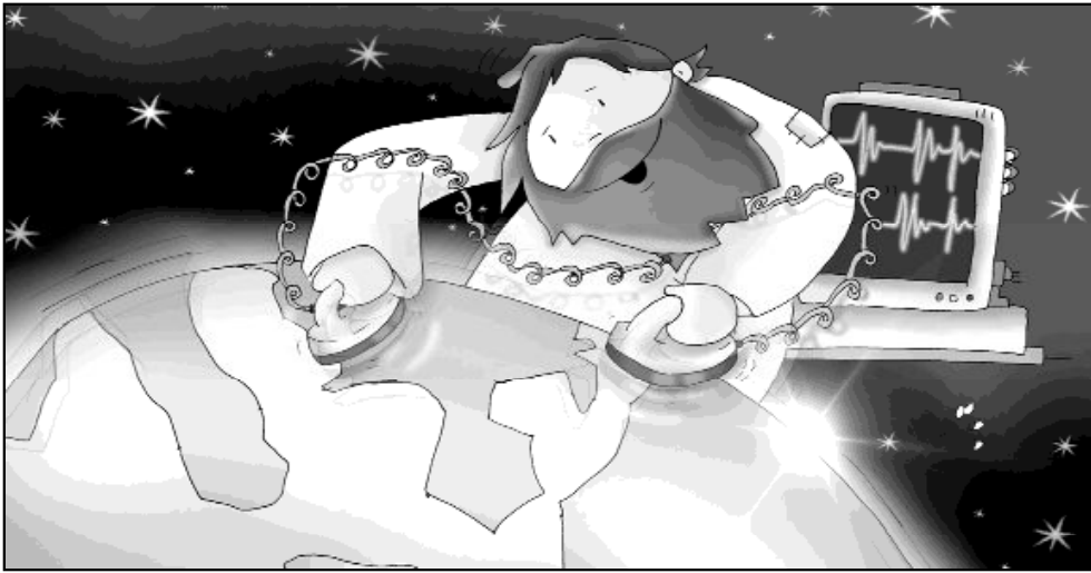
"Un Dios de vida que nos resucita"