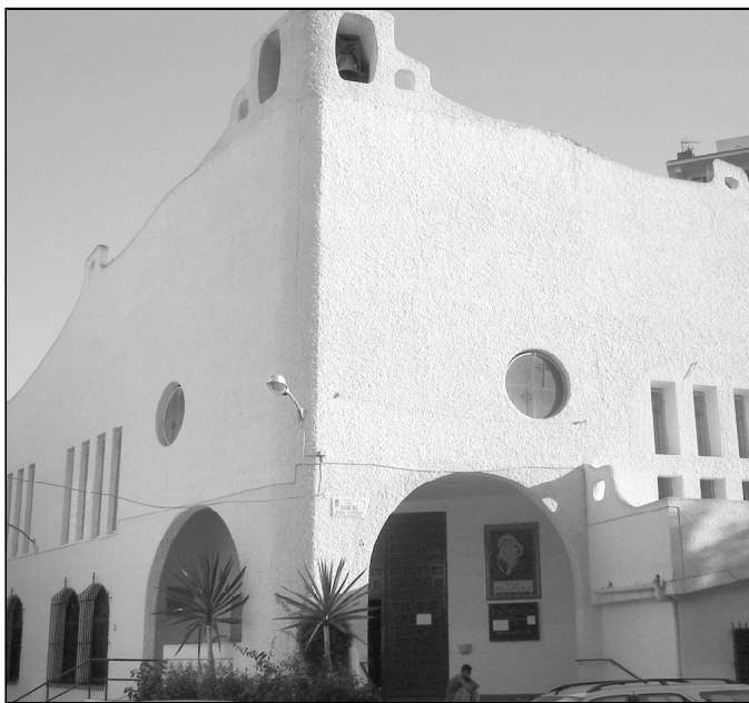
Fachada de la parroquia de Madre del Buen Consejo, en Torremolinos