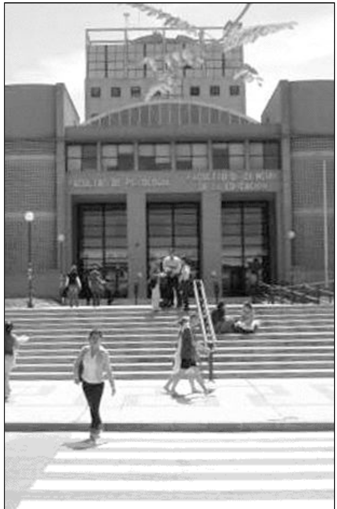
Miles de católicos dejan su fe en la puerta al entrar en la facultad