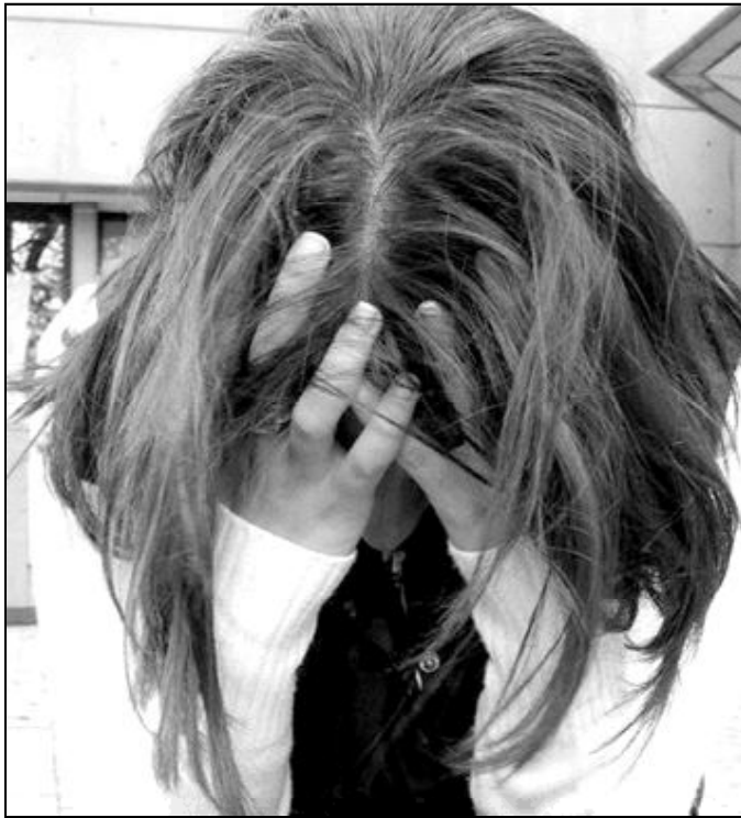
Ningún sufrimiento es vano

En nuestra naturaleza carnal y corrompida, heredada de Adán, algo tiene la tendencia a rebelarse contra Dios y su Palabra. Solamente el horno ardiente puede borrar tales impurezas. ¿Tienes más valor que el oro? Por supuesto que sí. ¿Te das cuenta que una simple esponja no puede bastar para quitar las impurezas y hacer brillar este