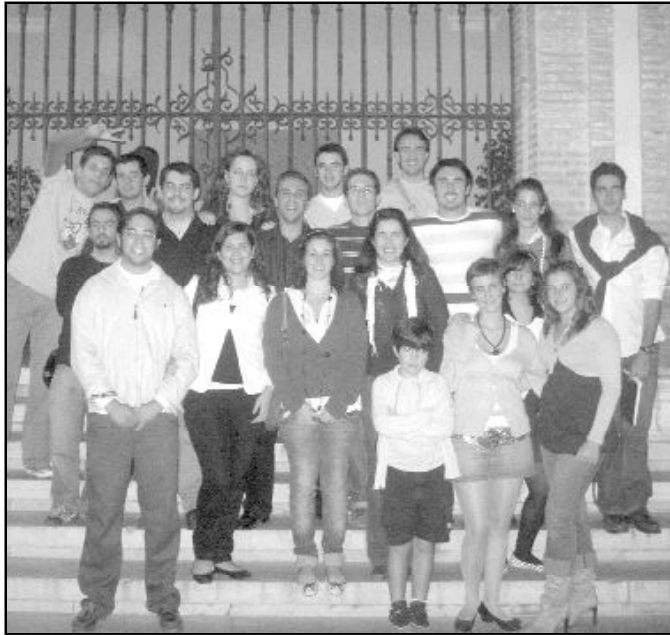
Grupo de jóvenes de las parroquias de la Victoria y San Lázaro

El próximo lunes, 19 de noviembre, a las 21 horas, en el salón de actos de la Expiración, tendrá lugar una conferencia titulada "El culto a los santos y la oración por los difuntos", a