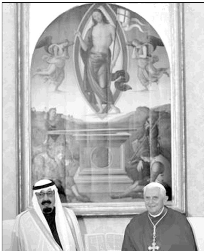
El rey Abdalá y el Papa Benedicto XVI

La Capilla Sixtina no es sólo la obra cumbre de Miguel Ángel sino también una escuela de teología, en la que los temas representados por él y por los pintores umbro-toscanos del siglo XV no fueron fruto de sus imaginaciones, sino que fueron asesorados por los teólogos pontificios. Así lo cree el jesuita Heinrich Pfeiffer, que lo ha plasmado en el libro 'La Capilla Sixtina. Iconografía de una obra maestra', editado por la