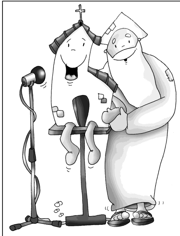
“Pondré mis palabras en vuestra boca”

(tiempo de testimonio y dificultad) con la esperanza del Señor Resucitado.