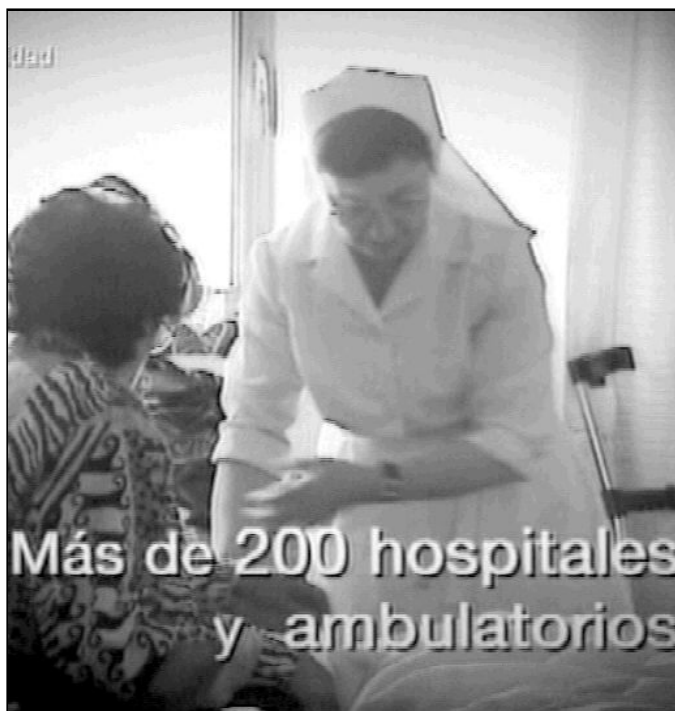
Fotograma del spot de la campaña publicitaria de la Iglesia Católica