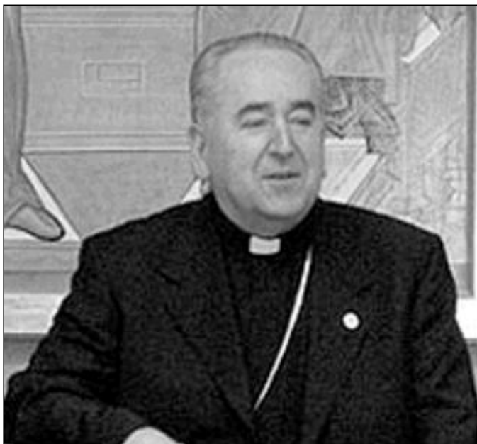
Stanislaw Rylko, presidente del Consejo Pontificio para los Laicos

fundamentales, vuestras cofradías se convertirán realmente en escuelas de formación de un laicado maduro y misionero, capaz de responder generosamente a los desafíos dramáticos que la Iglesia debe afrontar en nuestra época", añadió.