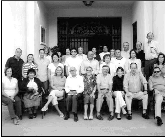
Participantes en el Cursillo de Cristiandad del mes de octubre

La delegación de Peregrinaciones, junto a la agencia de viajes Savitur, está organizando una peregrinación a Tierra Santa para los días de la semana blanca, del 23 de febrero al 1 de marzo. En esta ocasión, las 210 plazas del avión serán ocupadas