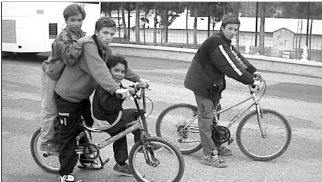
Los Hermanos Obreros de María dedican sus esfuerzos a cuidar a niños que viven circunstancias especiales

plicado de realizar. 35 de los 50 residentes son de religión musulmana. Entonces, ¿cómo transmitir la grandeza de Jesucristo a quienes no han tenido la oportunidad de conocerlo? Narra el director del centro que cada martes los chicos acuden a clase de Valores humanos . En ella, conversan sobre el respeto a los demás, la ayuda al prójimo y la honradez, entre otros temas. Pero el movimiento se demuestra andando. Y en este caso, la forma más eficaz de mostrarles a Dios sin utilizar palabras es con la transmisión de los valores que el Señor Jesucristo nos enseña: el valor de la honradez, el de la justicia, el de la fidelidad y el del amor, que engloba a todos los anteriores. Estos valores son los que, cada día, los Hermanos Obreros de María se esfuerzan en llevar a la práctica con acciones concretas y con el cariño que dan