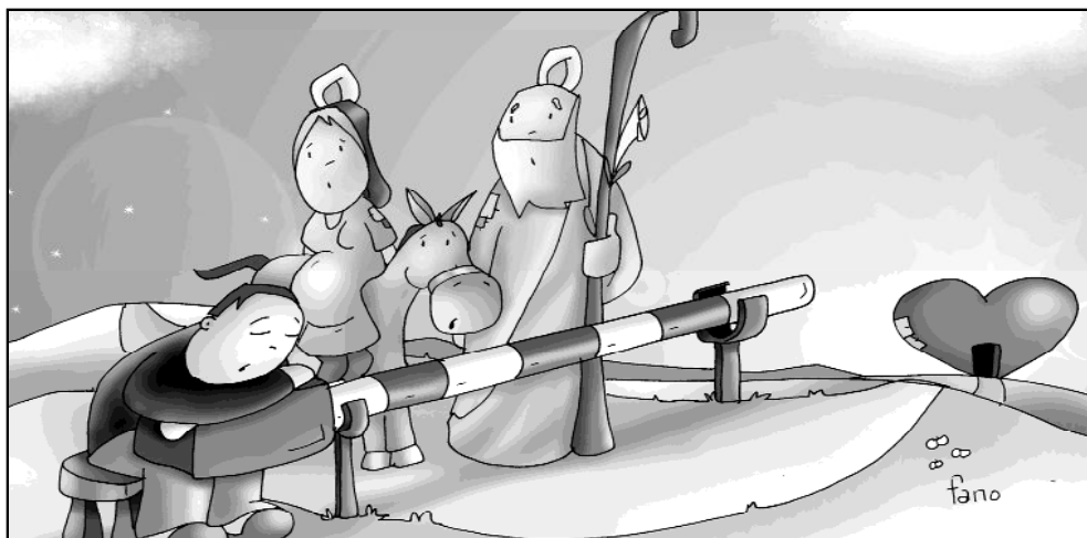
"Estad en vela"