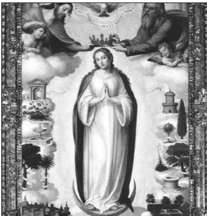
Primera pintura conocida de la Inmaculada Concepción

El secretariado de Pastoral de Juventud y Pastoral Vocacional, junto a la Vicaría de la Ciudad, convocan a todos los cristianos y, en especial, a los jóvenes de nuestra diócesis a participar en la Vigilia de la Inmaculada en el santuario Sta. M a de la Victoria y la Merced. Comenzará a las 20.30 horas y estará presidida por el Sr. Obispo.