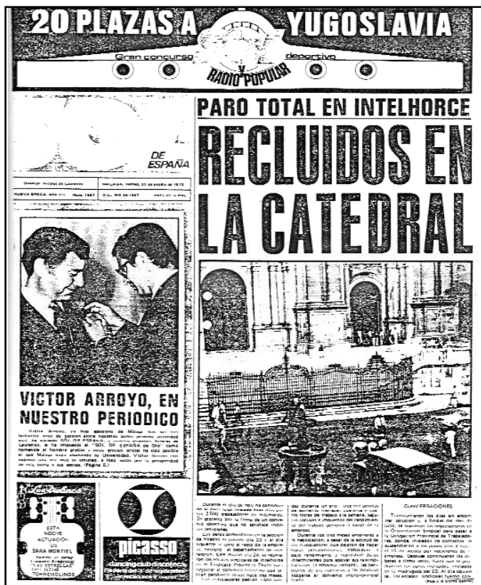
Portada de "El Sol" del 31 de agosto de 1973 en la que se hace referencia al encierro de trabajadores de Intelhorce en la Catedral