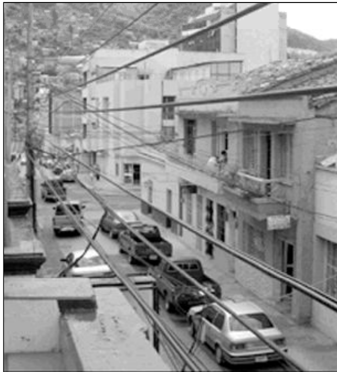
Vista de la ciudad de Tegucigalpa

Afirma que «el desarrollo en América Latina sigue siendo una asignatura pendiente. Además, se ha buscado ante todo y sobre todo el desarrollo económico exclusivista y excluyente. Y eso nos sigue obligando a emigrar. ¿Saben en España que sólo de Honduras salen cada hora nueve personas hacia EEUU?» Sin embargo, afirma que «EEUU ha blindado sus fronteras. Y no se da cuenta de