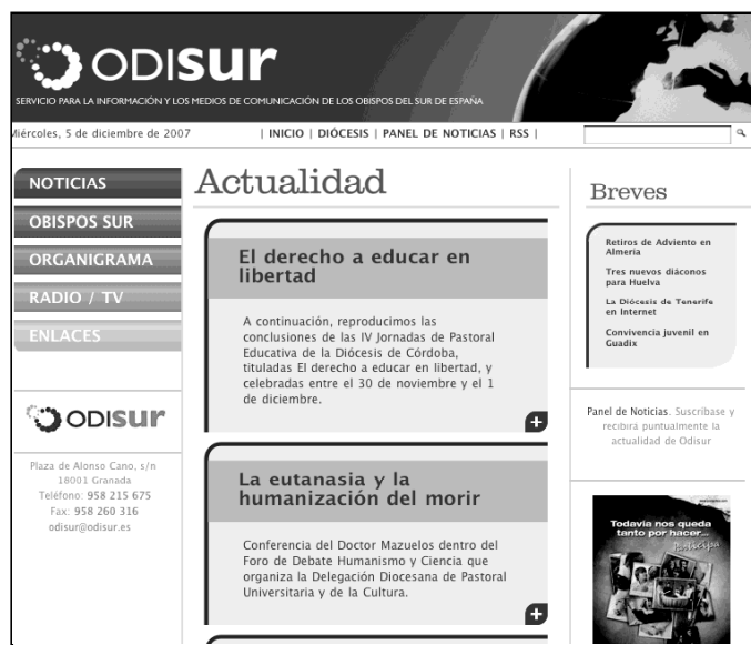
Página web de ODISUR