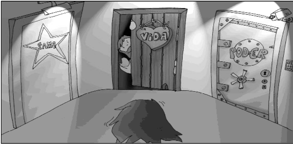
"Dichoso el que no se sienta defraudado por mí"