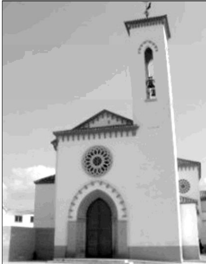
Fachada del templo parroquial principal de Cristo Rey y Nuestra Señora del Rosario

Cuando se fusionaron las parroquias primitivas, todas las actividades y movimientos se incorporaron a la nueva, dando