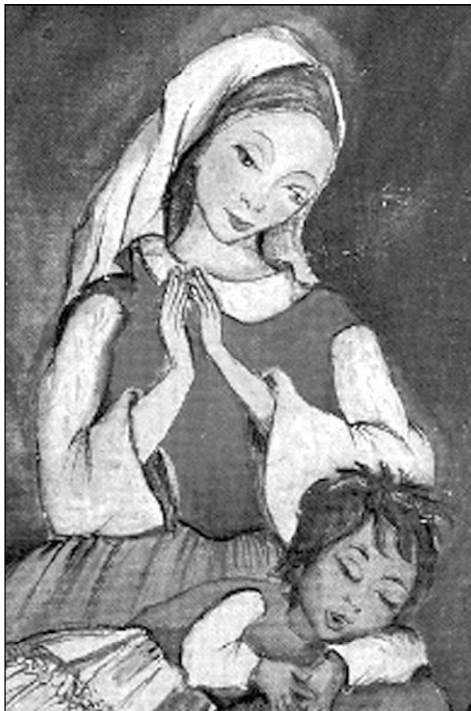
Imagen de la "Majari", como conocen los gitanos a la Virgen María

Las acciones y actividades no están exentas de dificultades y desalientos. Uno de los pilares es la paciencia y la gratuidad. No se