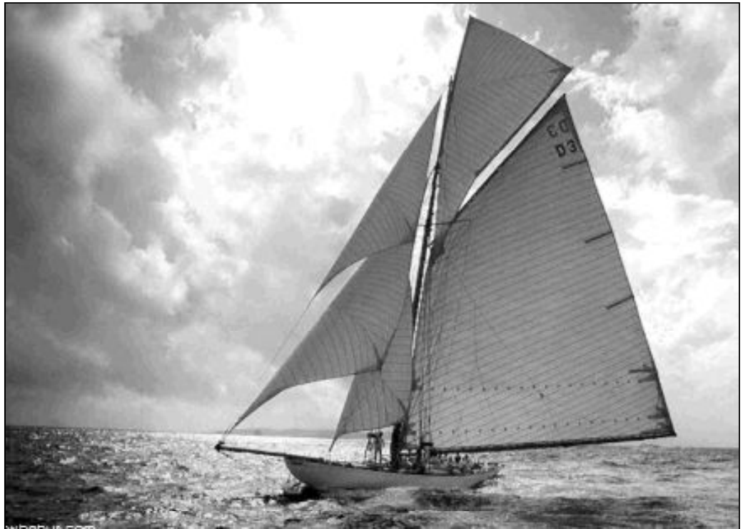
Tu lengua determina el curso de tu vida, igual que el timón dirige al barco

Abstente de decir palabras negativas. Pero eso no basta. Debes elegir palabras positivas y alentadoras acerca de ti mismo y de tu familia. Cuando pronuncias palabras de bendición sobre ti, descubrirás que se convierten en proféticas y se cumplen. Puedes cambiar el mundo en el que vives cambiando tu manera de hablar. En Proverbios 18, 21, la Biblia dice que la muerte y la vida residen en el poder de la lengua, y que te saciarás de los frutos que