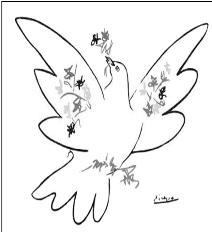
Paloma de la paz del malagueño Picasso

Puestas las bases familiares en la Jornada que celebramos hoy, el Papa nos recuerda que "se debe hacer notar, con pesar, un aumento del número de estados implicados en la carrera de armamentos: incluso naciones en vías de desarrollo destinan una parte importante de su escaso producto interior bruto para comprar armas. Las responsabilidades en este funesto comercio son muchas: están, por un lado, los países del mundo industrialmente desarrollado que obtienen importantes beneficios por la venta de armas y, por otro, están también las oligarquías dominantes en tantos países pobres que quieren reforzar su situación mediante la compra de armas cada vez más