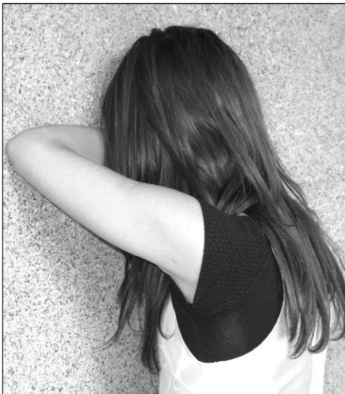
Muchos niños no son valorados por lo que son