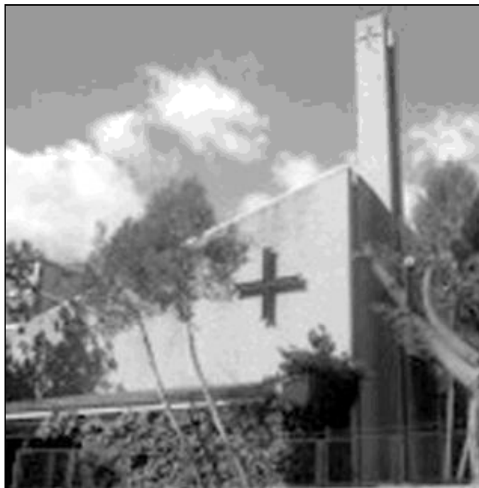
Fachada del templo de Nuestra Señora de los Ángeles

Desde su planificación pastoral, para mejor atender toda la tarea evangelizadora, parte del texto de los Hechos de los Apóstoles en el capítulo 2, donde se afirma que unánimes y constantes, los cristianos acudían al templo, partían el pan en las casas y compartían los alimentos con alegría y sencillez de corazón; alababan a Dios y se ganaban el favor de todo el pueblo. Y ésa es la realidad de la parroquia, como comunidad cristiana en medio de este