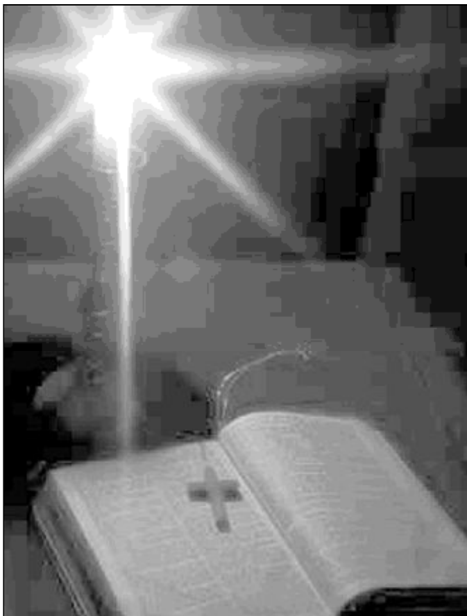
El que anuncia el Evangelio participa de la caridad de Cristo

Es interesante destacar que el documento aborda la relación entre libertad y anuncio del Evangelio, pero siempre advirtiendo que el respeto a la libertad religiosa no debe convertirse en indiferencia ante la verdad y el bien. La caridad exige el anuncio a todos de la verdad que salva, Jesucristo. Es más, en el momento presente es urgente rescatar al hombre del desierto en que vive y conducirlo a la amistad con Aquel que nos da la vida. De hecho, el que anuncia el Evangelio, como apunta el documento, participa de la cari-