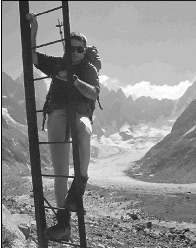
Imagina que al final de esa escalera está tu alegría

Pero nadie puede hacerlo por ti. Debes seguir las etapas necesarias para alcanzar las