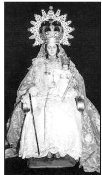
Ntra. Sra. de la Paz, en Ronda

¡Muchas felicidades a todos los que celebráis vuestros patronos! Días para dar gracias a Dios por el testimonio de estos santos.