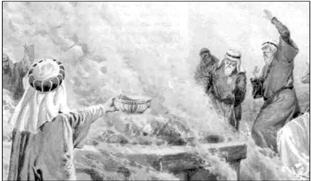
Dios habla por medio del profeta Elías

Si observamos las dos oraciones, sacadas de 1 Reyes, podemos constatar cuán consciente era Elías de su naturaleza humana. Sabía que era solamente un hombre que se acerca humildemente a un Dios santo. Este lado humano de Elías debe hacernos reflexionar en nuestra propia vida y darnos el valor de