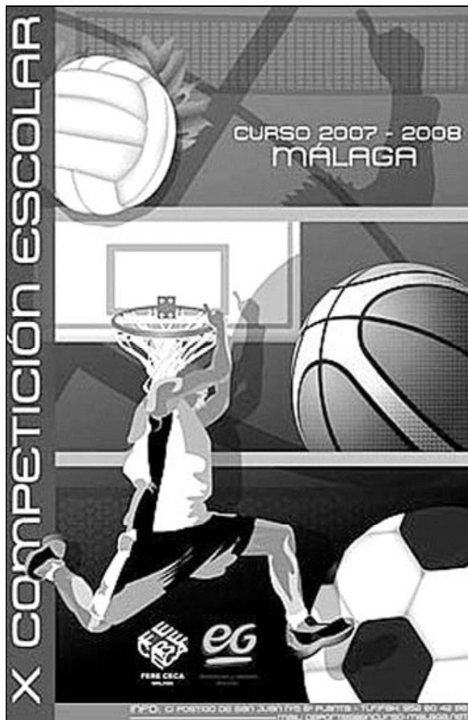
Cartel de la X Competición Escolar