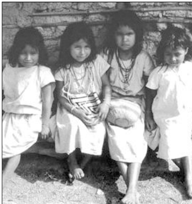
Rostros concretos del desarrollo humano

Esa "gran esperanza sólo puede ser Dios". Así mismo, Benedicto XVI se ha referido al "misterio" del "diseño de Dios", que constituye "la esperanza de la historia". El Papa explicó que