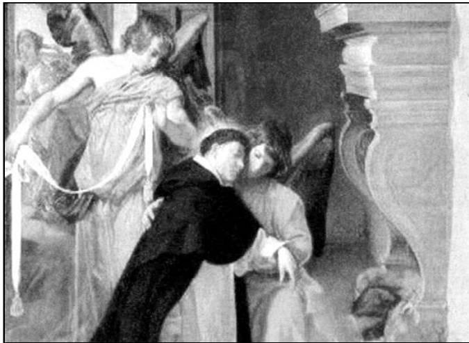
Santo Tomás de Aquino, por Diego de Velázquez

Según el rector del Seminario, los objetivos de este encuentro son: "acrecetar gozosamente la relación afectiva y efectiva