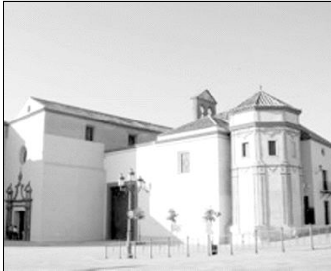
Templo de Santo Domingo de Guzmán

Durante el siglo XVIII se continúan las obras de mejora de las capillas laterales y del convento. Se hace una capilla nueva para el Cristo del Paso, se obra el retablo