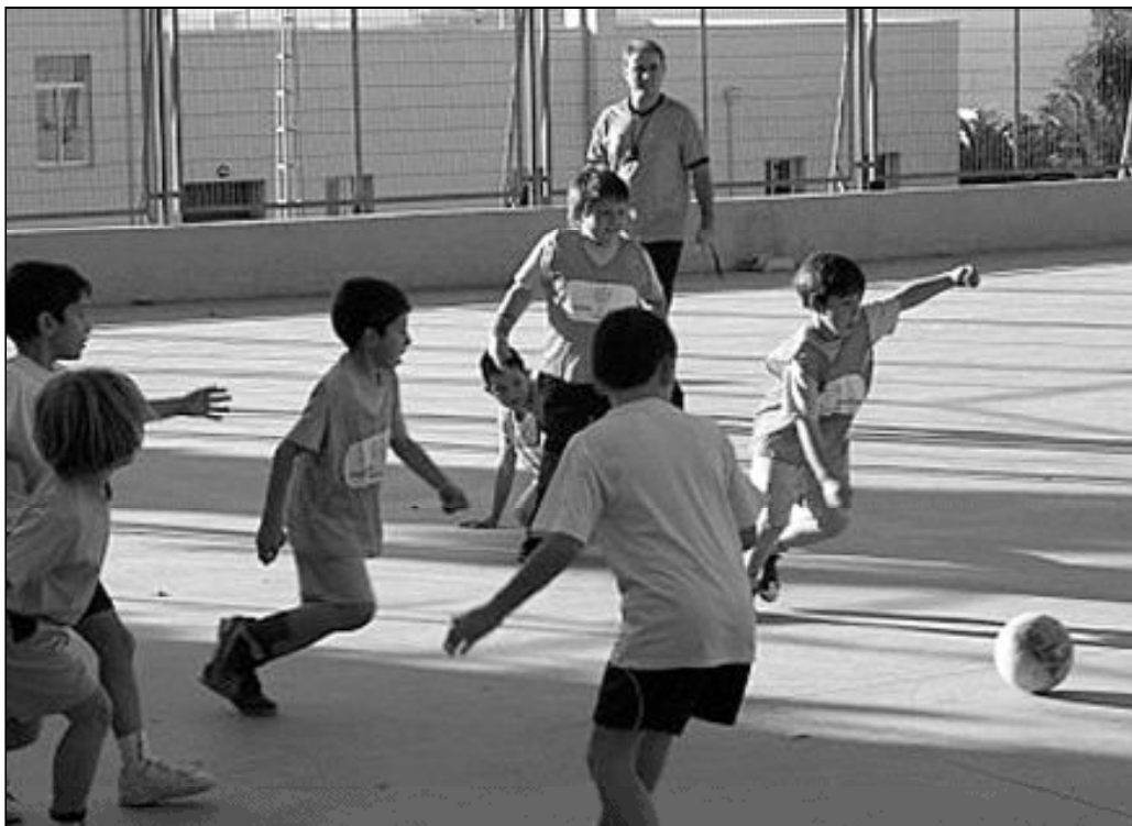
Equipo de niños jugando al fútbol sala en la categoría pre-alevín, en las instalaciones del colegio La Asunción