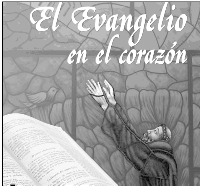
Detalle del cartel que anuncia la Jornada por la Vida Consagrada

Pero su aportación más interesante ha sido la santidad personal, el haber entregado todo su tiempo y sus energías a servir a Dios y al hombre. Es imposible