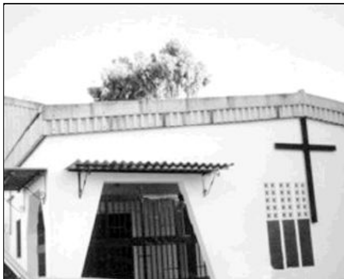
Fachada del templo de Nuestra Señora de las Flores

El templo, en el que ahora mismo se celebran la fe y los sacramentos, se construyó en 1978, siendo Obispo D. Ramón