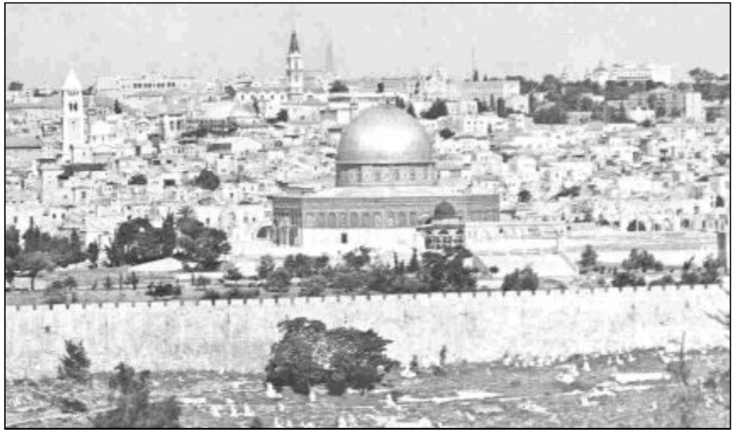
Jerusalén es una de las ciudades de luz que refiere la Biblia

Una polis era un lugar de seguridad. En la Biblia, esta palabra ha sido atribuida a ciudades como Jerusalén, que estaba colocada en una colina, y que tenía sólidas murallas. Esta ciudad era fuente de descanso para los viajeros fatigados. Aseguraba una protección a la gente, que se sentía segura en sus muros. Pero era igualmente un resplandor de esperanza. Con motivo de sus viajes, los hombres y las mujeres intentaban percibir signos que anunciaban la cercanía