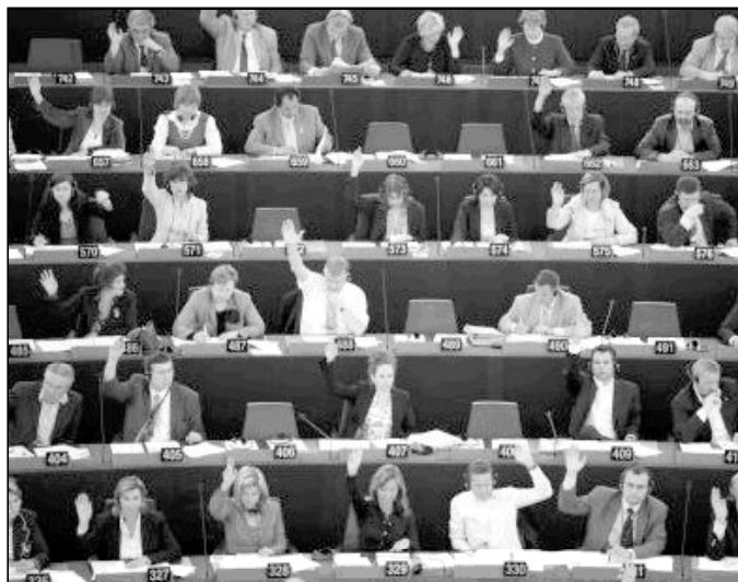
Una votación entre los europarlamentarios