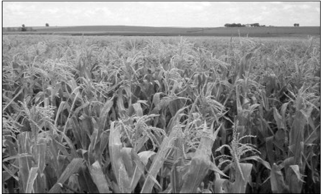
Tu pensamiento es un campo que puede acoger distintas clases de semillas

Pero si la calidad de la cosecha depende principalmente de la semilla empleada, la calidad del campo que la recibe juega igualmente un gran papel. Jesús habla de ella en la parábola del sembrador (Lucas 8,5-15). En ella se describe la semilla de la Palabra de Dios, que da diversas suertes de resultados según la naturaleza del terreno. Y he aquí lo que dice