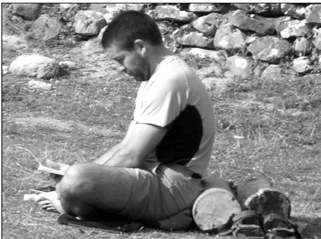
No todos tienen la posibilidad de retirarse del mundo para hacer Ejercicios Espirituales