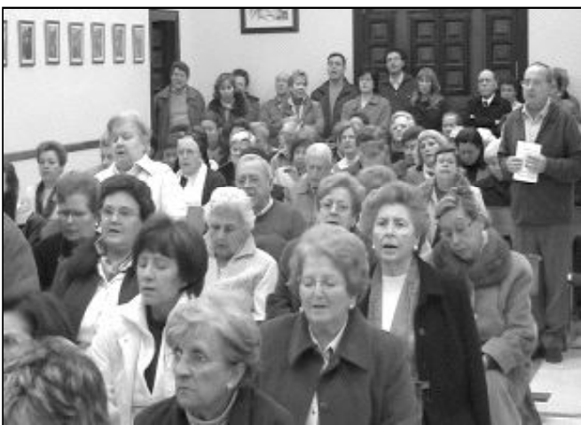
Encuentro de Pastoral de la Salud