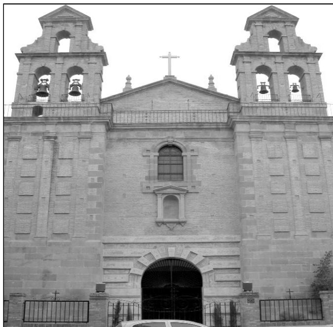
Fachada de la parroquia Nuestra Señora del Carmen