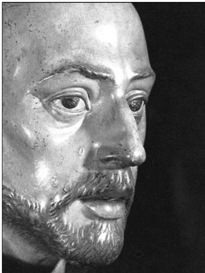
San Ignacio de Loyola, fundador de la Compañía de Jesús