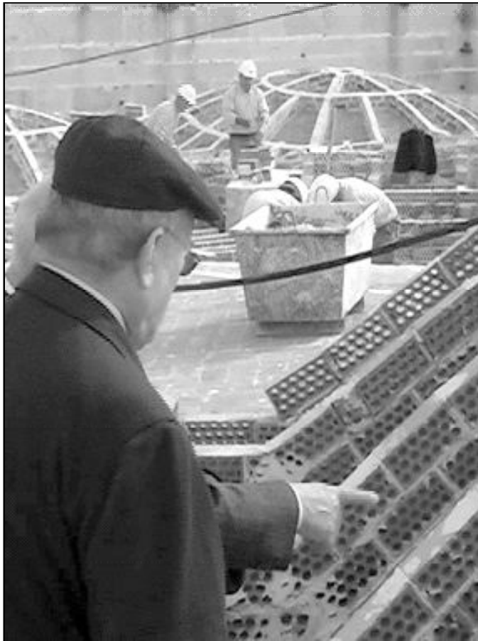
Imágenes de las obras de la cubierta de la Catedral

No todos los canónigos tienen un cargo especial de oficio, pero en Málaga aún se mantienen los siguientes: Penitenciario (D.