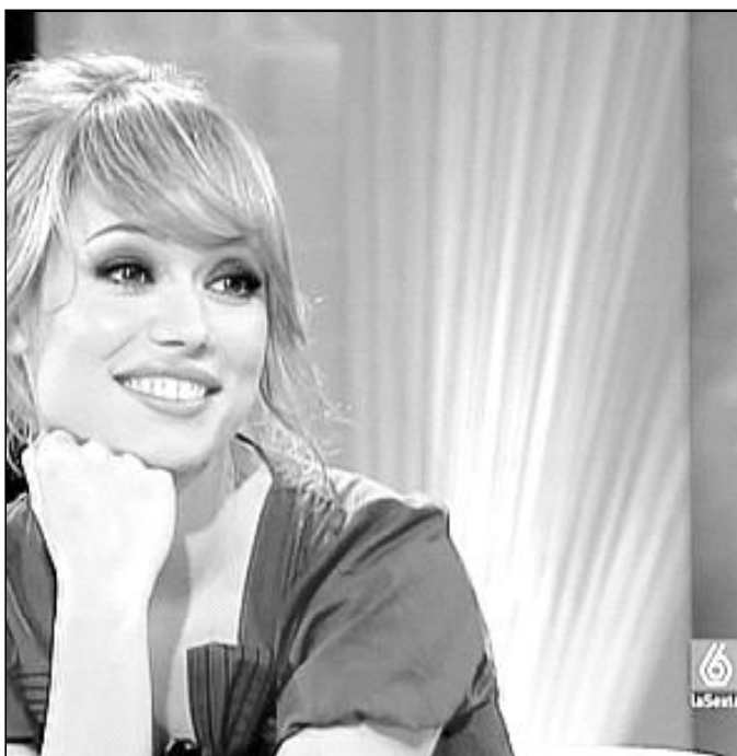
“Vivimos inundados en imágenes y palabras”

Palabra, la Palabra de Dios. En esta época de desarrollo explosivo de las comunicaciones, continúa Lombardi, es una pista de