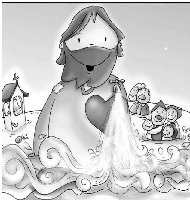
"Inúndanos de tu agua VIVA"

adquiere una nueva visión de la realidad y todo recobra un nuevo sentido. Donde está Jesús siempre hay vida. Cuando nos empeñamos en calmar nuestra sequedad con simple agua, tarde o temprano, volveremos a tener sed. Vivimos tan preocupados por la exterioridad en todo, que no nos paramos en sumergirnos en el gran pozo de la Salvación. ¿Podremos resistir a tantas contradicciones internas y externas en un mundo donde todo se mide, menos la profundidad de las