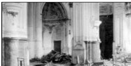
Las iglesias de Santiago (arriba) y de San Juan (abajo) fueron quemadas en 1931

Encuentro un foco que puede arrojar un poco de luz sobre este problema en un texto del último libro de Benedicto XVI, "Jesús de Nazaret". En el capítulo dedicado al bautismo de Jesús (concretamente en las páginas 33 y 34 de la edición española) hay una referencia a los dos ámbitos: el político-civil y el religioso (Dios y el César) que, desde el punto de vista cristiano, están llamados a convivir cada uno desde su autonomía. Pero, "el Imperio se considera a sí mismo divino", como lo da a entender la figura del emperador Augusto proclamándose "Salvador de la Humanidad". Entonces, situado en esta encrucijada, el cristiano "debe obedecer a Dios antes que a los hombres" (Hch 5, 29) y puede llegar al extremo de convertirse en mártir.