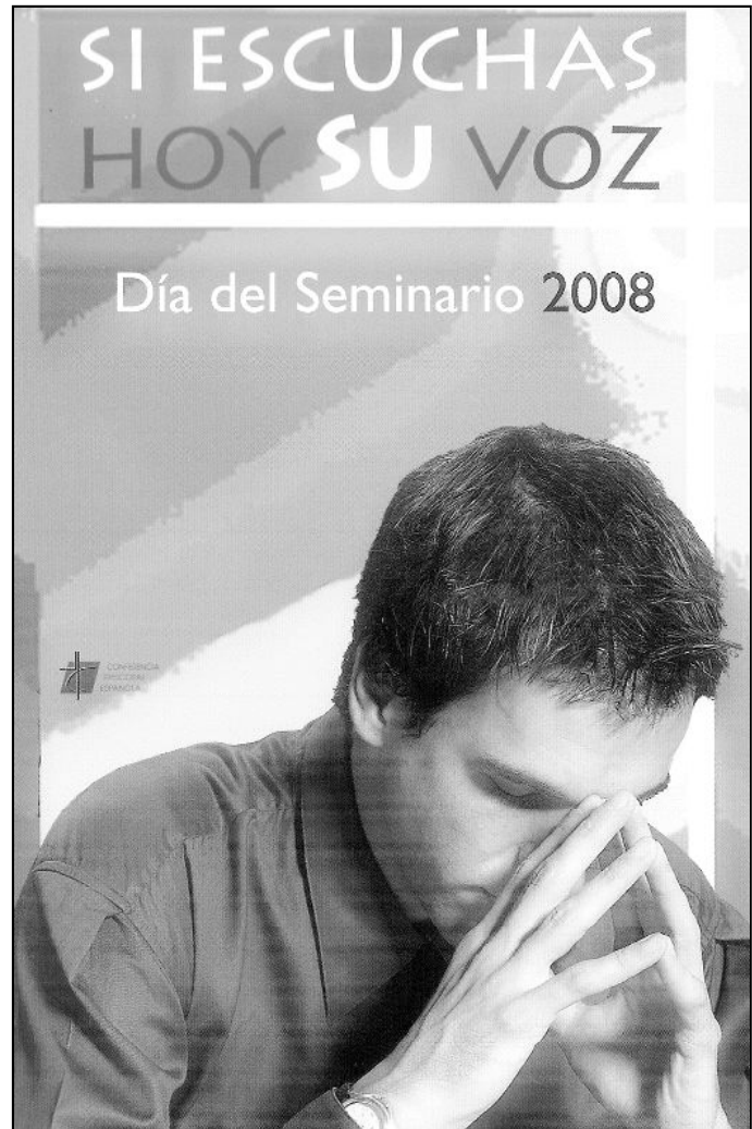
Cartel que anuncia el Día del Seminario 2008