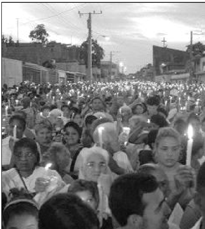
Multitudinaria procesión en Guantánamo

El cardenal Bertone recordó los pasos adelante que se dieron en esta dirección tras la visita que el papa Juan Pablo II hizo a la isla hace diez años. "Espero que después de mi visita también haya algún buen fruto", añadió.