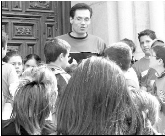
Imágenes de la experiencia "Venid y lo veréis" del año pasado