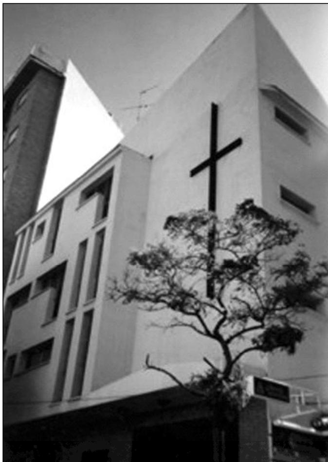
Fachada de la parroquia de San Antonio María Claret

Es un edificio de tres plantas: en la primera planta, nos encontramos el despacho del párroco y un salón para catequesis; en la segunda, hay otro salón parroquial; y en la tercera, la casa del párroco.