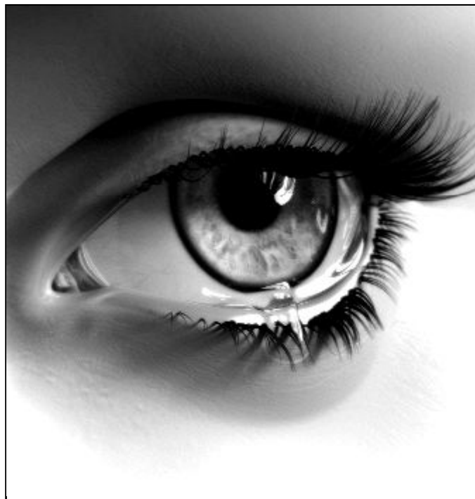
Sólo Dios puede librar al corazón amargo

Quita el círculo vicioso de este género de actitudes, reemplazándolas en tu vida mediante una buena trayectoria vertical. Pídele perdón a