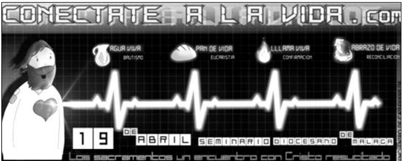
Cartel del encuentro de perseverancia 2008