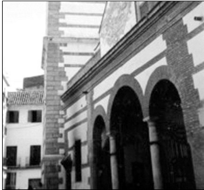
Fachada de la parroquia de los Santos Mártires

La iglesia alberga un gran número de imágenes, de gran calidad artística alguna de ellas: Las de los santos patronos Ciriaco y Paula, Ntra. Sra. de los Remedios, Ntra. Sra. del Carmen, la Virgen de la Concepción, Virgen del Amor Doloroso, Virgen de las Lágrimas y una tabla del siglo XV de San Cosme y San Damián en depósito en el Obispado. Otras imágenes de consideración son: N. S. de los Dolores, una Inmaculada muy antigua en madera, N. Padre Jesús Orando en el Huerto etc.