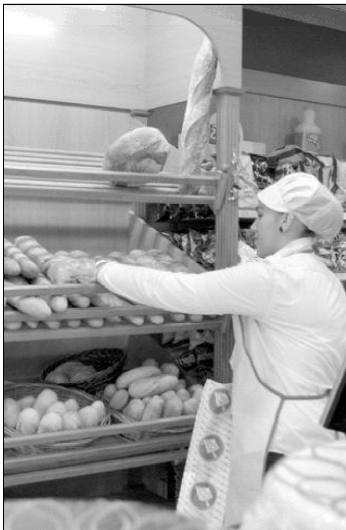
Quedan muchas mejoras por hacer en el mundo laboral femenino