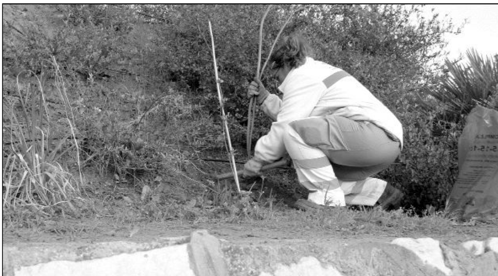
El 96% de los que abandonan una ocupación remunerada por motivos familiares o personales son mujeres

Es sólo un fragmento actual de los muchos documentos y discursos que se han publicado en la