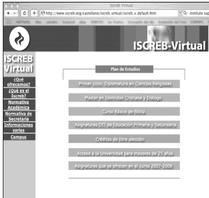
www.iscreb.org es la web del Instituto de Teología por internet

En cuanto a la idoneidad afirma que "desde su fundación en 1996 el Instituto Superior de Ciencias Religiosas de Barcelona (ISCREB) trabajó intensamente en tener un Equipo Directivo cohesionado, un daustro de profesores de calidad y un plan de estudios adecuado. Cuando tuvimos organizados los estudios presenciales clásicos, empezamos a pensar en el salto a los estudios virtuales. Pusimos especial aten-