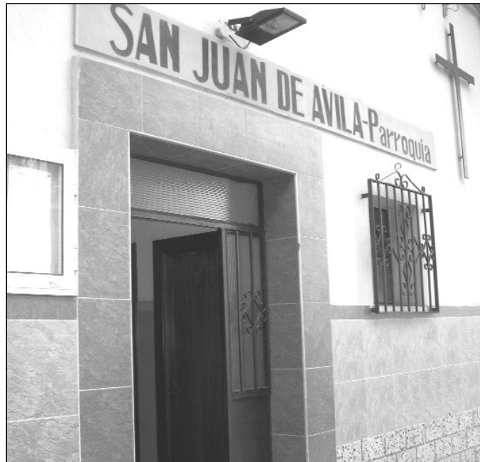
Fachada de la parroquia San Juan de Ávila

Su comienzo y por tanto creación tuvo lugar cuando la diócesis de Málaga estaba servida por Monseñor D. Ángel Suquía, y la fecha en la que fue erigida