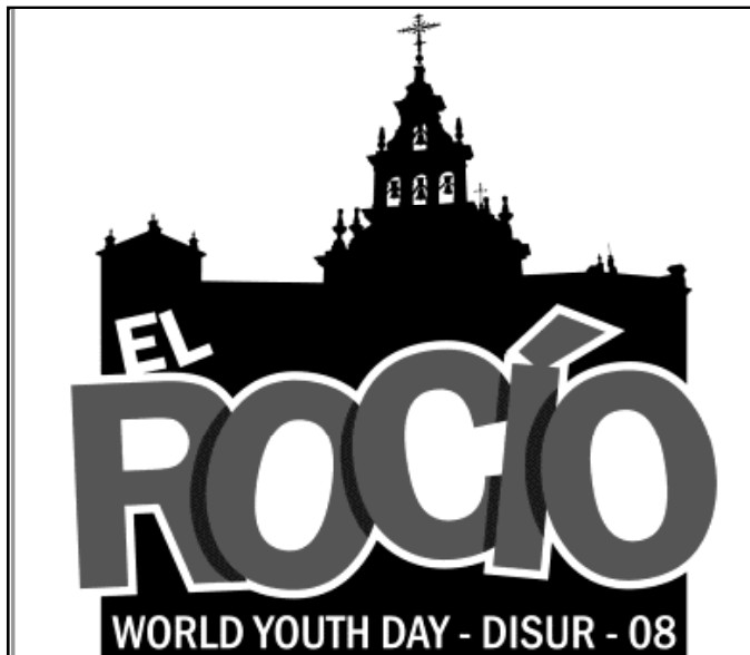
Logo del Encuentro de Jóvenes de las Diócesis del Sur en El Rocío

Debido al elevado coste del viaje a Sydney para participar en la Jornada Mundial de la