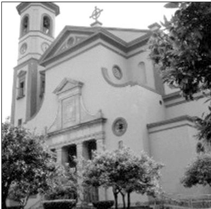
Fachada de la parroquia San José Obrero

El templo tiene un enclave peculiar, ya que delante de un gran jardín, levantada sobre una escalinata de cuatro escalones a lo ancho de toda la fachada, se encuentra una primera entrada al templo, constituida por tres grandes arcos de piedra que dan paso a un pequeño atrio. Adosada a la misma fachada se eleva majestuosa la torre del campana-