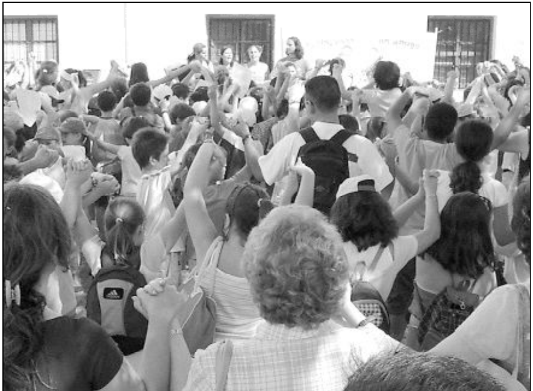
Alumnos y padres en un colegio de Ronda