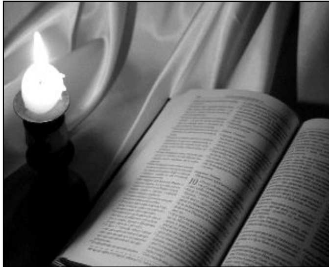
La gente pide ayuda para entender el significado de la Biblia

De la población adulta encuestada en los Estados Unidos, Reino Unido, Holanda, Alemania, España, Francia, Italia, Polonia y Rusia surge una petición: ayuda para entender el significado de la Biblia, sobre todo para la propia vida y la vida en comunidad. Así se desprende de la investigación sobre «La lectura de las Escrituras en algunos países», realizada por «GfK Eurisko», bajo el patrocinio de la Federación Bíblica Católica, una encuesta realizada con vistas al sínodo de los obispos sobre «La Palabra de Dios en la vida y en la misión de la Iglesia» que se celebrará el próximo mes de octubre en el Vaticano. En conjunto, el estudio revela la percepción, por parte del lector, de la Biblia como algo difícil. Esta conclusión es uno de los principales resultados del estudio, unos resultados que serán útiles a los padres sinodales para que sepan que la gente no