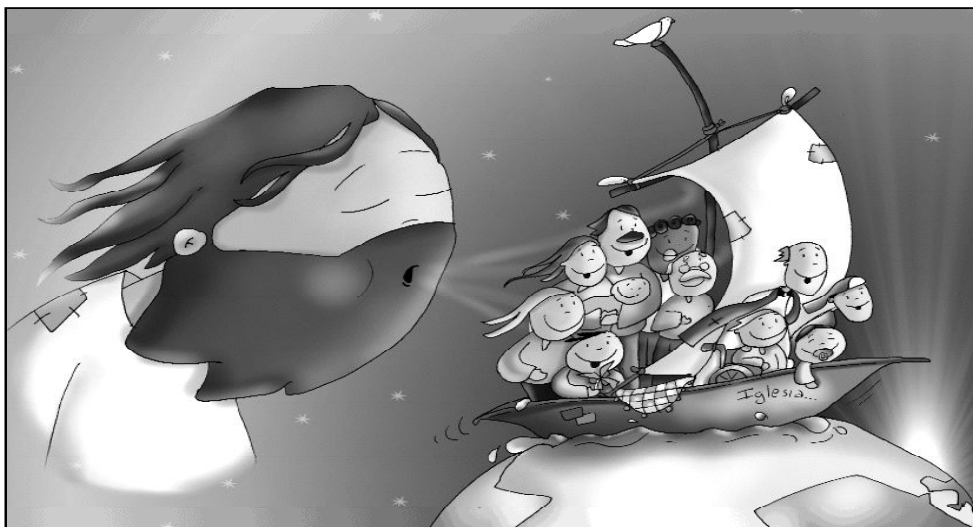
"Y exhaló su aliento"