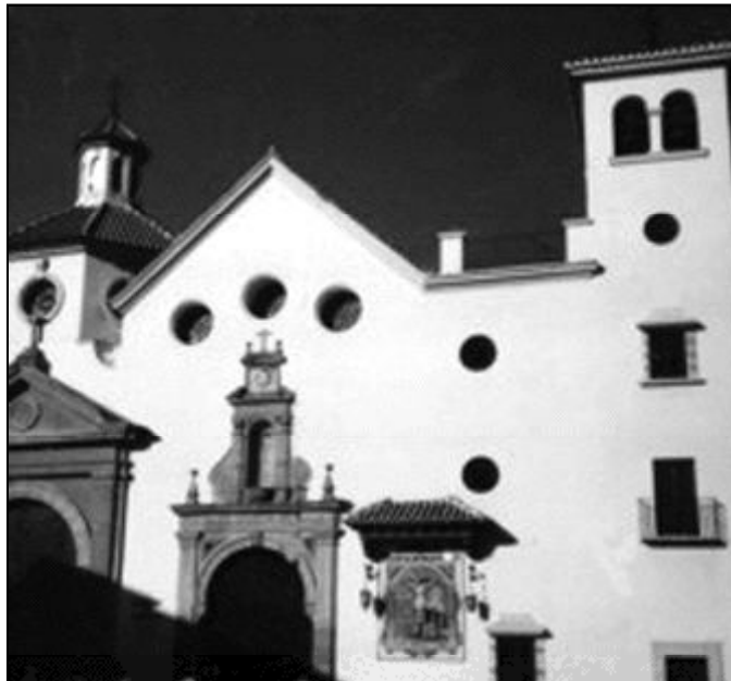
Fachada de la parroquia de San Pedro Apóstol, en Málaga capital

De esta manera están siguiendo itinerarios formativos en las diversas etapas de la Catequesis (niños, jóvenes, adultos) y trabajando especialmente con los padres y adultos, en clave de "primer anuncio" y de iniciación cristiana. Lo que