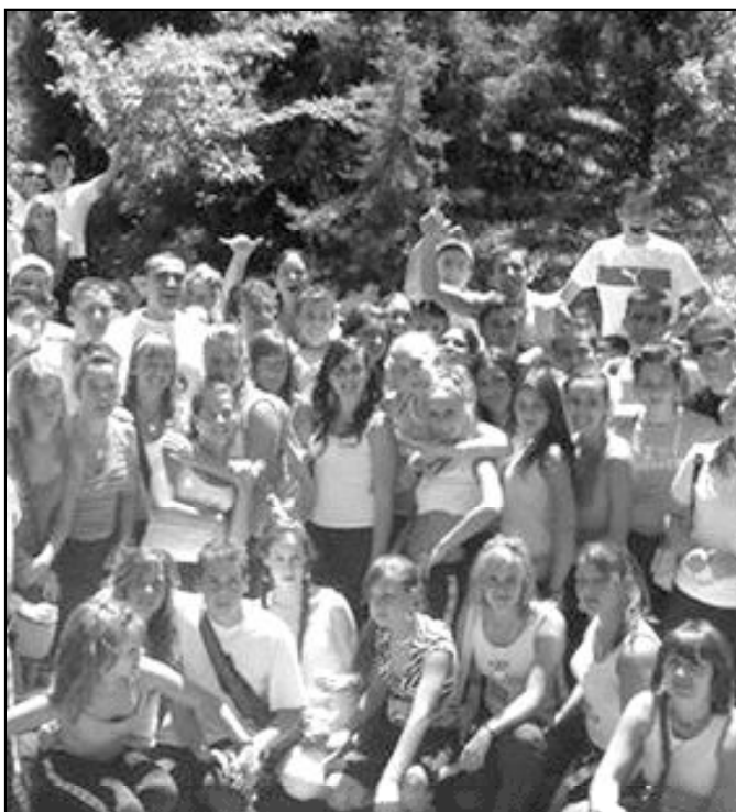
Convivencia de alumnos de 4º de ESO

Se comienza con la marcha-convivencia que se organiza para el alumnado de secundaria de todos los colegios de la Fundación en los montes de Málaga; se sigue con el encuentro deportivo, destinado a todo el alumnado de los niveles de 5º y 6º de primaria (atletismo, juegos populares, baloncesto, fútbol...). Y se concluye el ciclo de actividades con la convivencia de los alumnos de 3º y 4º que han recibido el sacramento de la comunión en cada curso escolar. También forman parte de estas actividades los encuentros que, con motivo de la Navidad, se organizan para los alumnos de 1º y 2º de primaria (certámenes de villancicos y representaciones teatrales) y los distintos