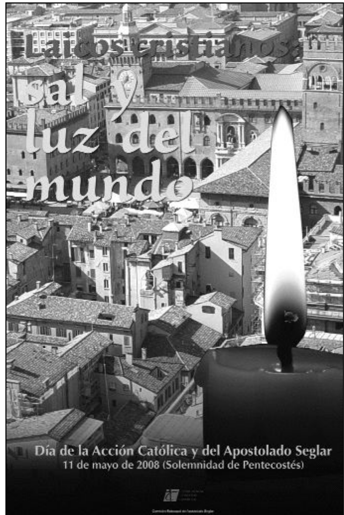
Cartel anunciador del Día de la Acción Católica y del Apostolado Seglar