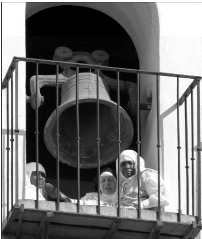
Una de las últimas fotos realizada a las H. Dominicas

En nuestra diócesis no existe ninguna comunidad contemplativa masculina, y en los últimos diez años se han cerrado dos conventos femeninos: las Agustinas de Antequera y las Dominicas de Málaga; pero estos datos no son alarmantes. Según Ildefonso López, "el número de vocaciones a la vida contemplativa, lo mismo que a la vida sacerdotal, ha descendido. Pero no creo que hoy el Señor llame a menos jóvenes a que se consagren a Él en la vida religiosa o en el ministerio sacerdotal. Si echamos una mirada a España, el número de religiosos en nuestros monasterios ha descendido, no obstante hay algunas comunidades con abundantes vocaciones. Por ejemplo, las Clarisas Franciscanas de Lerma, las Dominicas de Valladolid, las Carmelitas de Getafe. En nuestra diócesis hay que destacar los conventos de las Clarisas de Antequera, las Carmelitas Descalzas de