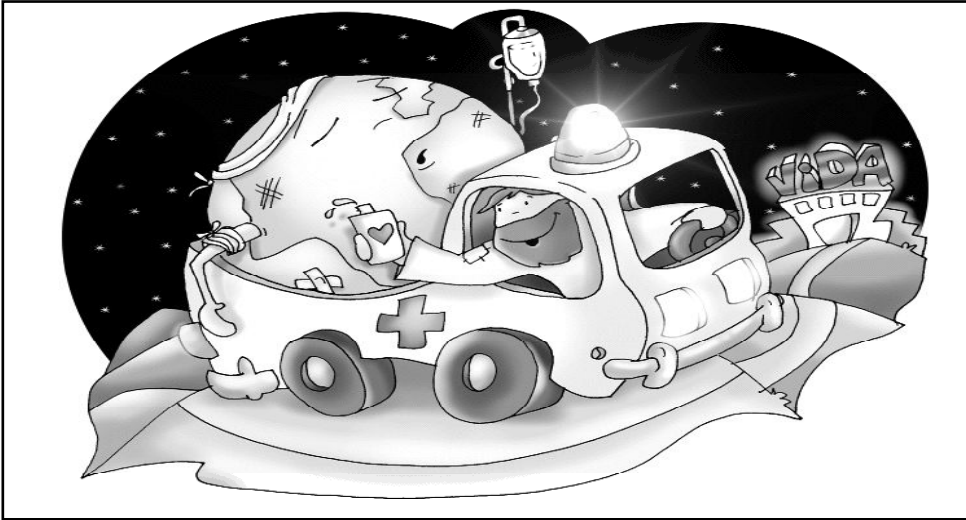
"Envió a su Hijo para salvar al mundo"